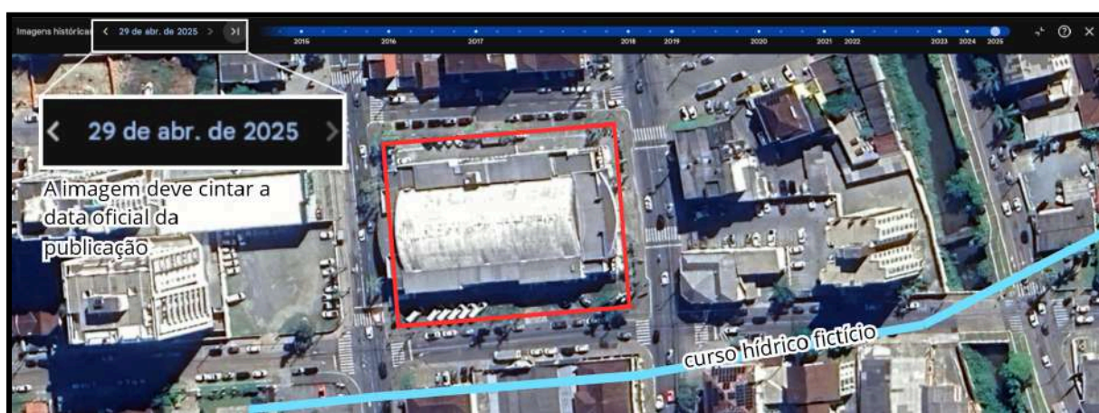
F03 - Edificação Existente Posterior a 2016.