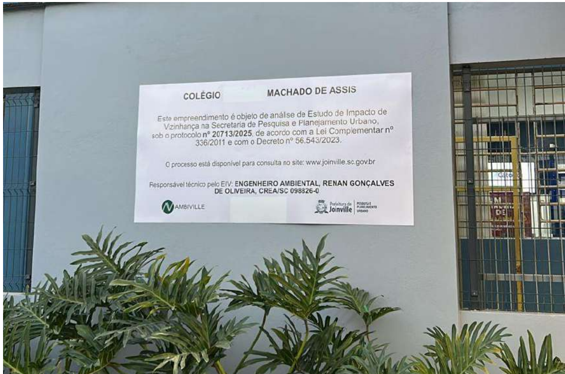
Figura 2: Placa instalada em frente a unidade do ensino infantil/fundamental.

ESTUDO DE IMPACTO DE VIZINHANÇA CENTRO EDUCACIONAL MACHADO DE ASSIS LTDA. torna público que requereu à Prefeitura Municipal de Joinville, sob o protocolo nº 20713/2025, a análise de EIV do COLÉGIO CATÓLICA MACHADO DE ASSIS, localizado na Rua Herval do Oeste, n°s 306 e 335, sala 01, Bairro Saguauçu, CEP 89221-200, Joinville/SC, nos termos da Lei Complementar nº 336/2011 e do Decreto nº 56.543/2023. O processo está disponível para consulta no site: www.joinville.sc.gov.br