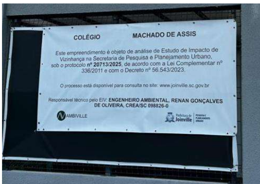
Figura 1: Placa instalada em frente a unidade do ensino médio.