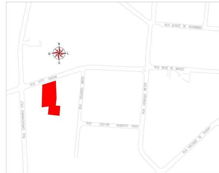
Planta de Localização Esc: 1:2500