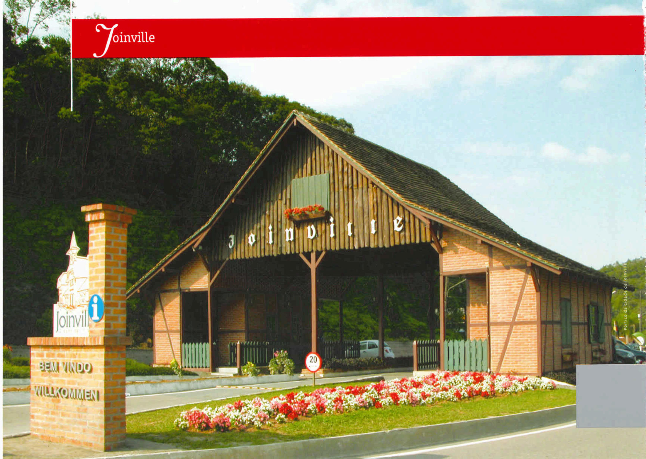
Pórtico da cidade de Joinville