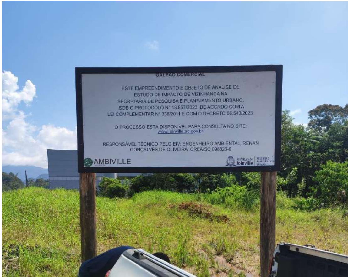
Figura 1: Placa instalada no imóvel.