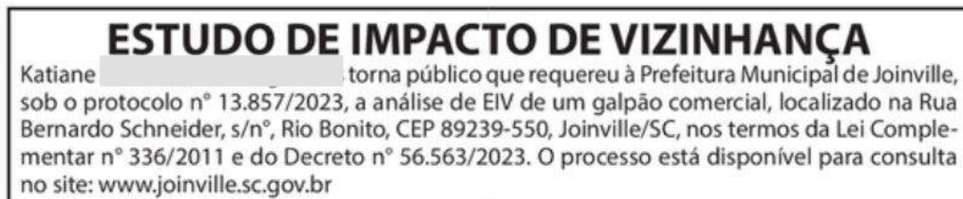
Figura 2: Recorte da publicação legal.