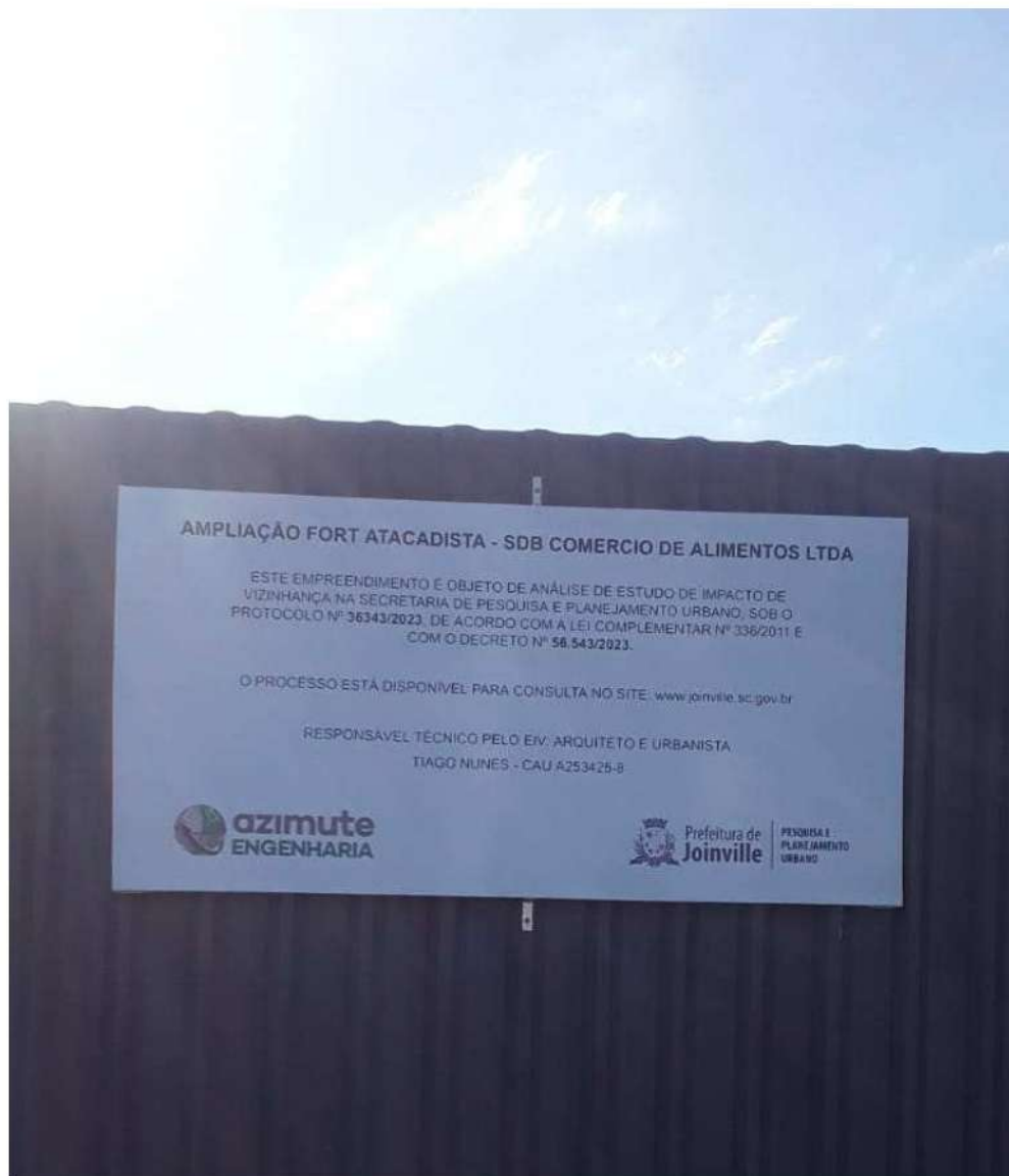
Placa na divisa do empreendimento com a Av. Procópio Gomes