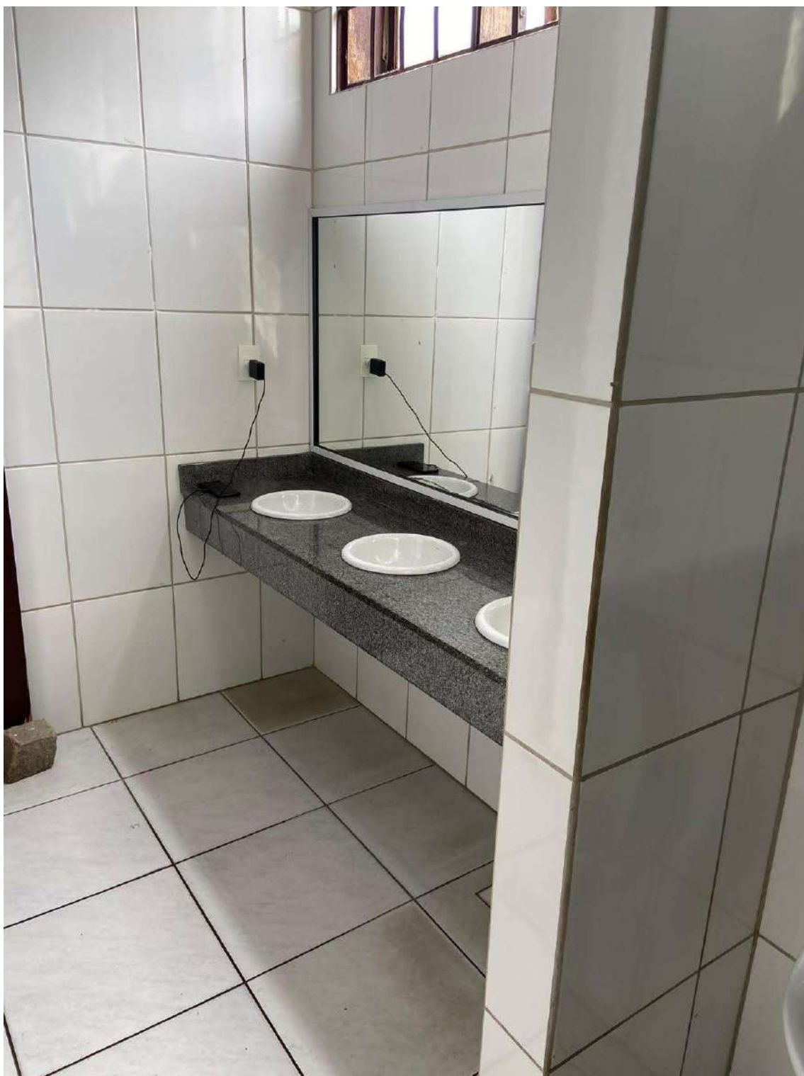
Figura 16: interno banheiro posterior