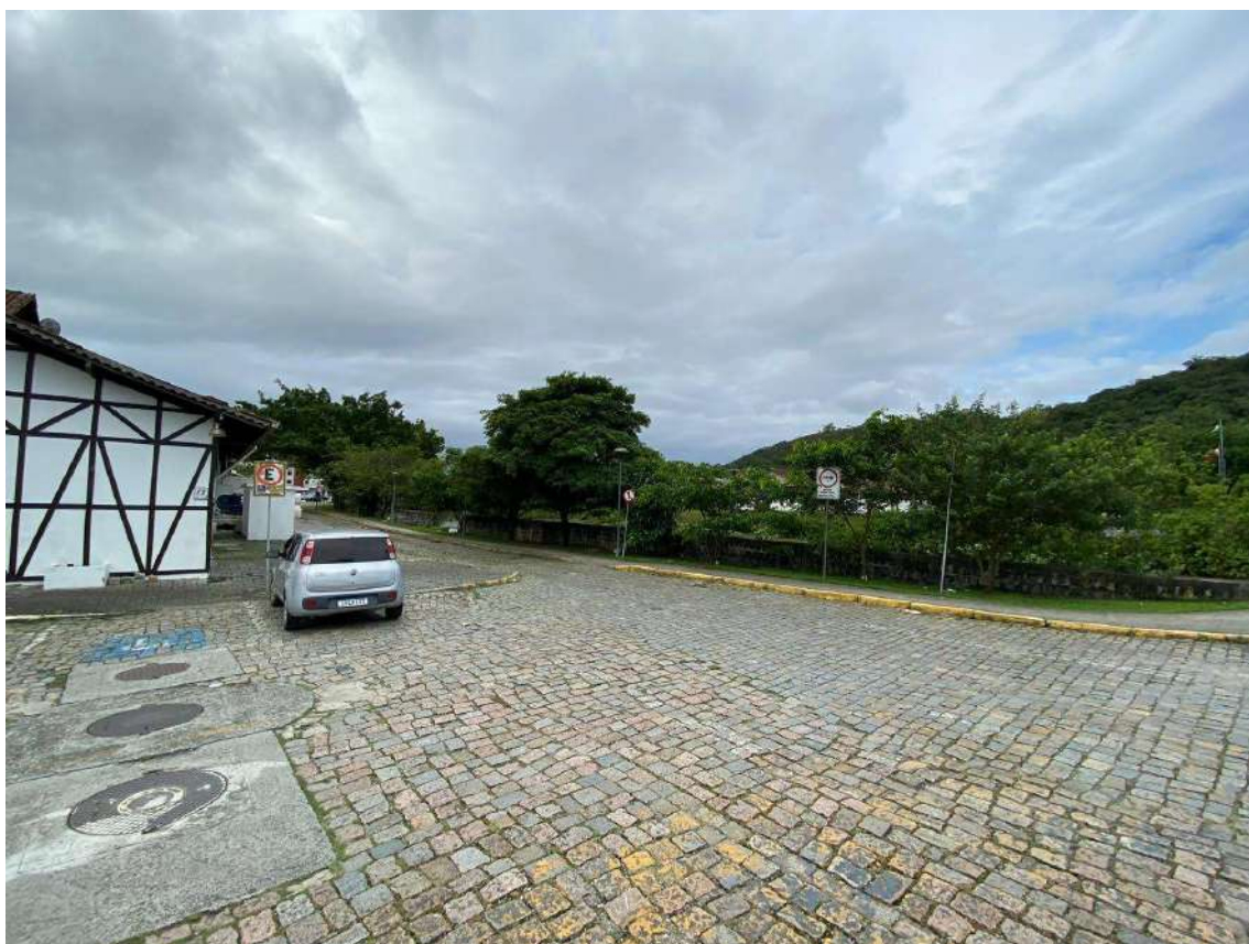
Figura 8: externo