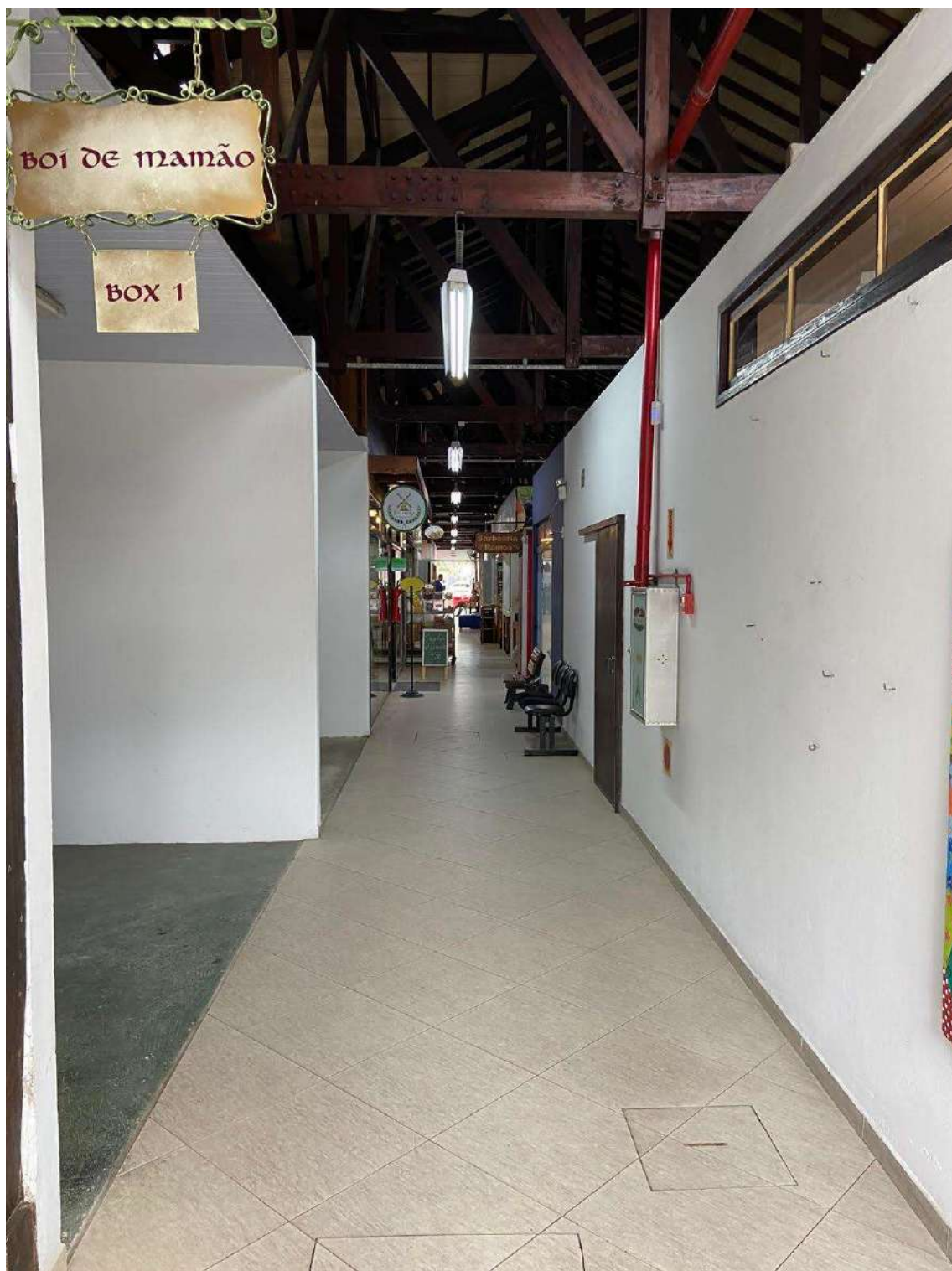
Figura 17: circulação interna