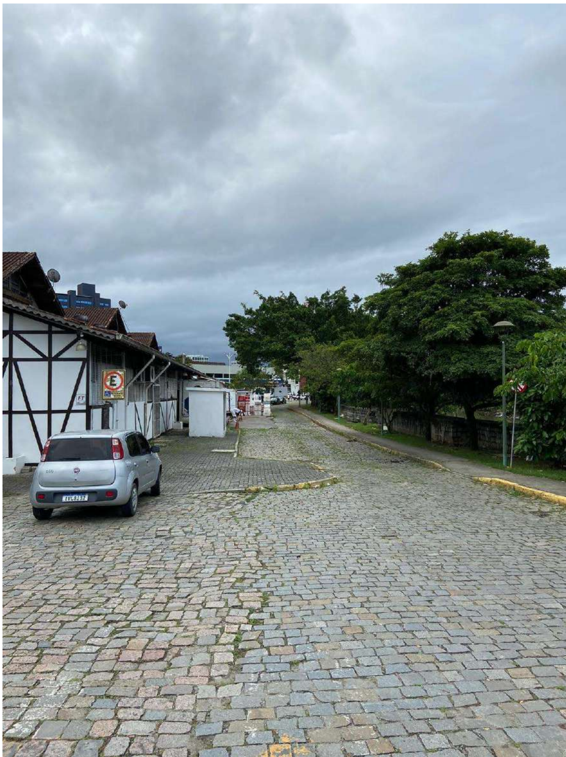
Figura 9: externo para o Rio Cachoeira