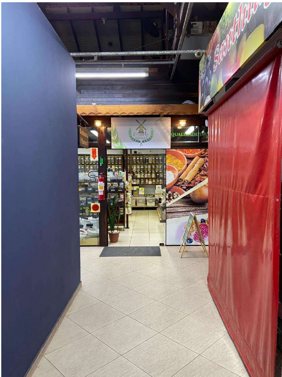
Figura 23: circulação entre corredores