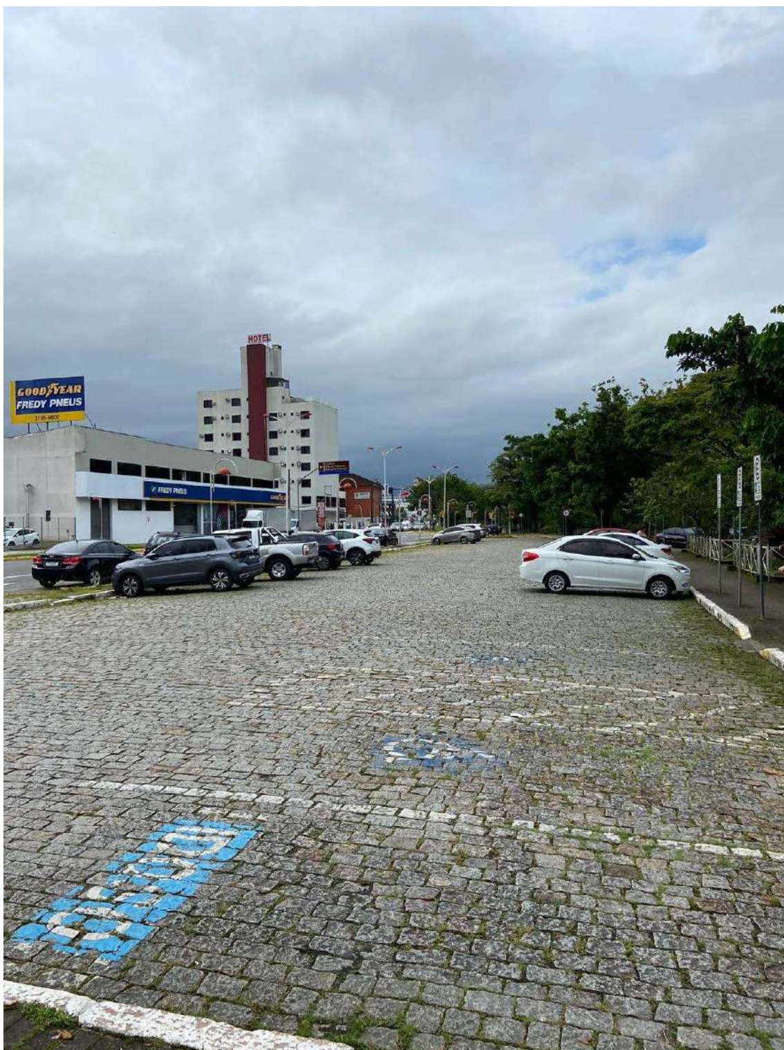
Figura 27: estacionamento fundos