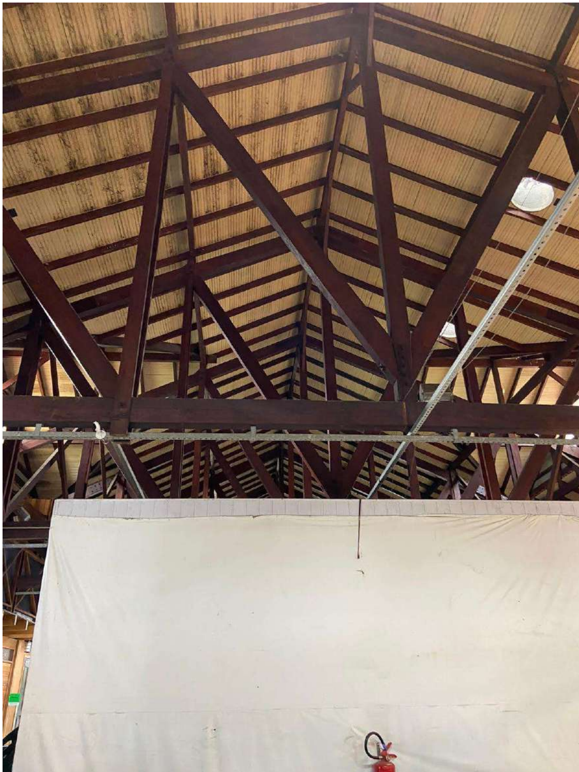
Figura 25: cobertura