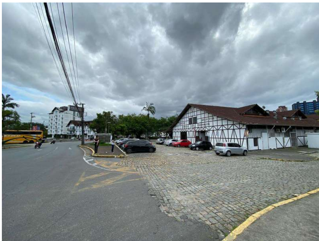
Figura 7: externo diagonal