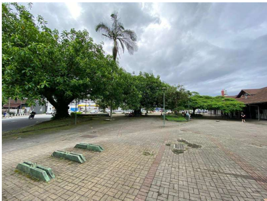
Figura 5: externo implantação