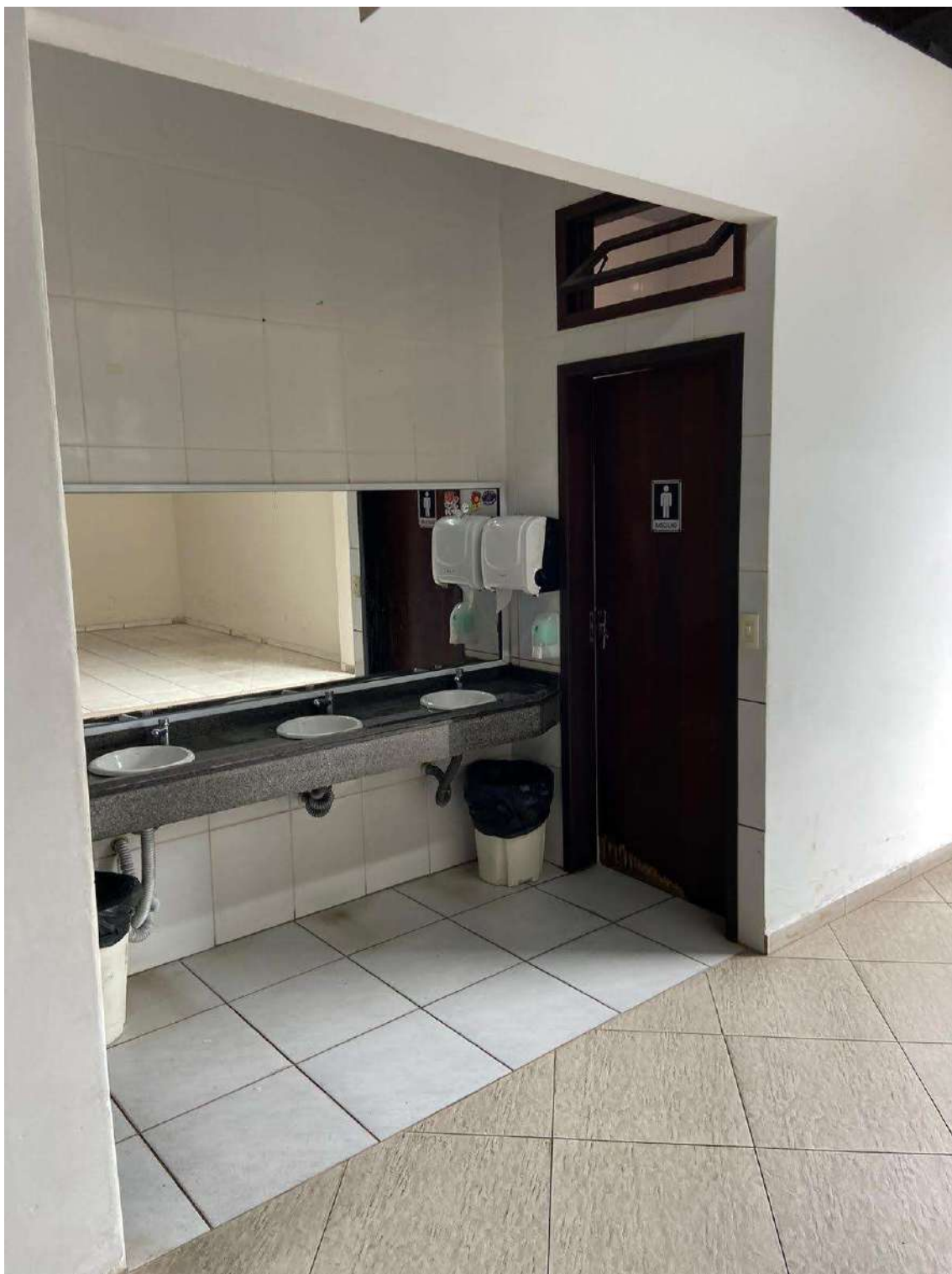
Figura 14: acesso banheiros frontal