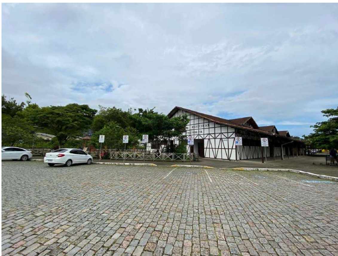
Figura 26: estacionamento fundos