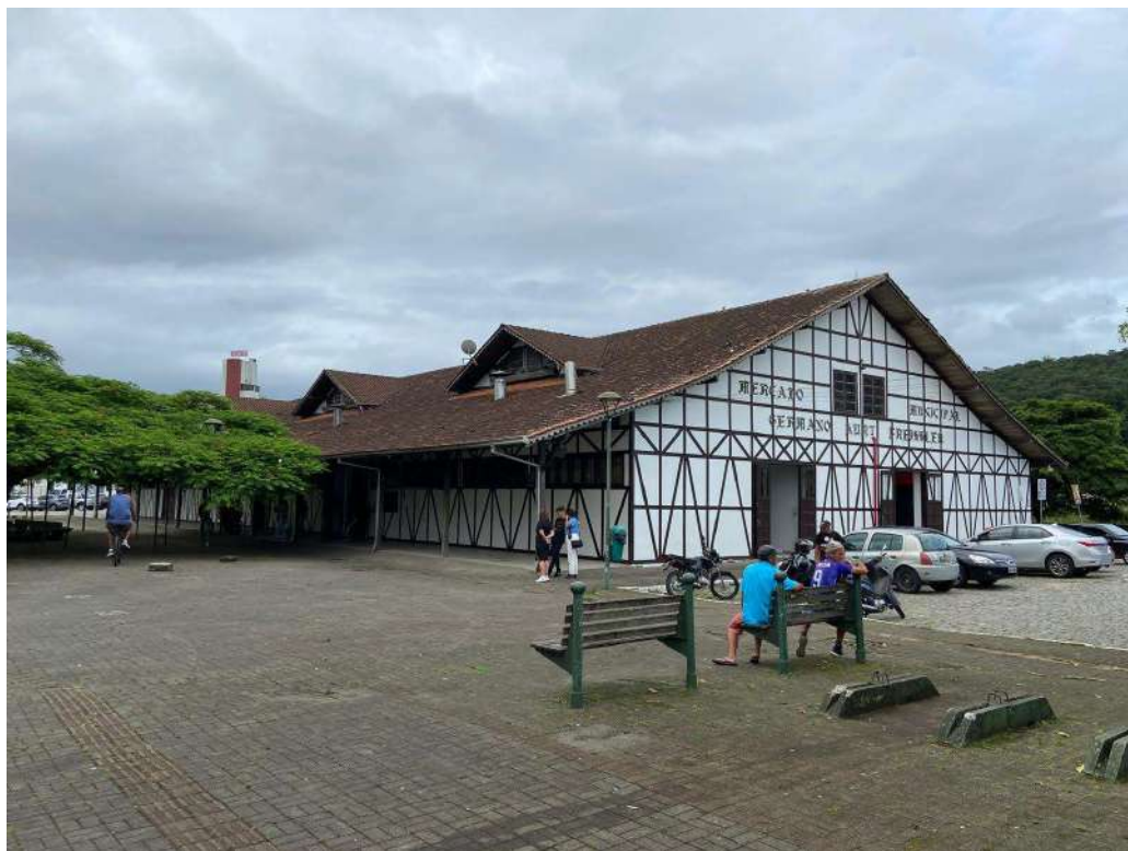
Figura 3: externo frontal