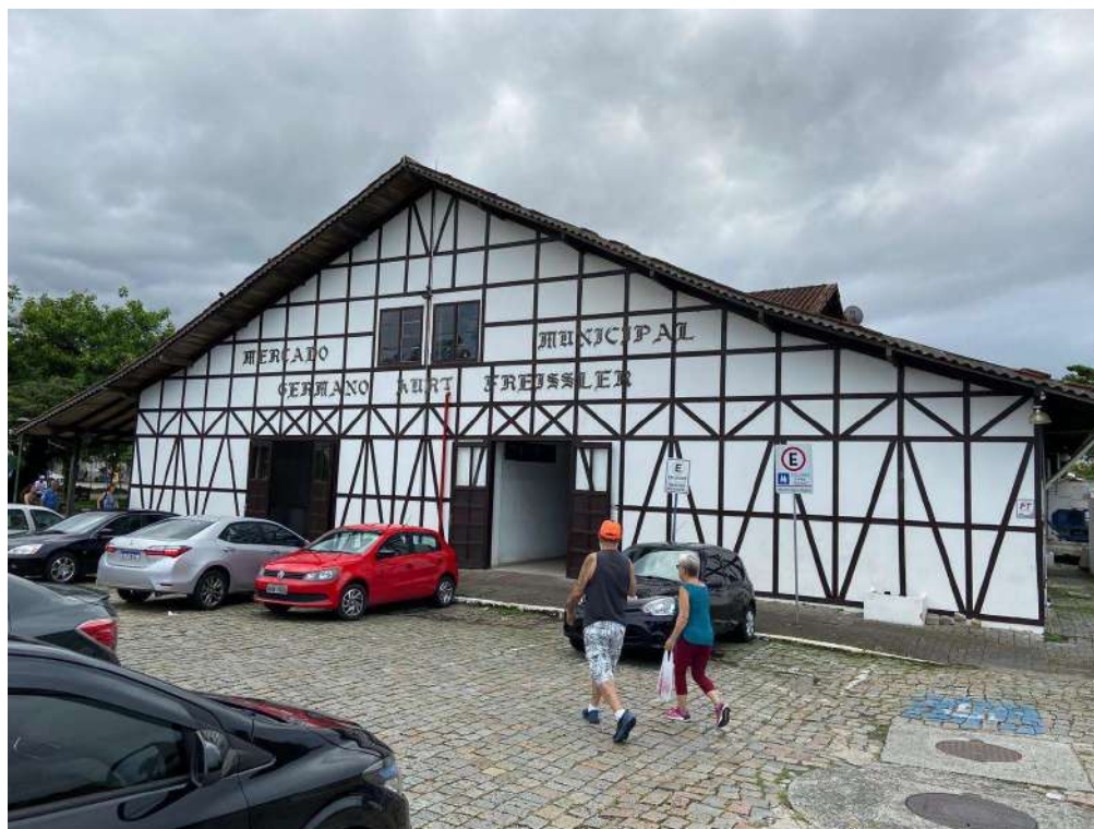
Figura 11: fachada frontal