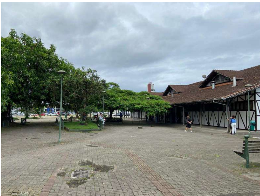
Figura 6: externo lateral