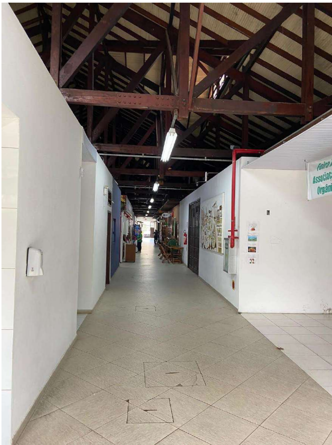
Figura 20: circulação interna