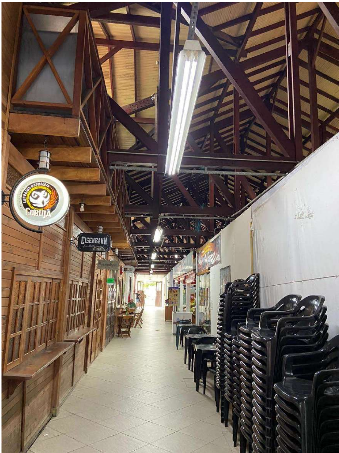
Figura 24: circulação