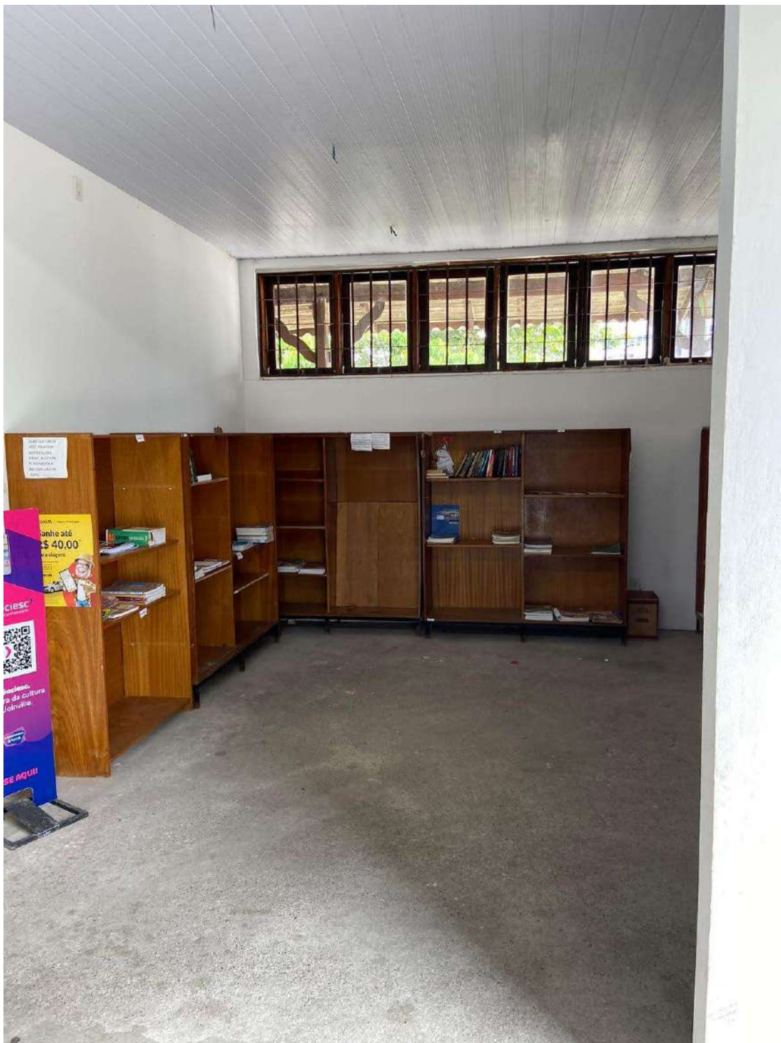
Figura 22: BOX