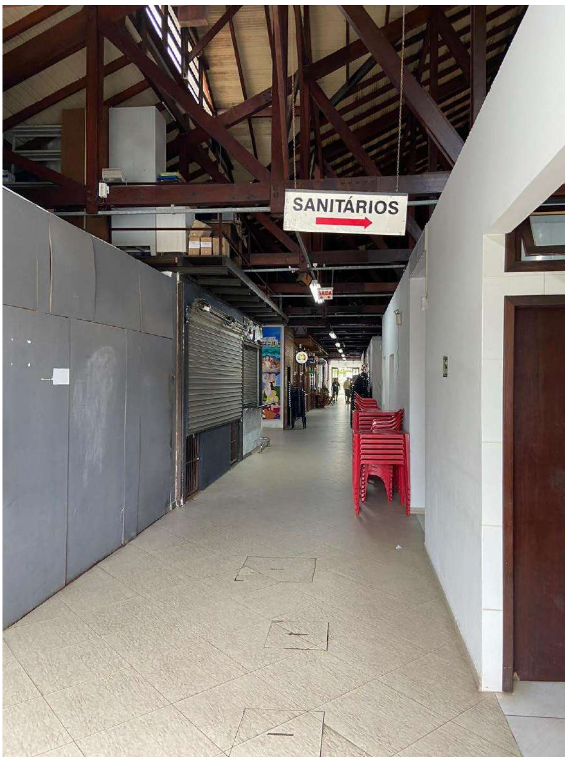
Figura 12: circulação interna