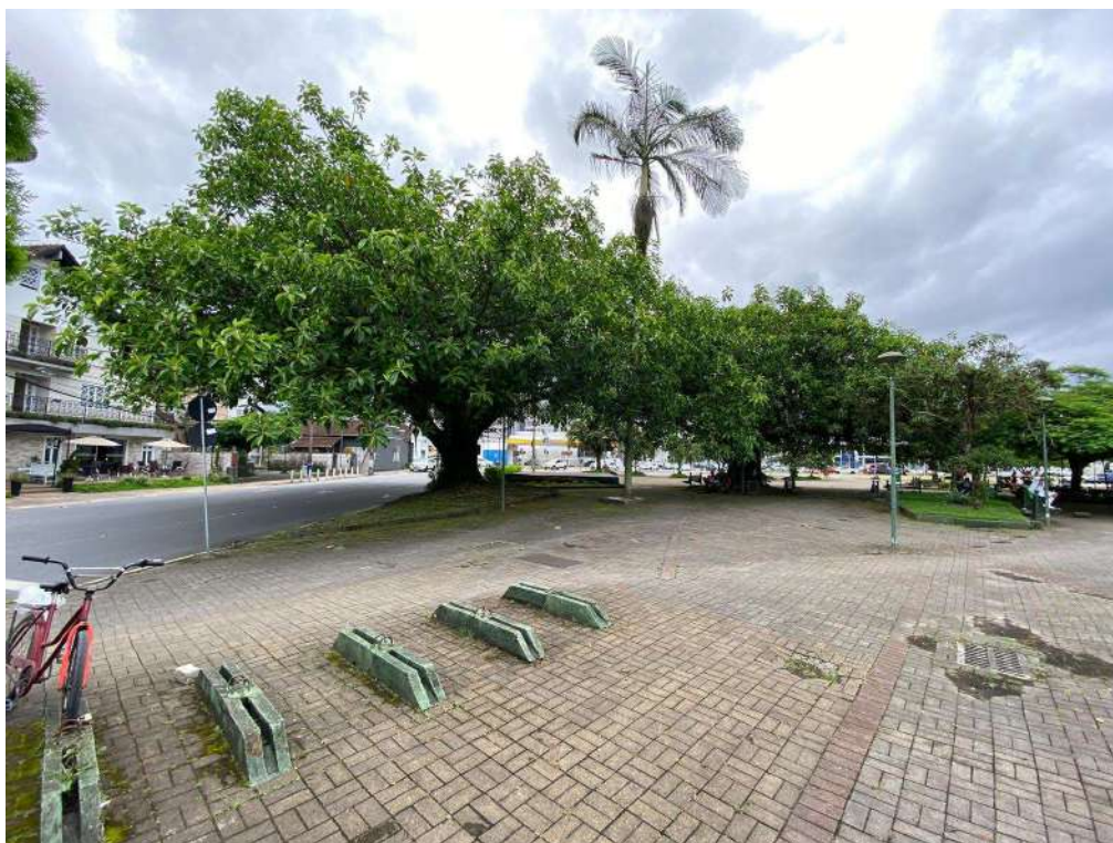
Figura 4: externo implantação