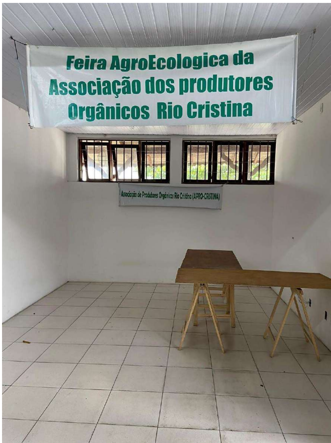
Figura 19: padrão de BOX