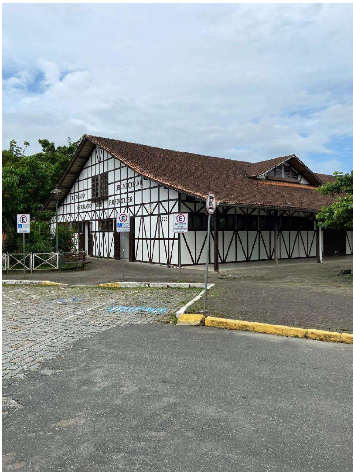
Figura 28: fachada fundos