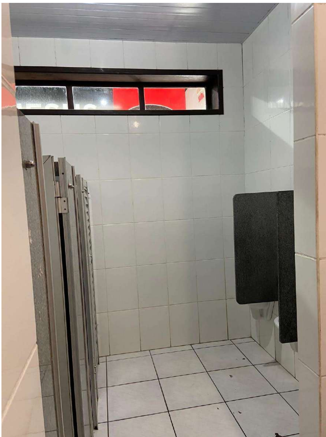
Figura 15: interno banheiro