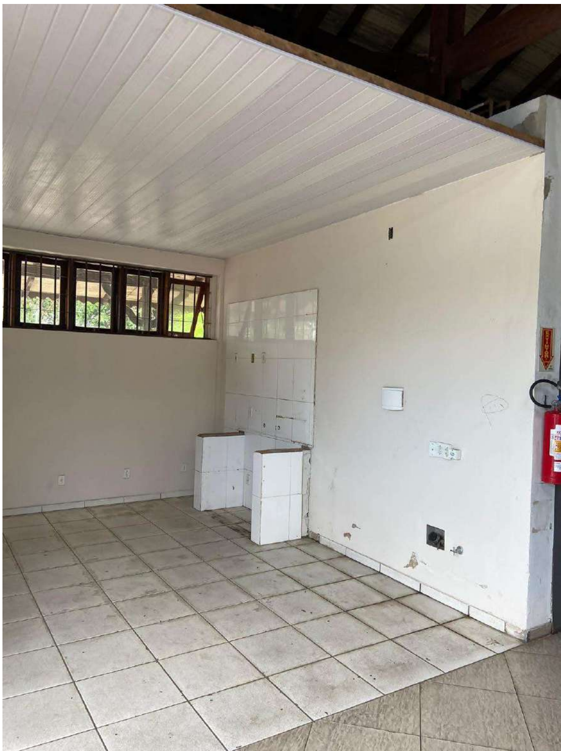
Figura 18: padrão de BOX