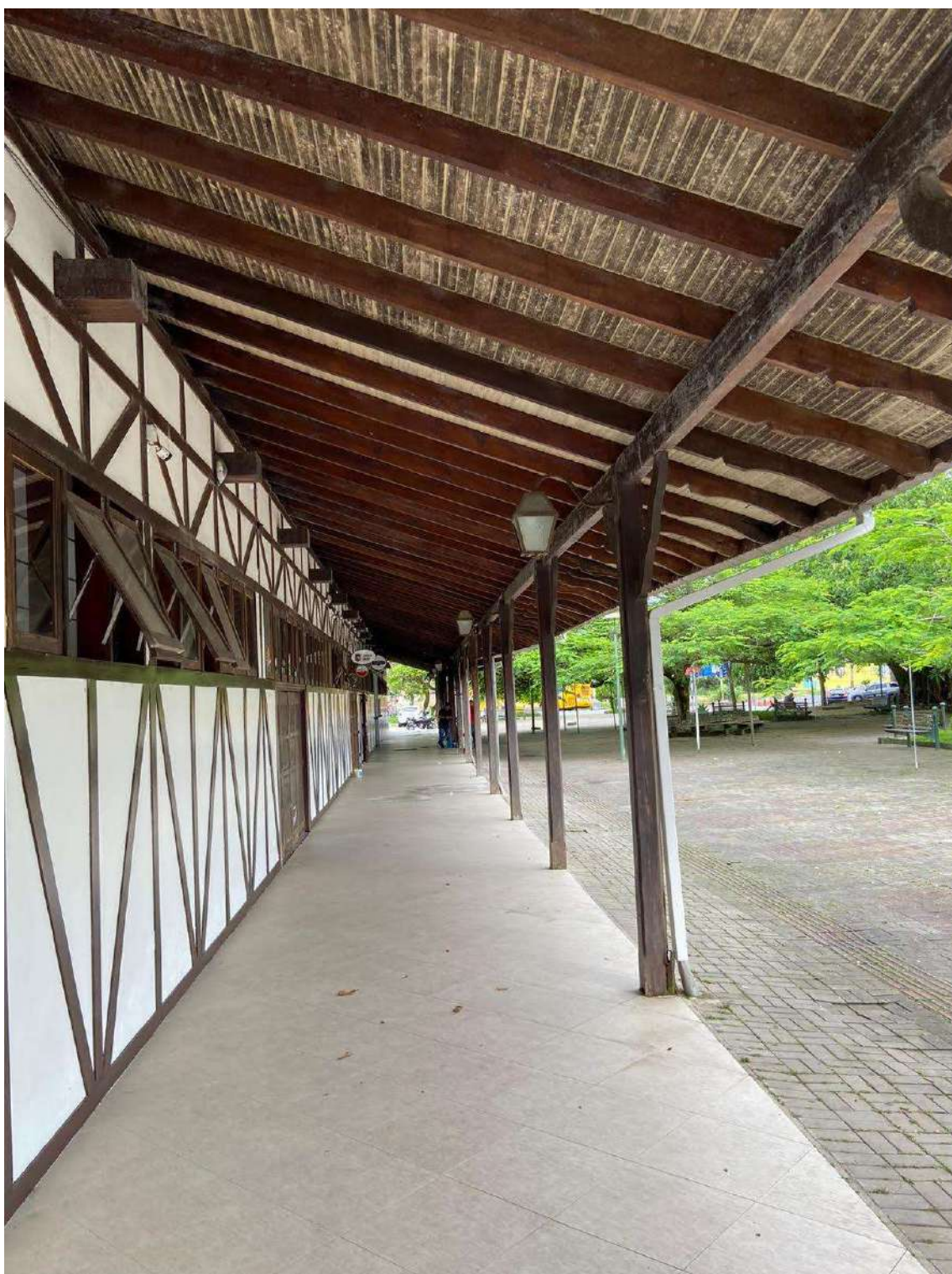
Figura 26: circulação externa (fachada lateral)