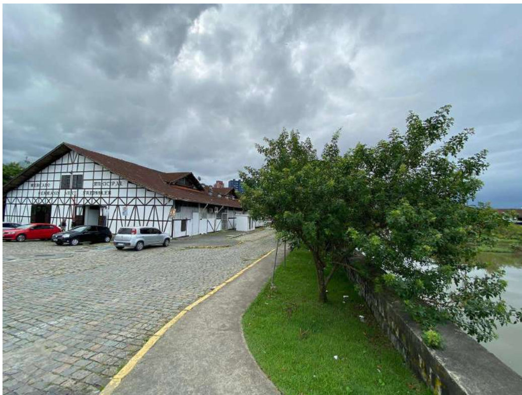
Figura 10: externo diagonal