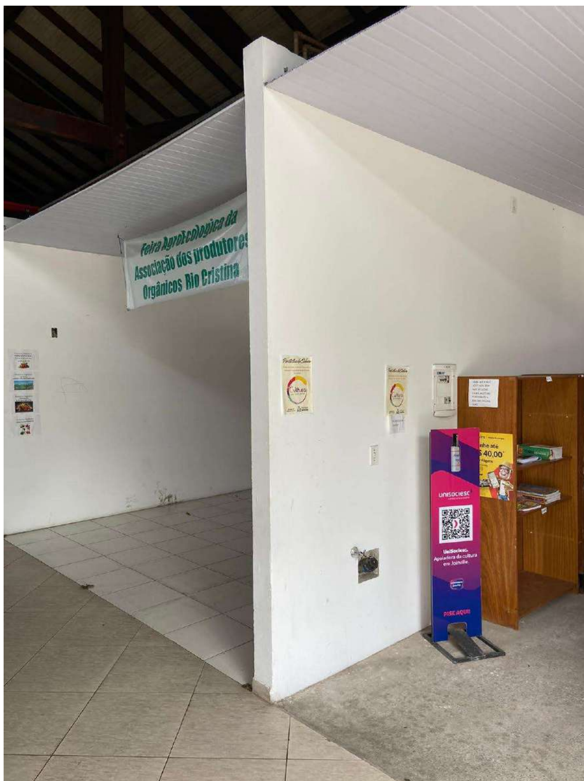
Figura 21: BOX