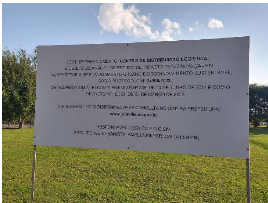
Foto 02 - Placa na Rua Tenente Antônio João