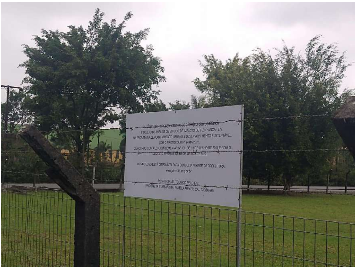
Foto 02 - Placa na Rua Tenente Antônio João