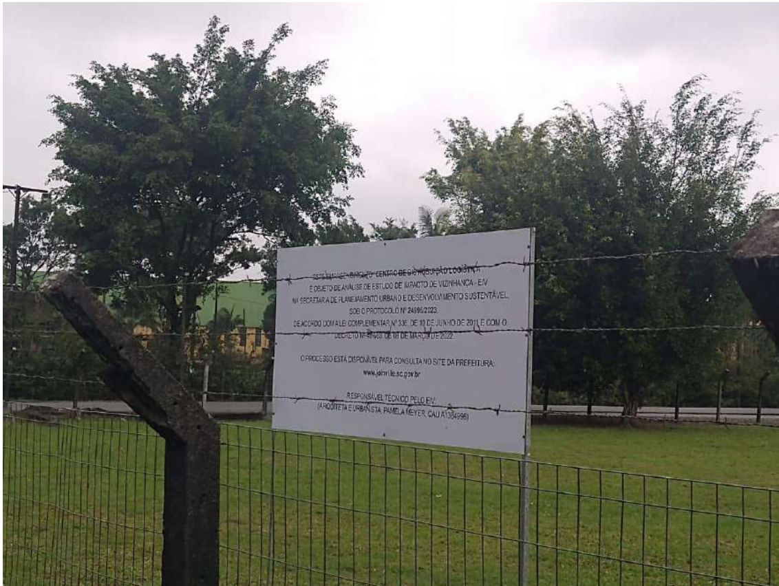
Foto 01 - Placa na Rua Tenente Antônio João