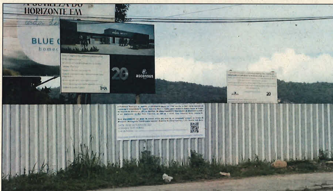
Localização da placa fixada na frente do imóvel na Rua Dona Francisca.