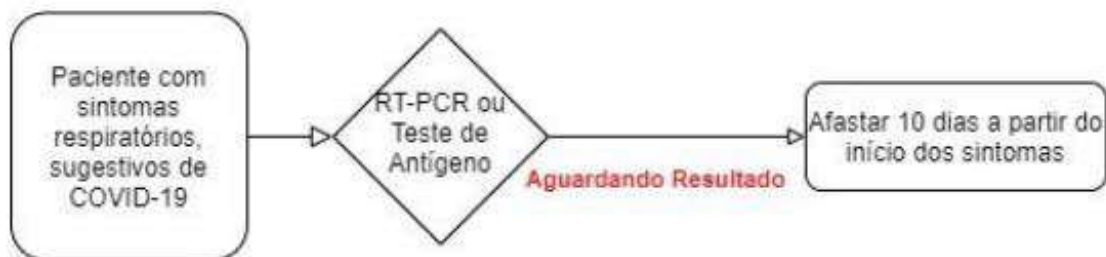
Fluxograma 1. SÍNDROME GRIPAL SUSPEITA PARA COVID 19