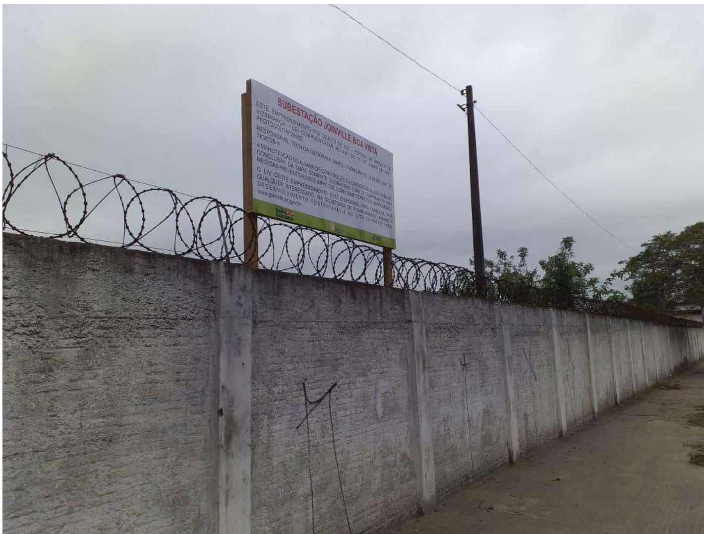
Figura 3: Vista da placa alocada na área lateral do imóvel.