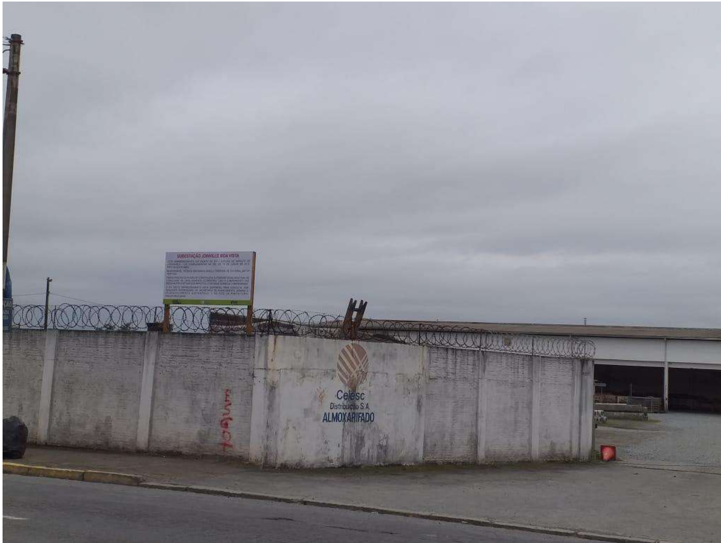
Figura 4: Vista da placa alocada na área frontal do imóvel.