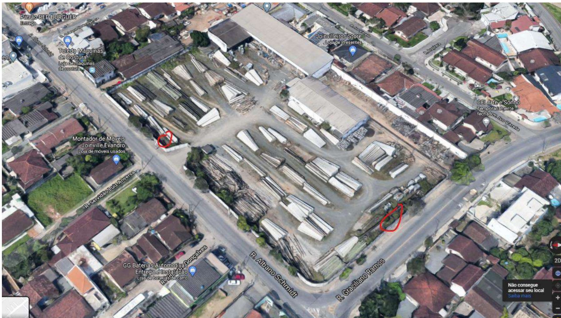
Figura 1: Localização dos locais de implantação das placas.