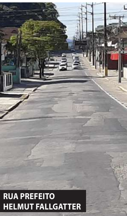
RUA PREFEITO HELMUT FALLGATTER

A Prefeitura de Joinville lançou o edital para a contratação de empresa para requalificação viária do eixo da rua Prefeito Helmut Fallgatter, no bairro Boa Vista. O investimento será de R$ 13,6 milhões. Para a execução da obra, o prazo será de 30 meses, contados a partir do recebimento da ordem de serviço. A ordem de serviço será expedida no prazo máximo de 60 dias contados a partir da data da assinatura do contrato.