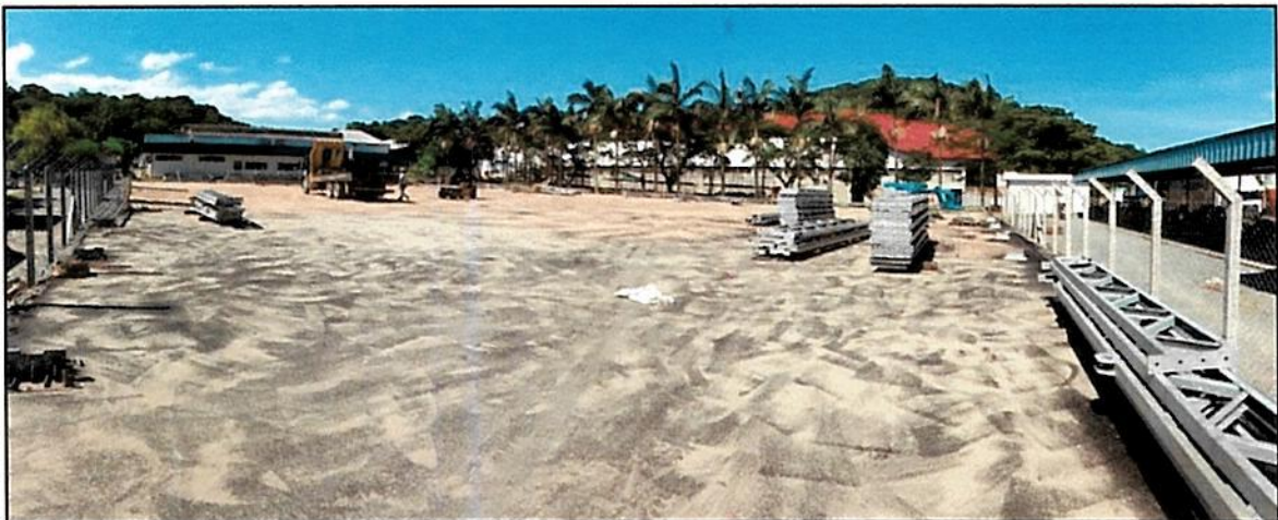
Figura 5 - Montagem dos pilares e montagem terças de fechamento – Data 18.02.2016