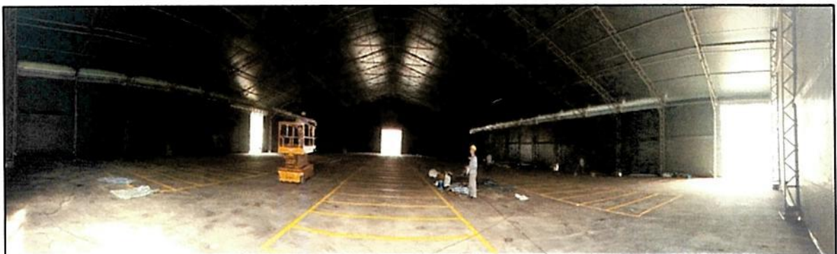
Figura 10 - Instalação de portas, finalizado os reparos na lona.