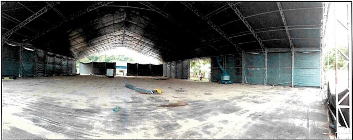
Figura 7 - Finalizado a montagem das lonas da cobertura e Iniciado a montagem das lonas da lateral – Data: 24.02/2016.