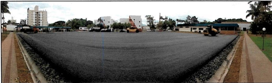
Figura 1 - Colocação da pavimentação asfáltica, Data:15.02.2016.

Para atendimento a condicionante 2.6 da Licença de Operação nº 230/15 elaboramos o seguinte relatório fotográfico da instalação do galpão lonado da unidade da Mexichem Brasil localizada à Rua Luiz Delfino, nº 870 Glória, município de Joinville/SC, inscrita sob o CNPJ 58.514.928/0020-37.