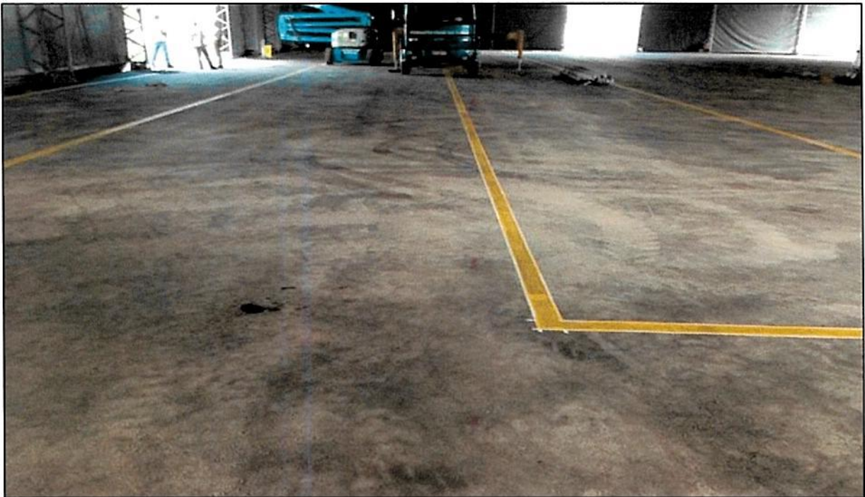
Figura 8 – Início da limpeza interna e realização de pintura/demarcação Data: 01.03.2016