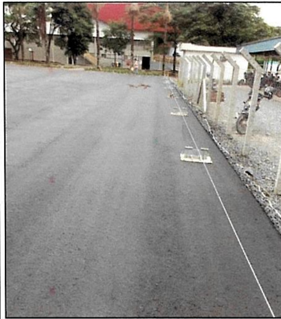
Figura 3 - Início da montagem do galpão lonado, Data: 17.02.2016.