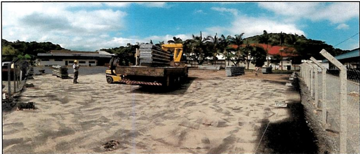
Figura 4 - Finalização da montagem das bases e transferência das estruturas - Data 17.02.2016