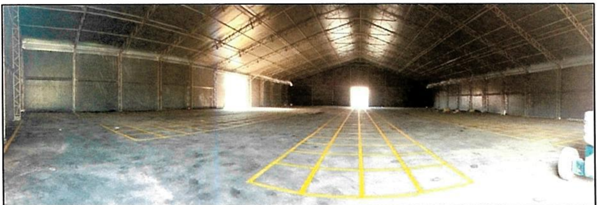
Figura 11 - Finalização das pinturas e demarcações