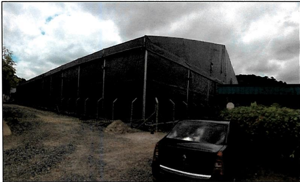
Figura 12 – Obra do galpão lonado concluída