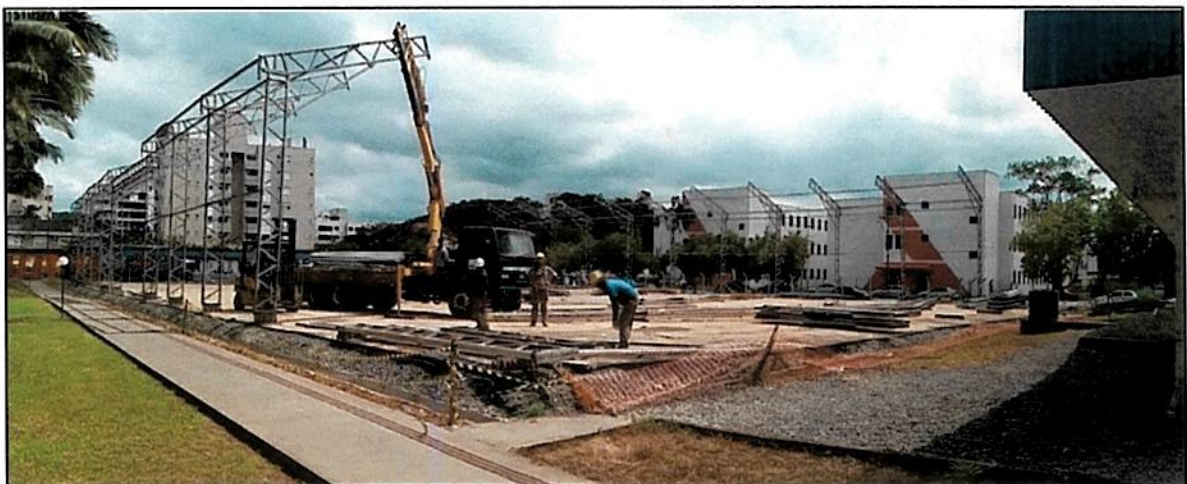
Figura 6 - Içamento dos pilares e travamento dos pilares – Data 19.02.2016