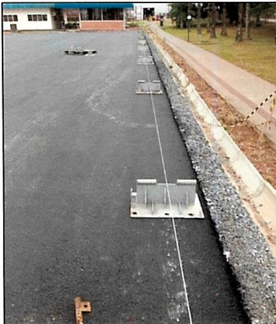
Figura 2 - Início da montagem do galpão lonado, Data: 17.02.2016.