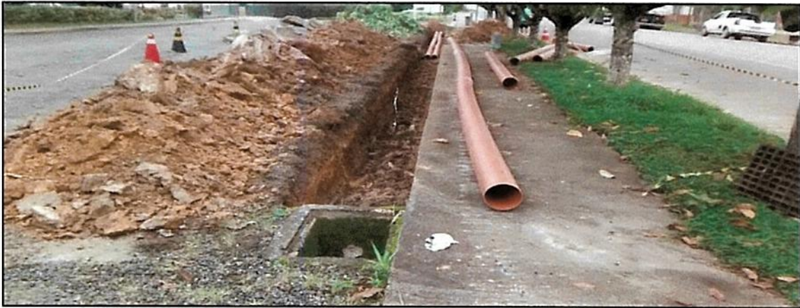
Figura 9 - Melhorias realizadas na rede de drenagem