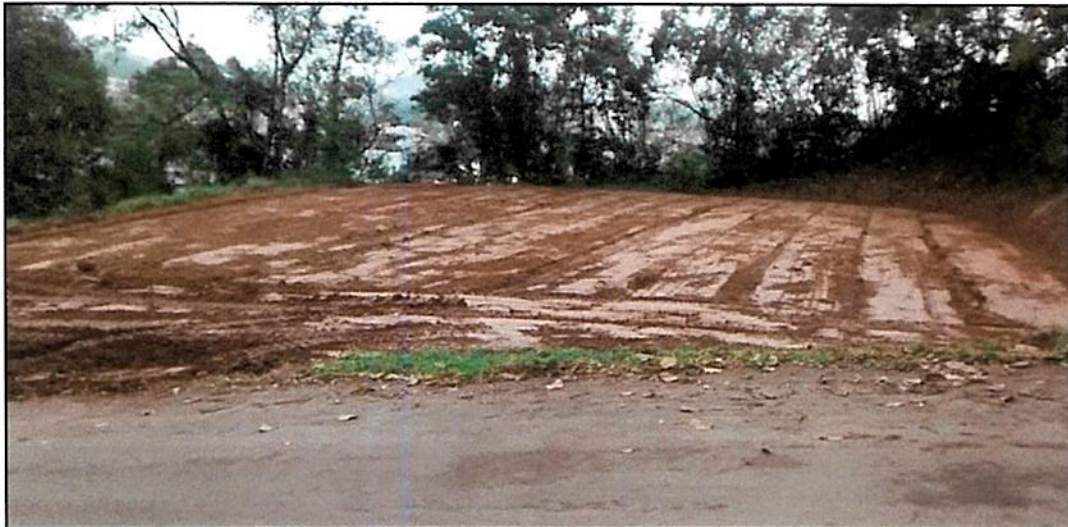
Figura 1 - Limpeza e nivelamento do terreno Pátio A