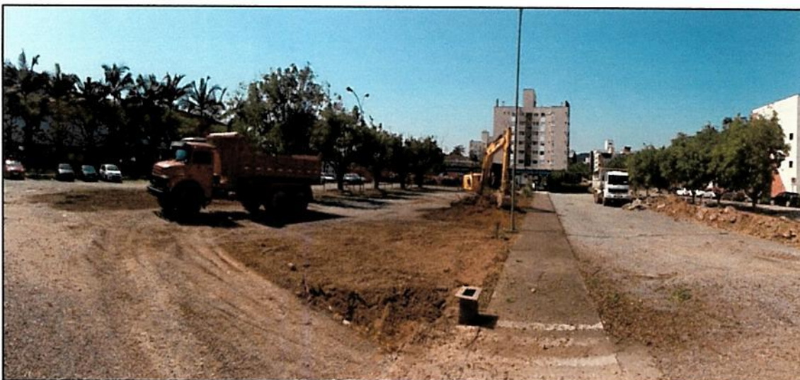
Figura 8 - Melhorias realizadas na rede de drenagem