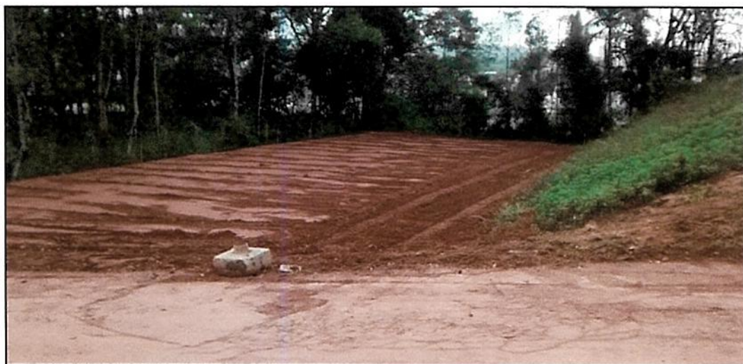
Figura 2 - Limpeza e nivelamento do terreno Pátio B