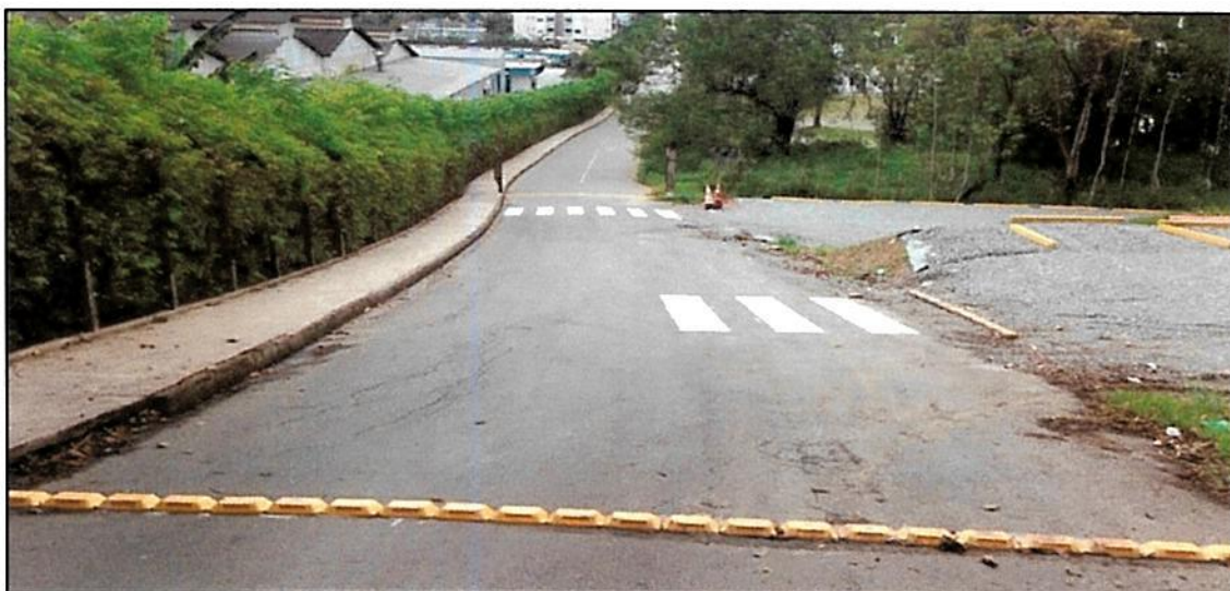
Figura 6 - Instalação dos batentes e tachões