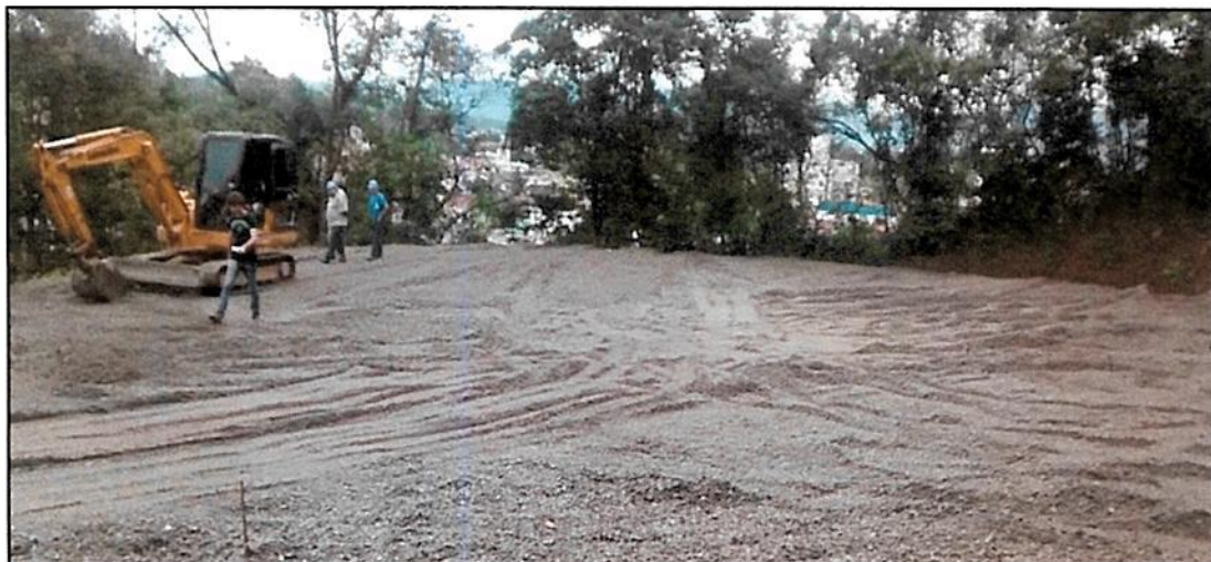
Figura 4 - Ensaibramento