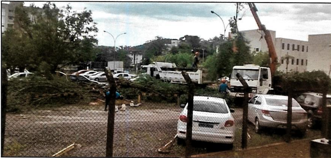
Figura 7 - Retirada da vegetação existente licenciada pela Autorização do Corte SV nº 0258/2015.