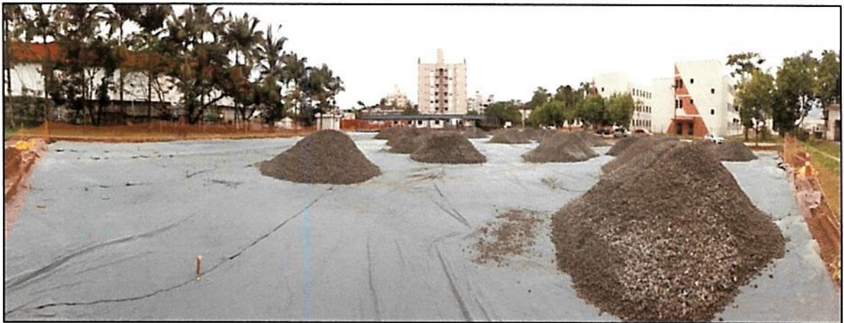
Figura 10 - Instalação de manta Bidim e ensaibramento