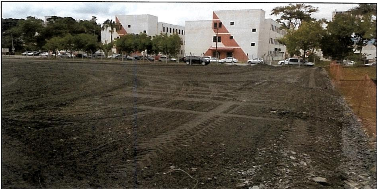
Figura 13 - Vista do ensaibramento finalizado

Devido às chuvas intensas que ocorrem nos últimos meses na cidade de Joinville não foi possível concluir a base asfáltica para instalação do galpão lonado. A finalização desta obra esta prevista para o dia 12/02/2016. Assim que finalizado estaremos encaminhado novo relatório fotográfico.