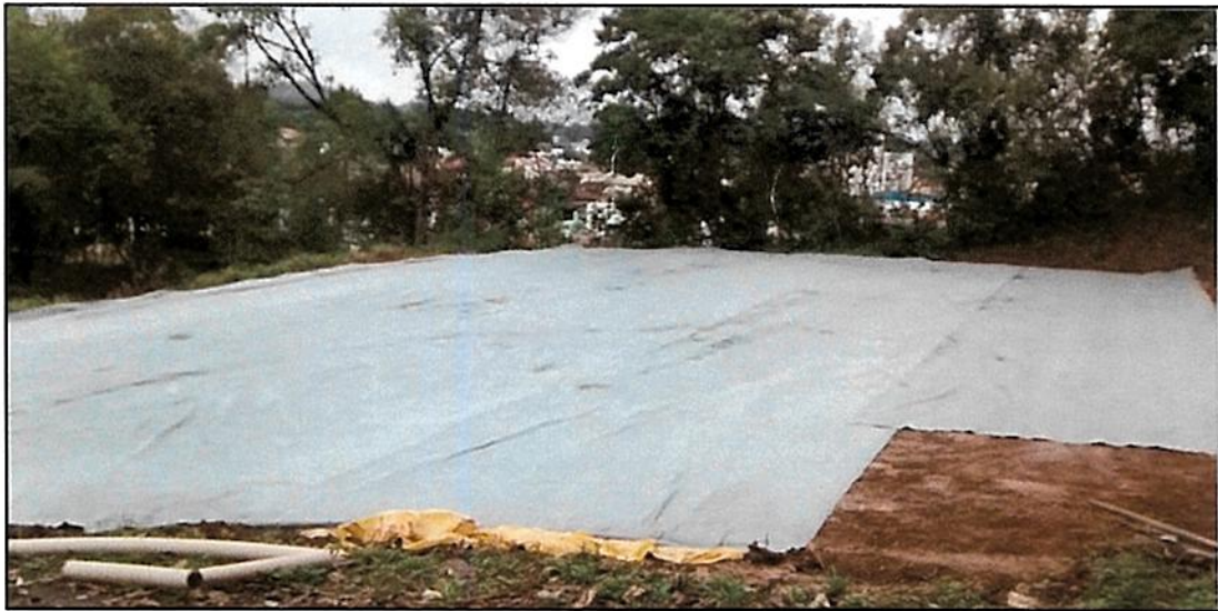
Figura 3 - Instalação da manta Bidim