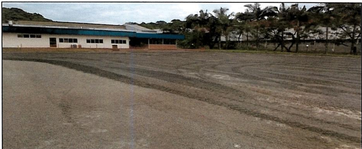
Figura 11 – Vista do ensaibramento finalizado