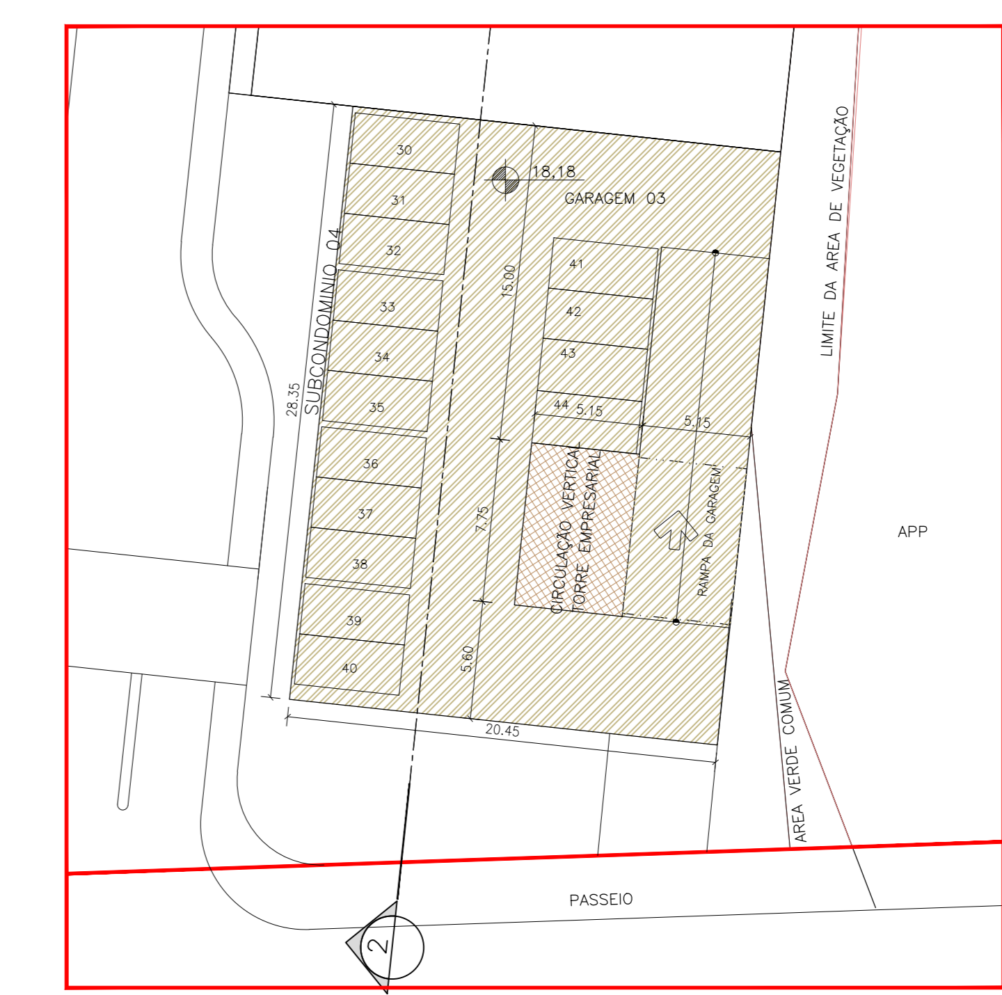
03 ETAPA 04 - GARAGEM 03 ESCALA: 1/250