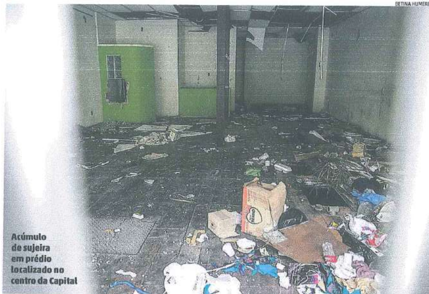
Acúmulo de sujeira em prédio localizado no centro da Capital