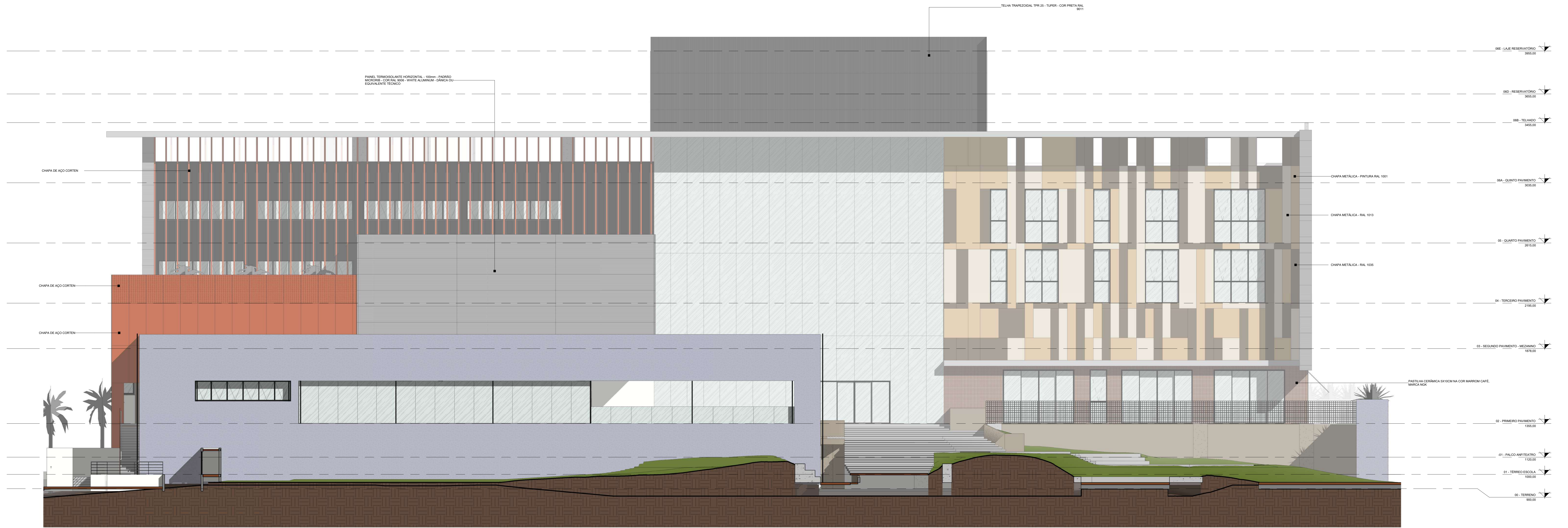
1 ELEVÇÃO NORDESTE Escala 1 : 100