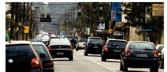
Implantação de mão única nas Ruas Timbó e Max Colin.