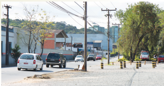
Construção de duas galerias.