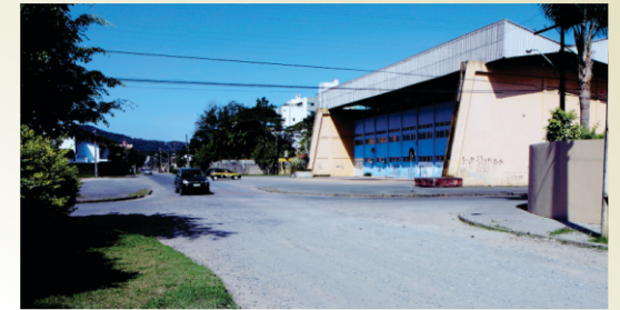
Pavimentação da Rua Timbó, trecho entre as Ruas Blumenau e Campos Salles.

Cada etapa da obra terá um plano de circulação com vias alternativas. Informe-se no site da prefeitura. Clique na marca do Projeto Viva Cidade BID: www.joinville.sc.gov.br