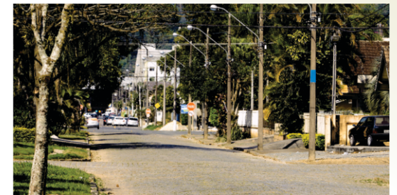
Arborização e sinalização da Rua Timbó.