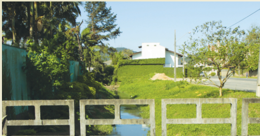
Desassoreamento e alargamento da calha do Rio Morro Alto.

Obras deste porte trazem barulho de máquinas, caminhões, poeira e lama causando incômodo aos moradores. Mas, tenha paciência. Ao final, o benefício chegará a você e à cidade inteira.