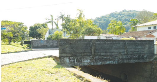
Reconstrução de cinco pontes.