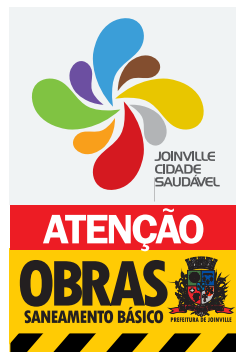
Placas de Sinalização