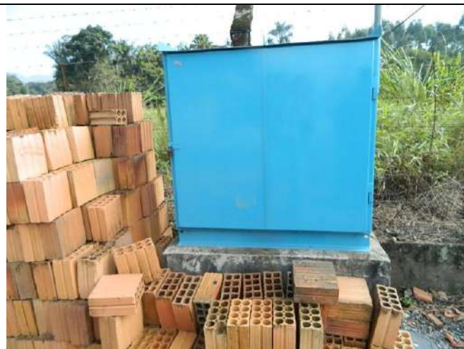
Foto 64 – Booster Mildau