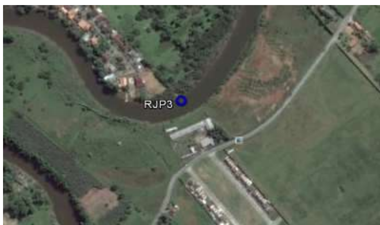
Figura 1 - Localização do ponto de amostragem

Data da coleta: 03/04/2017 Hora da coleta: 09h:05min