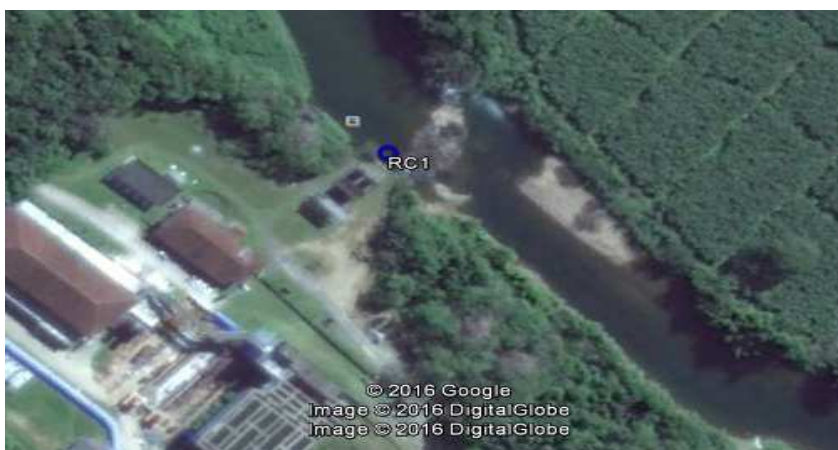
Figura 1 – Localização do ponto de amostragem

Data da coleta: 19/04/2017 Hora da coleta: 11h:41min