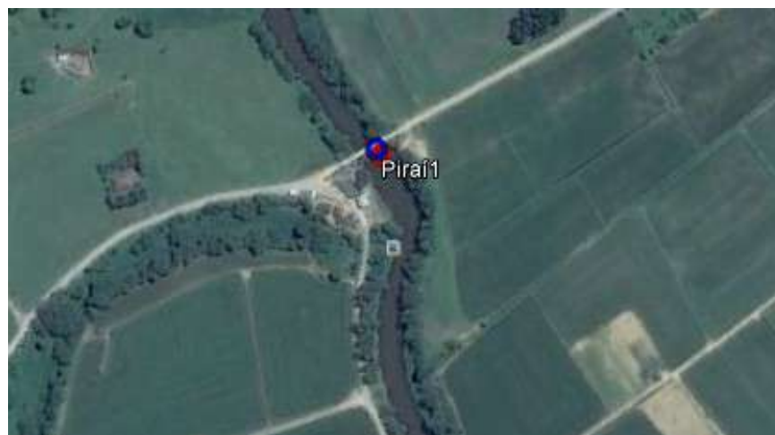
Figura 1 – Localização do ponto de amostragem

Coordenadas em UTM: 715443.00 m (E) - 7073813.00 m (S)