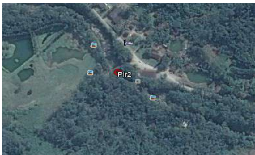
Figura 1 – Localização do ponto de amostragem

Coordenadas em UTM: 706298.00 m (E) - 7109031.00 m (S)