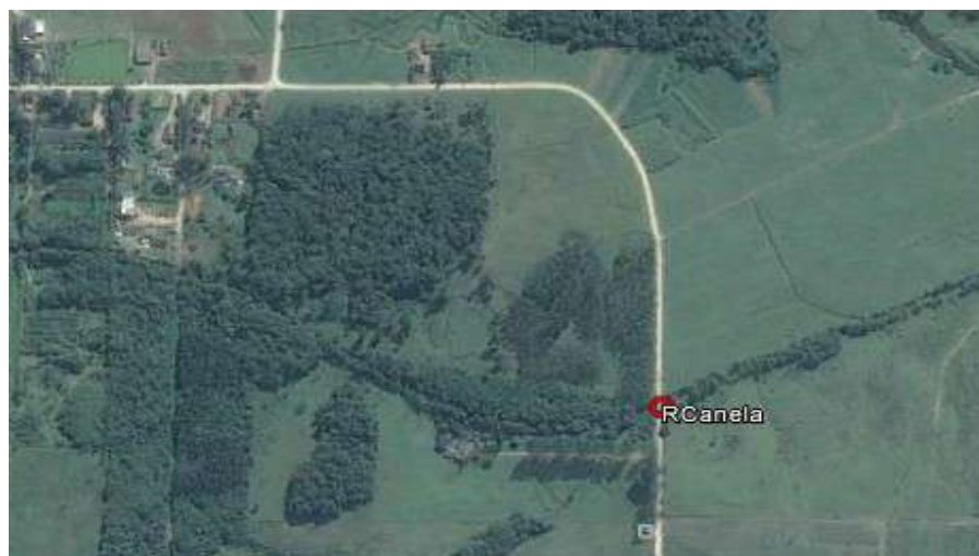
Figura 1 - Localização do ponto de amostragem

Coordenadas em UTM: 712437.00 m (E) - 7103399.00 m (S)