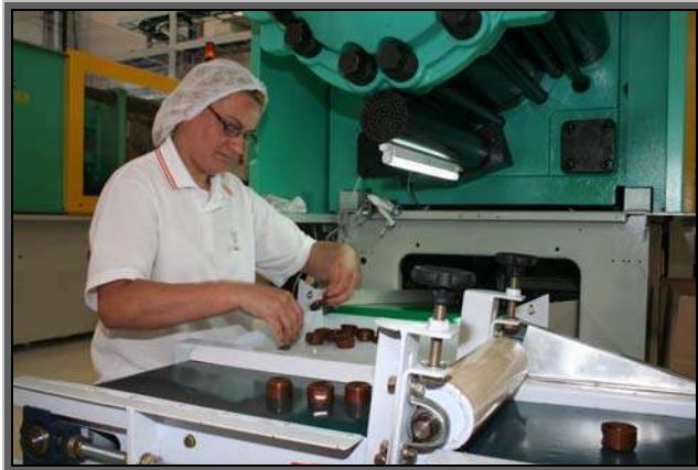
Figura 07 – Indústria de bens de consumo – Zona Industrial Norte