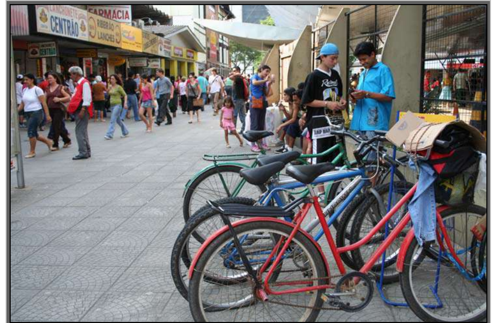
Figura 06 – Acesso ao terminal de ônibus urbano – Centro