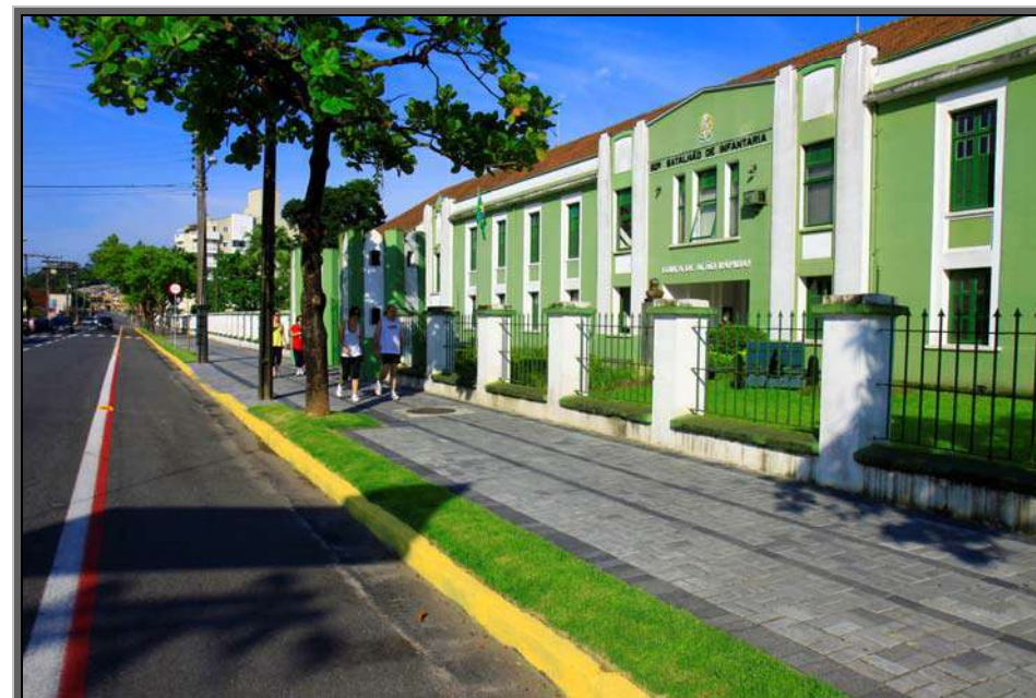
Figura 14 – Rua Ottokar Doerfel – 62º Batalhão de Infantaria