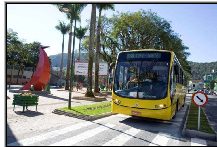
Figura 16 - Transporte coletivo – Centro