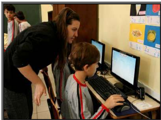
Figura 17 – Escola Municipal Hermann Muller