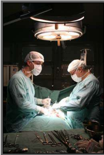
Figura 19 – Hospital São José