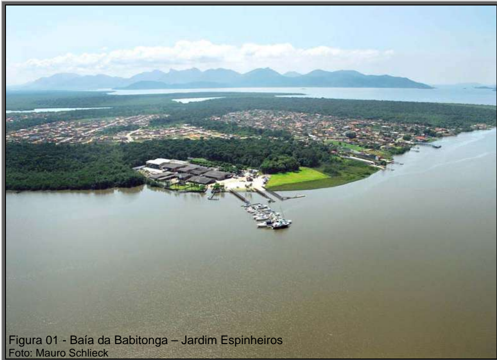
Figura 01 - Baía da Babitonga – Jardim Espinheiros

O conhecimento das características naturais de um determinado recorte espacial é importante para identificar suas potencialidades econômicas e fragilidades ambientais, para que o desenvolvimento socioeconômico ocorra com base no uso racional destes recursos. Nesse sentido, serão apresentadas de forma sucinta as características físicas naturais de Joinville como localização, relevo, geologia, hidrografia, clima e vegetação.