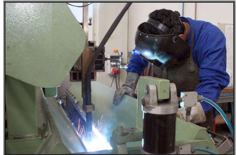
Figura 10 – Indústria Metal-mecânica – Zona Industrial Norte