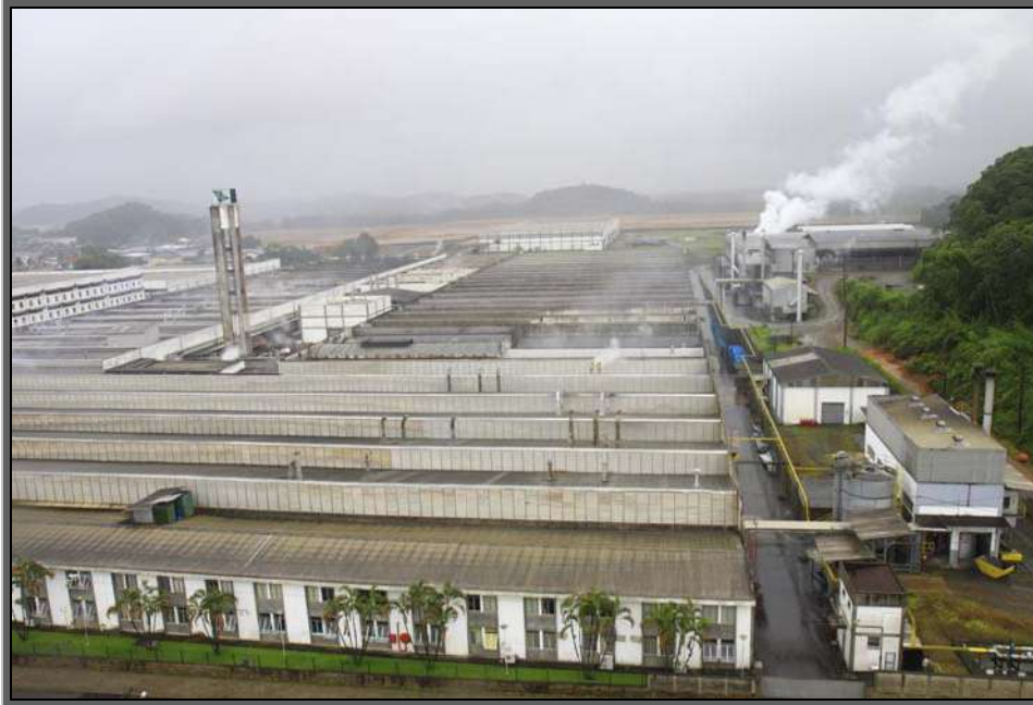
Figura 09 – Zona Industrial Norte