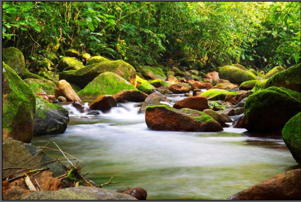
Figura 05 – Rio Pirai - Área rural

Dentre os ecossistemas que ocorrem na região destacam-se a Floresta Atlântica e os Manguezais. São biomas importantes, especialmente pela biodiversidade, embasada em critérios geológicos, climáticos e hidrográficos.