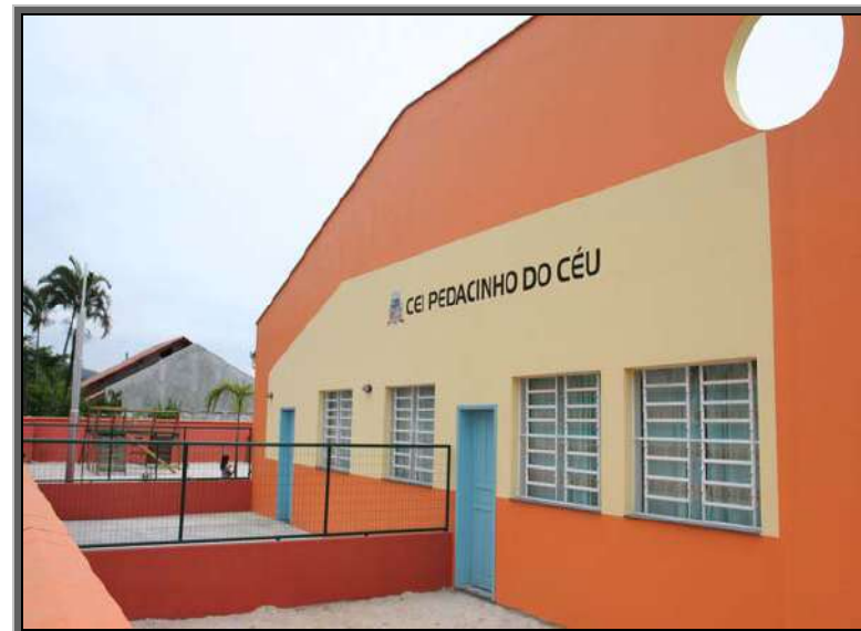
Figura 18 – CEI Pedacinho do Céu