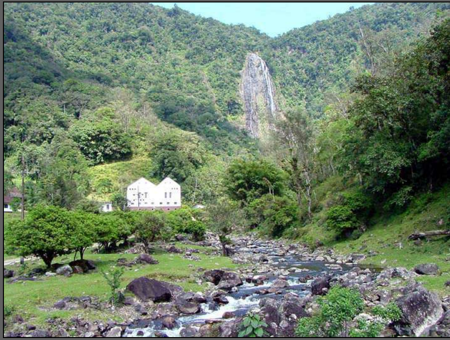
Figura 03 - Área rural – Pirai