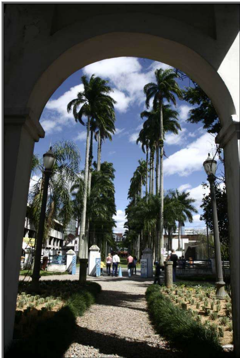
Figura 13 – Museu do Imigrante e Rua das Palmeiras