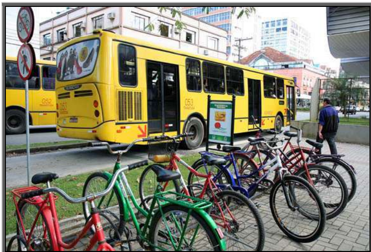
Figura 15 – Transporte coletivo – Centro