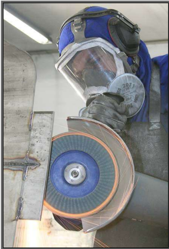
Figura 08 - Zona Industrial Norte