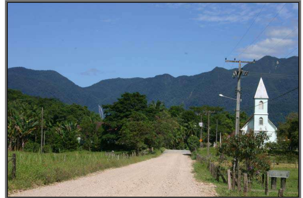
Figura 12 – Turismo Rural Pirai