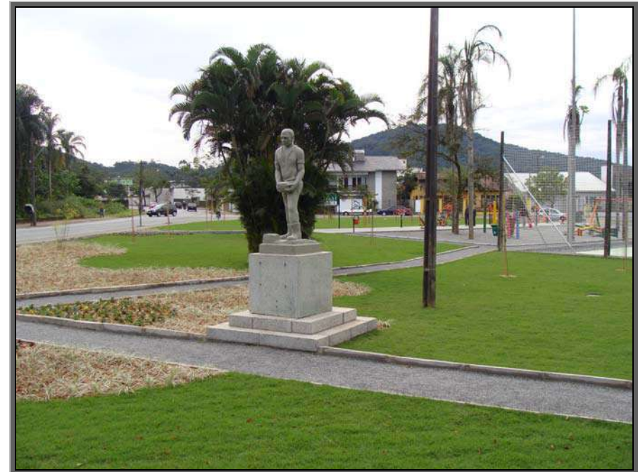
Figura 20 – Praça Mario Metz/Calceteiro – Bairro Boa Vista