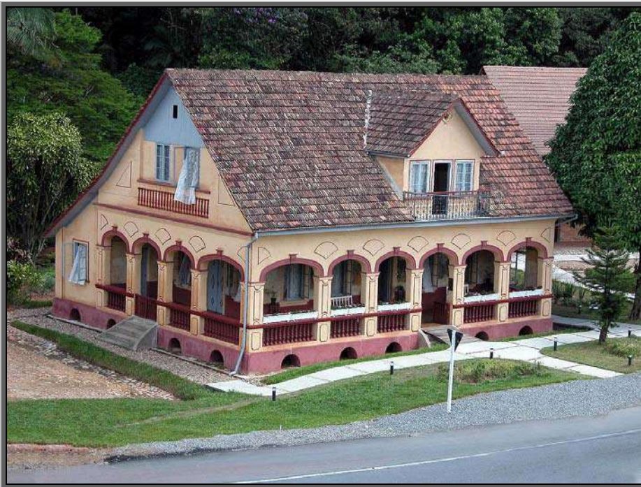
Figura 11 – Casa Krüger – Pirabeiraba