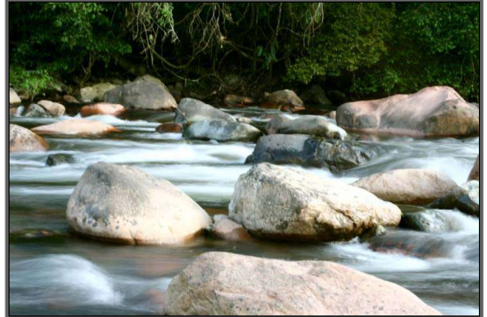
Figura 04 – Rio Cubatão – Área rural