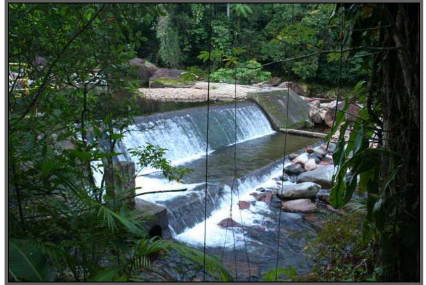
Figura 21 – ETA Pirai