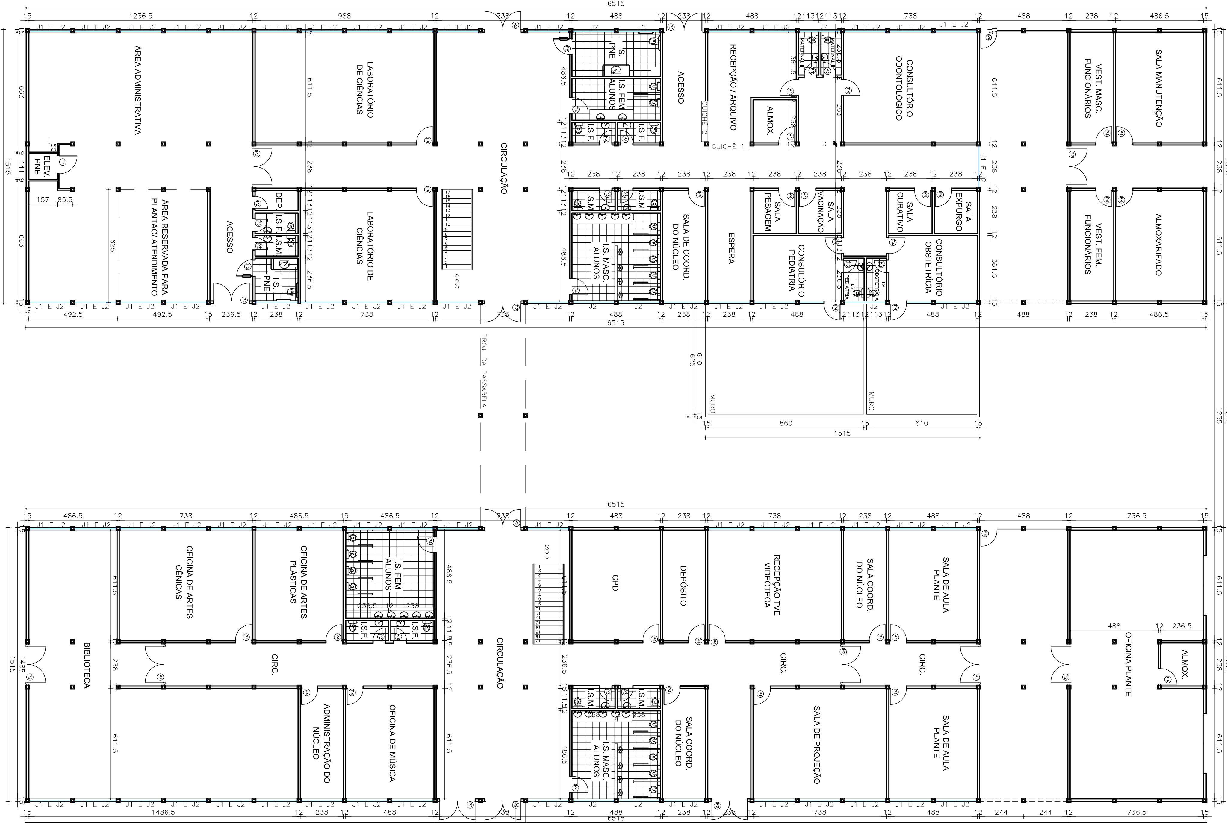
PLANTA BAIXA - PAVTO. TÉRREO