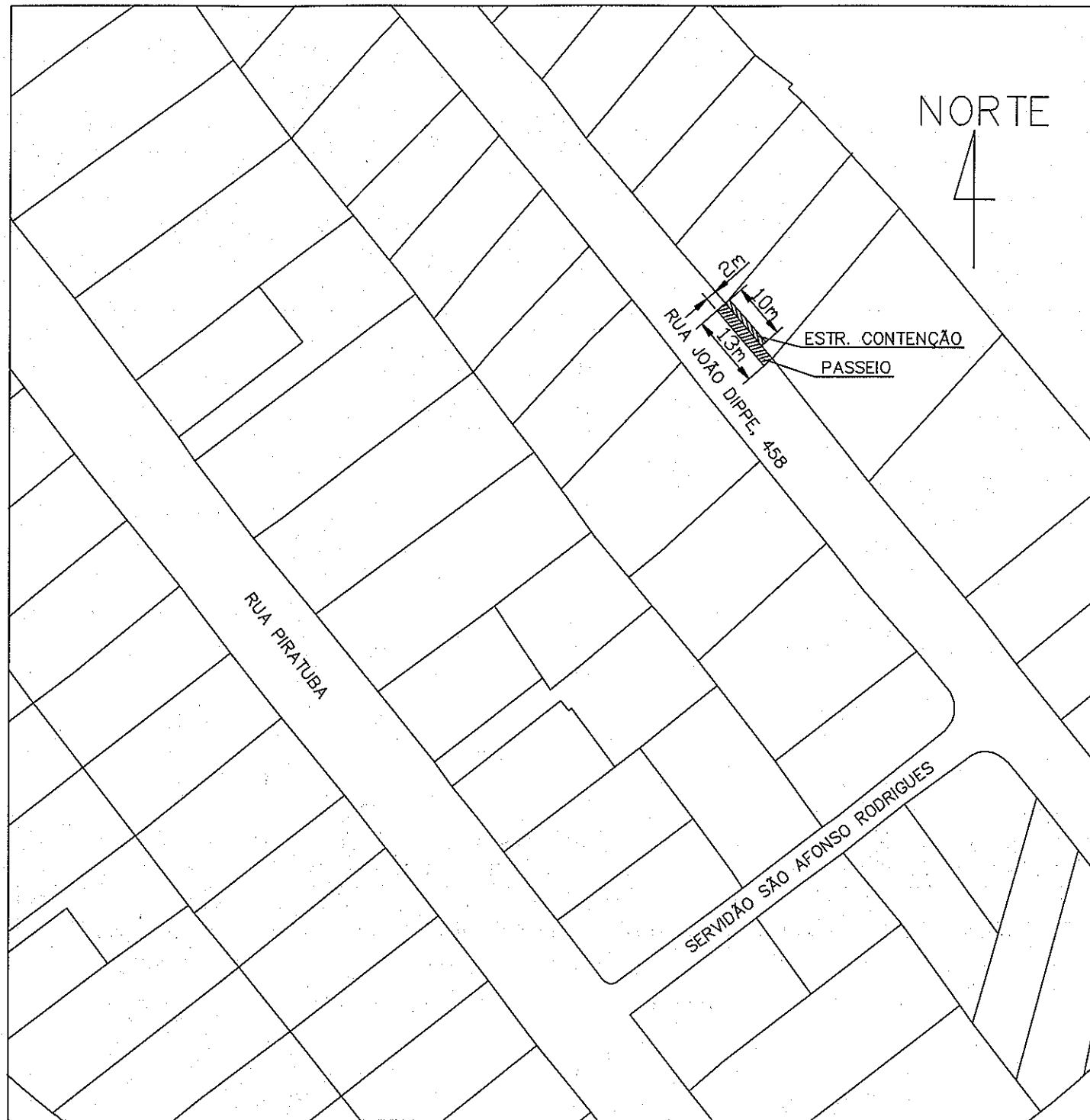
SITUAÇÃO/LOCALIZAÇÃO ESCALA: 1:1000