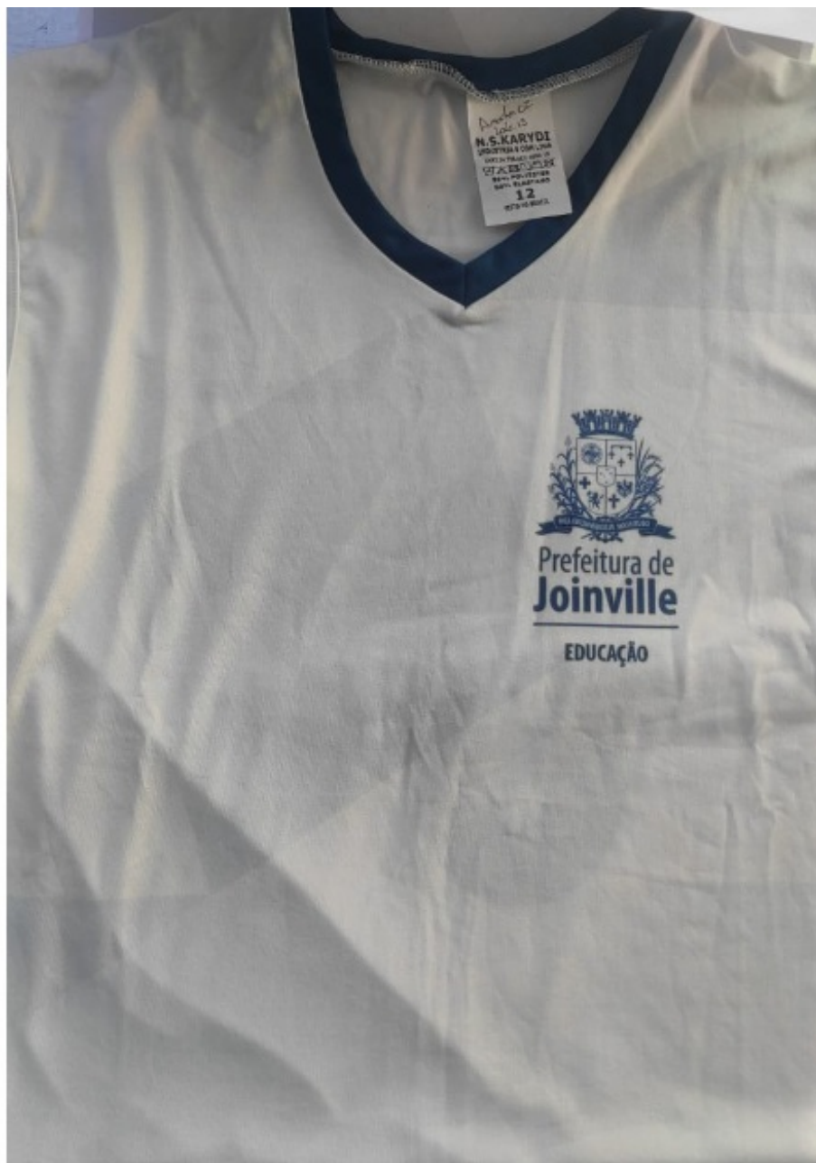
Figura 2: Imagens amostras