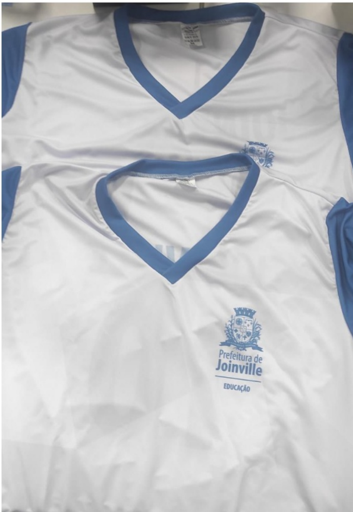
Figura 1: Amostra 1 e 2 lote 10