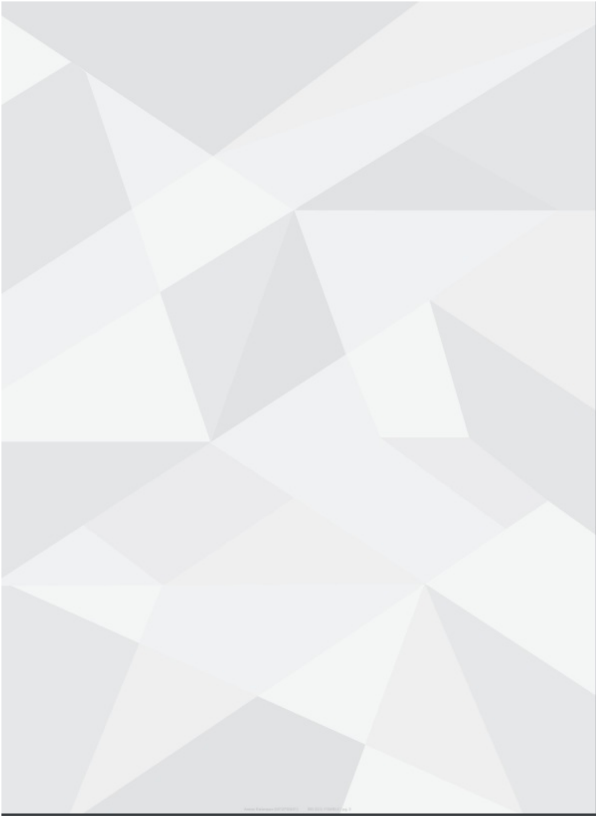
Figura 1: Anexo IX - Estampas