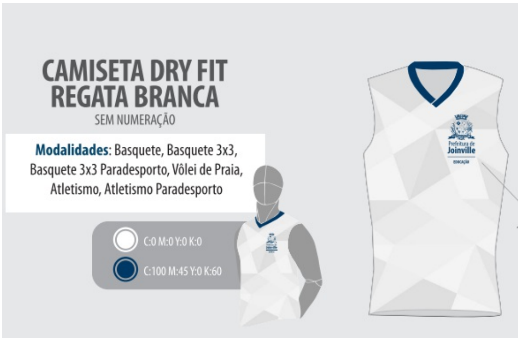
Figura 1: Layout Anexo VIII