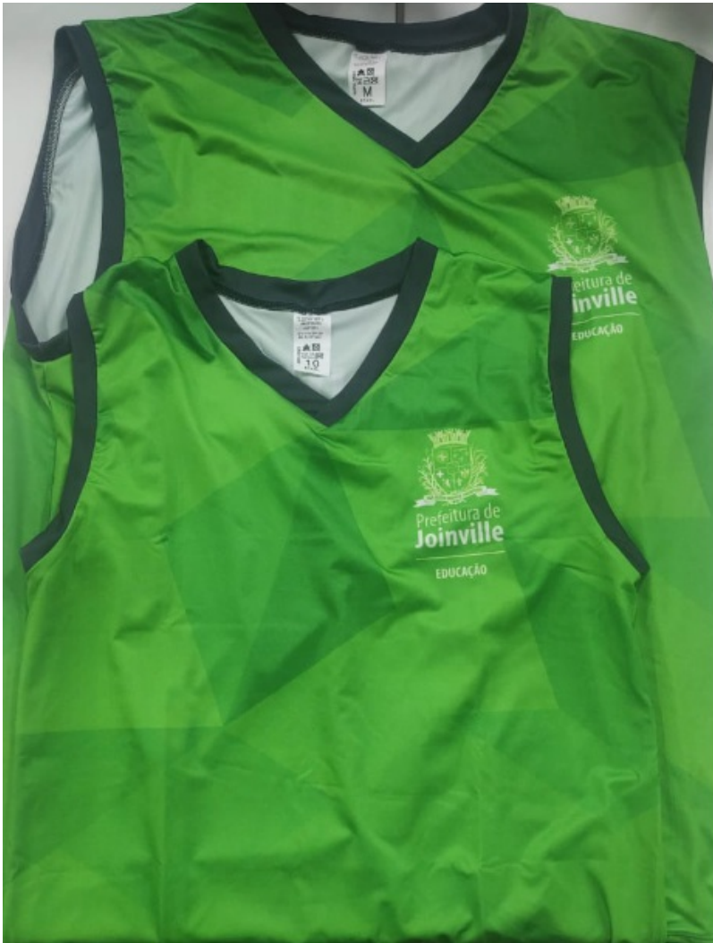
Figura 4: Foto amostras 1 e 2