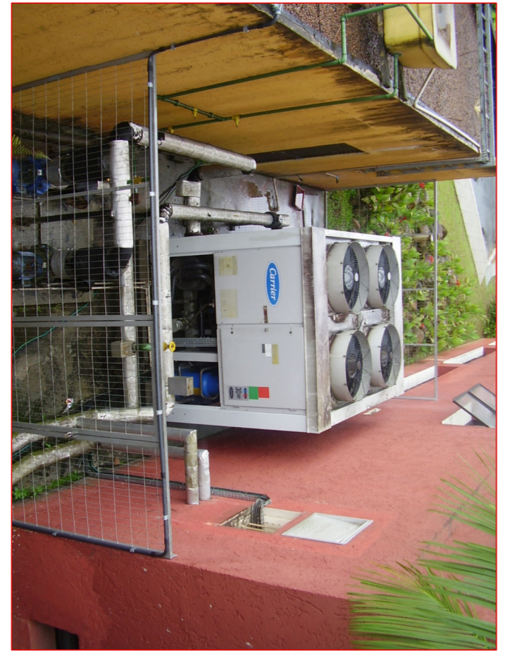
CENTRAL TÉRMICA EXISTENTE A SER REMOVIDA ESCALA