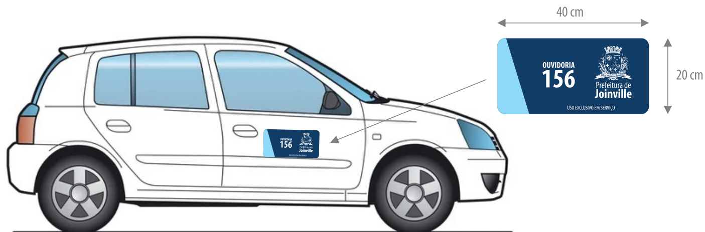
Veículos de pequeno ou médio porte (hatchback, sedan ou utilitário)