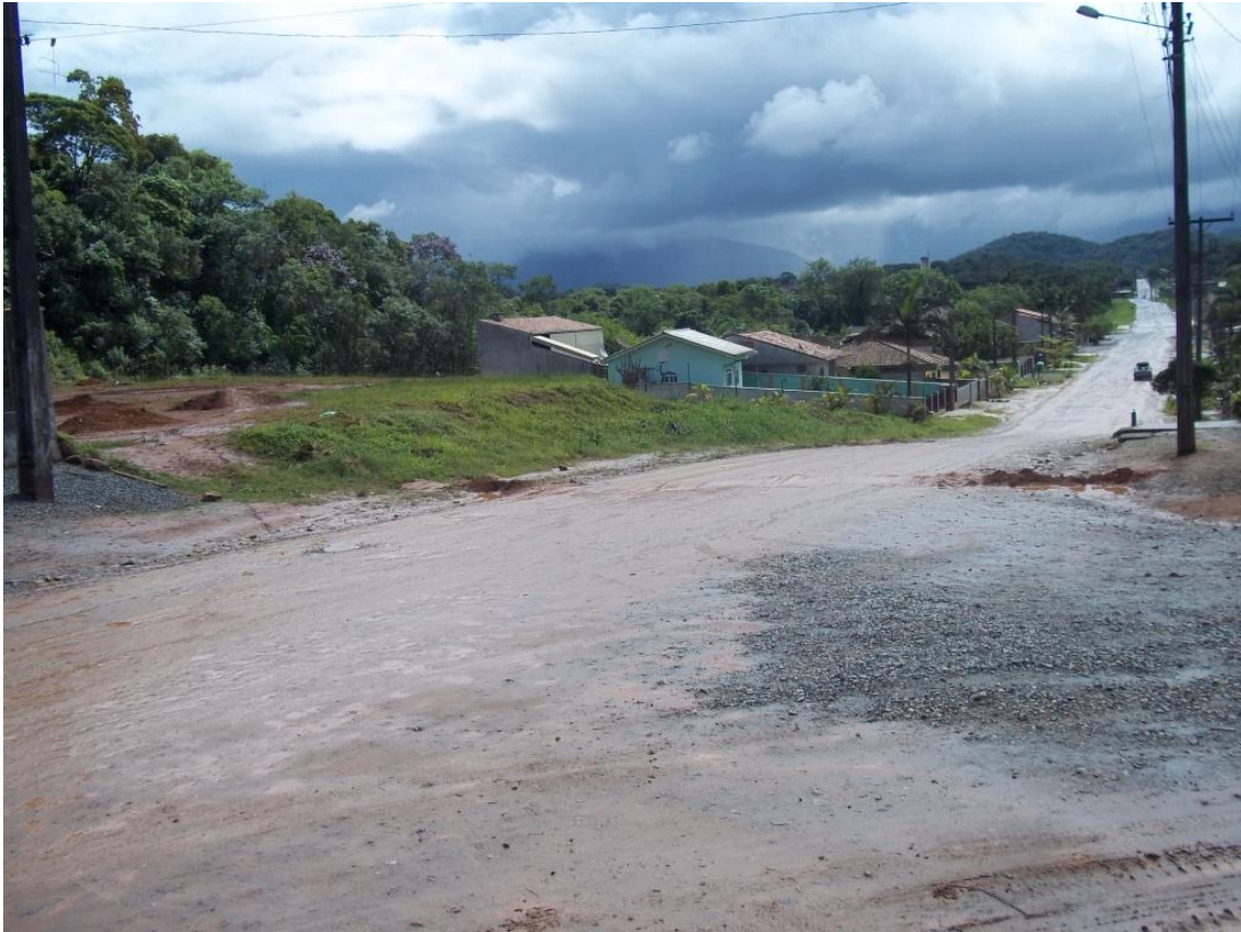
Foto do terreno 03 - vista frontal do terreno e rua