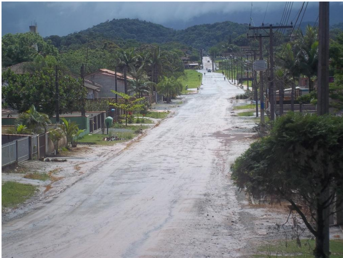
Foto do terreno 05 - vista da rua de acesso