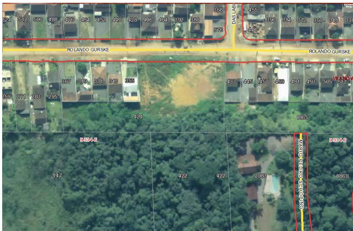
Foto do terreno 01 - vista geral do terreno e entorno