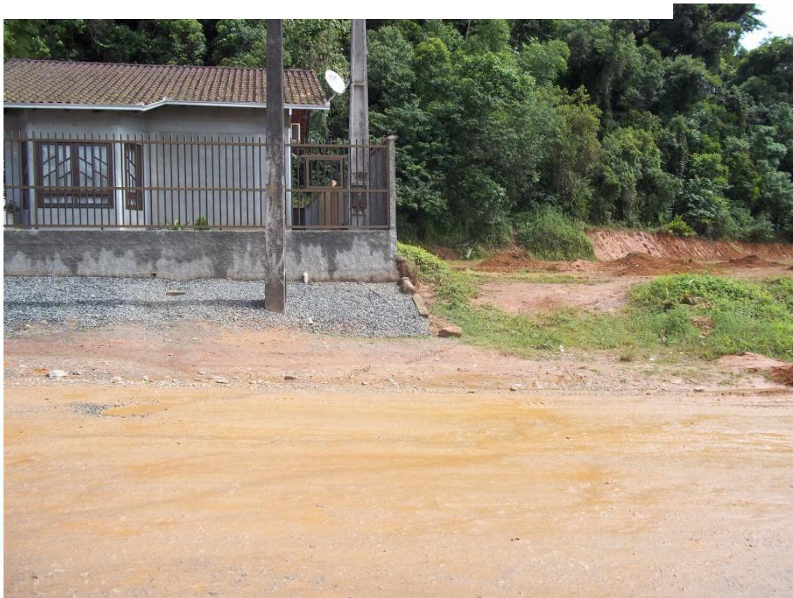
Foto do terreno 02 - vista frontal do terreno e casa vizinha