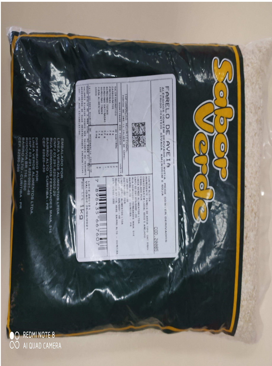
Foto 1 - Identificação do peso da amostra entregue para os itens 3 e 4