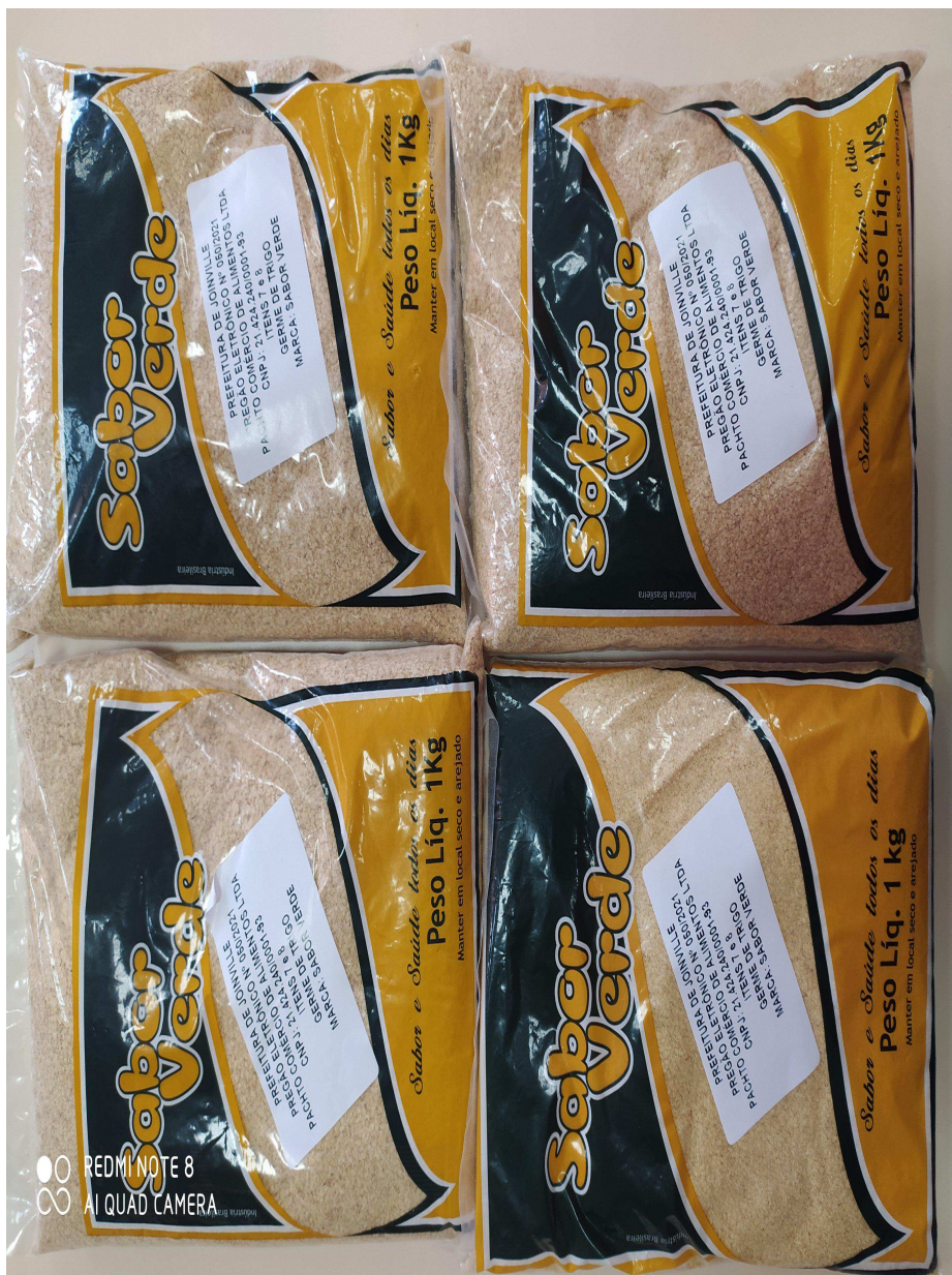
Foto 2 - Identificação do peso das amostras entregues para os itens 7 e 8