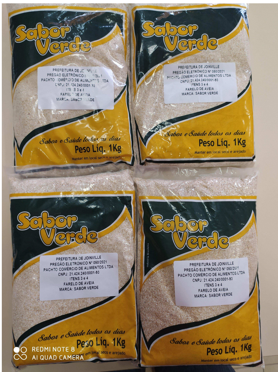
Foto 2 - Identificação do peso das amostras entregues para os itens 3 e 4