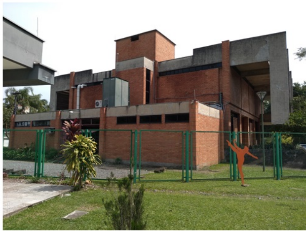
Imagem 03: Edificação construída para receber o acervo do Arquivo Histórico de Joinville. Vista dos fundos a partir do terreno da Casa da Cultura. (Data: Setembro/2018)