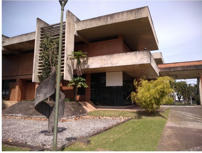
Imagem 02: Edificação construída para receber o acervo do AHJ. Vista lateral esquerda. (Data: Setembro/2018)