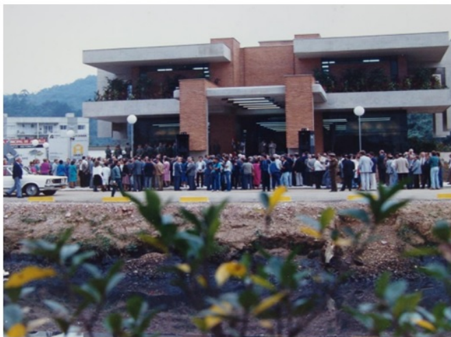
Imagem 01: Inauguração do atual prédio do AHJ em 18/07/1986