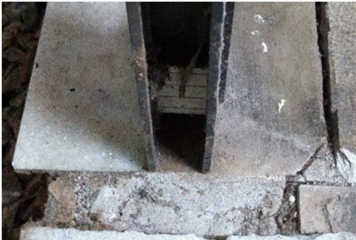
Imagem 07 Detalhe da soleira original da sala que teve sua alvenaria de fechamento demolida pela ação do vento.