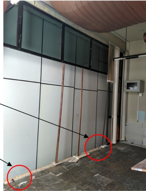
Imagem 09 – Área interna onde ocorreu o desabamento da parede e o consequente arrancamento da instalação elétrica.