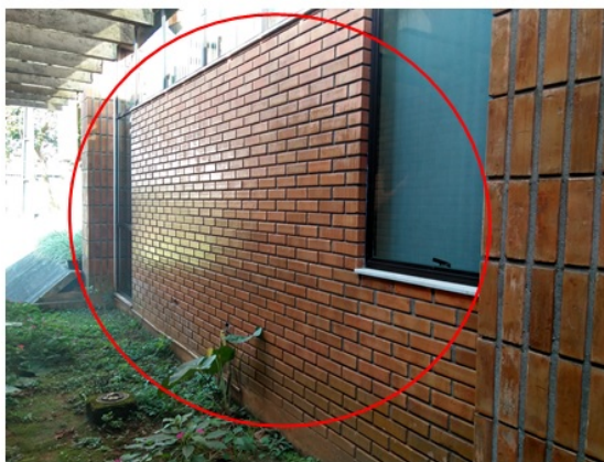
Imagem 04 e 05: Vista parcial da parede em alvenaria a ser demolida (Data: Setembro/2018)