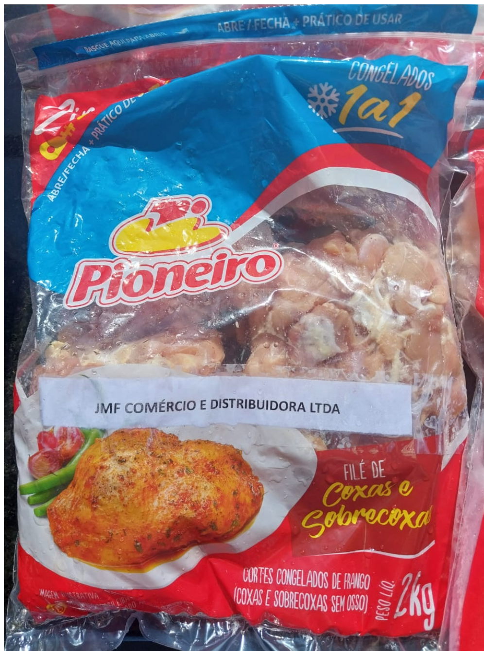
Imagem 3- Foto dos produtos/embalagens das 2 amostras analisadas.