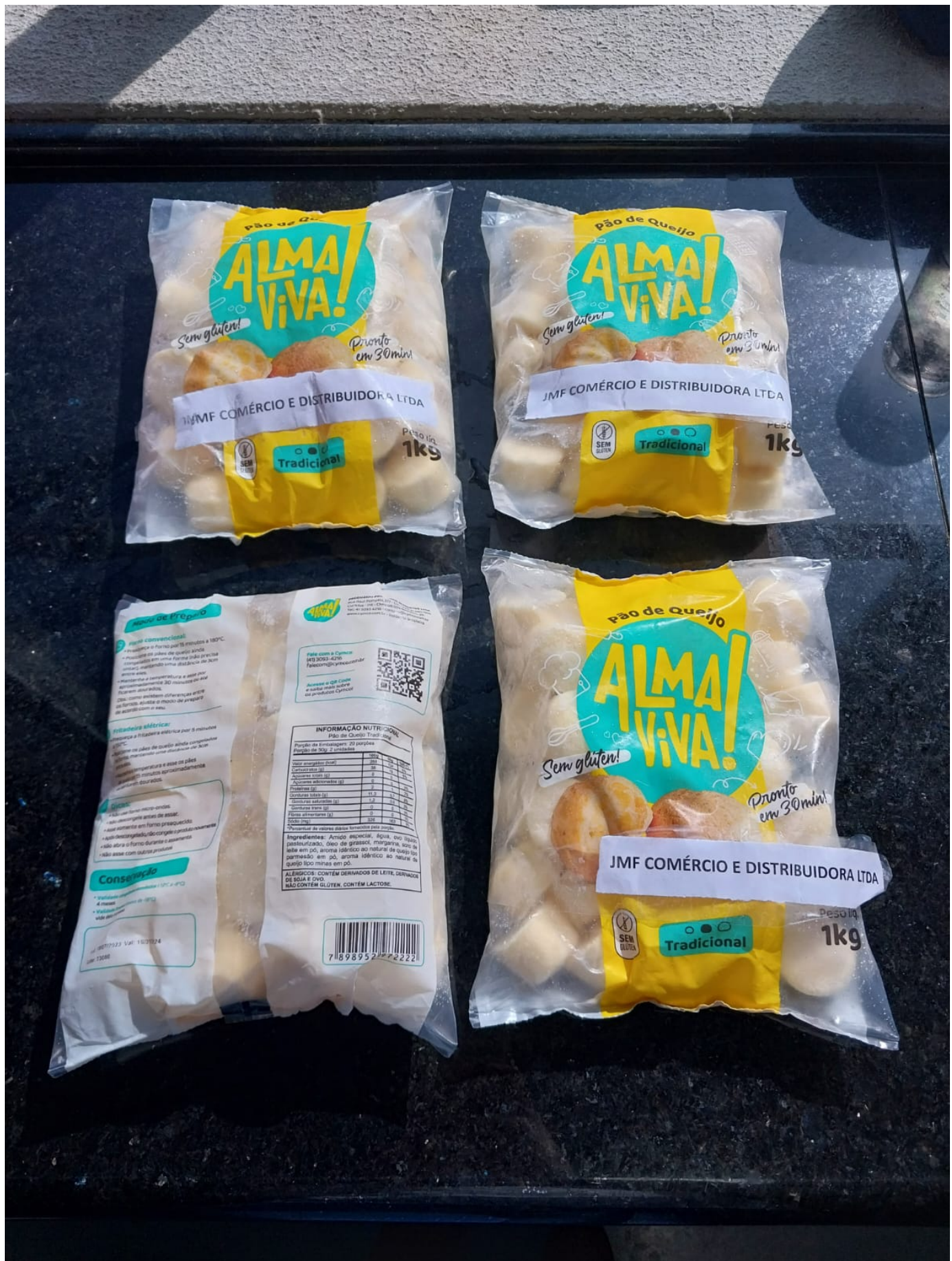
Imagem 3- foto do verso da embalagem.