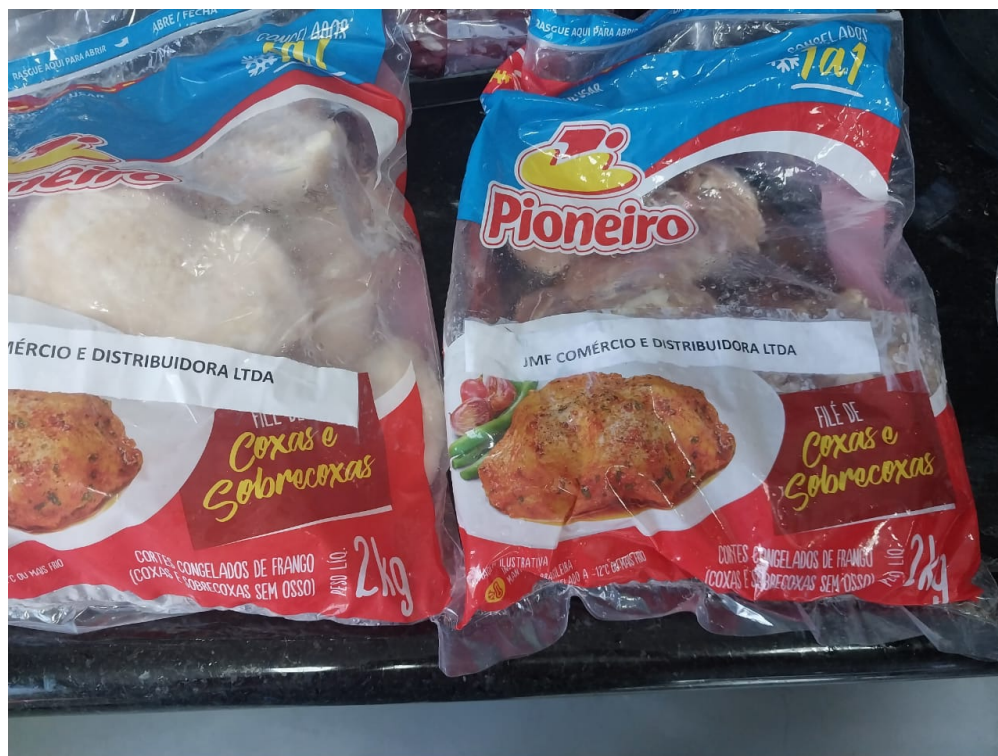
Imagem 4- foto do peso da amostra 1