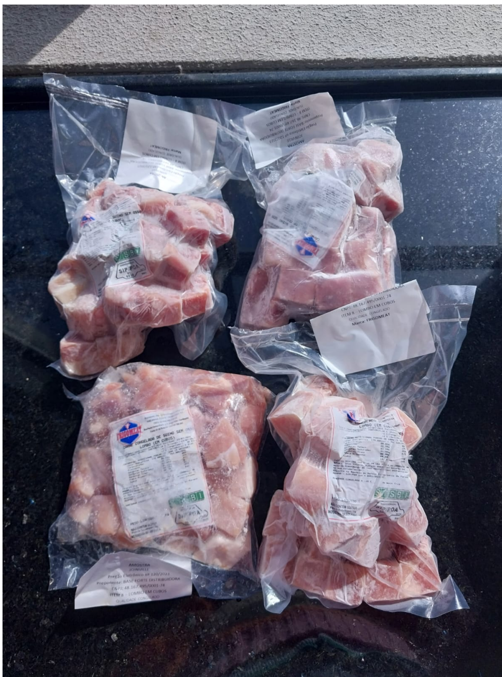
Imagem 2- foto da primeira amostra analisada- Peso do produto congelado com embalagem: 1,052 Kg

Imagem 1- foto das 4 amostras entregues pelo proponente.