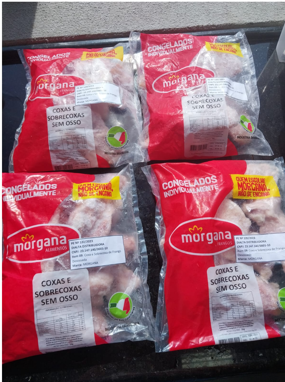
Imagem 2- foto das quatro amostras e verso da embalagem