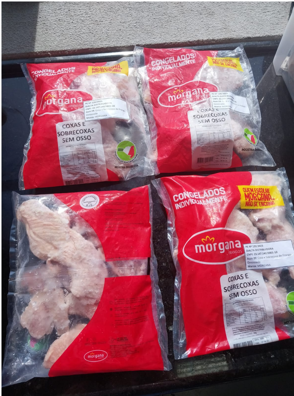
Imagem 3- foto da embalagem descrição do produto.