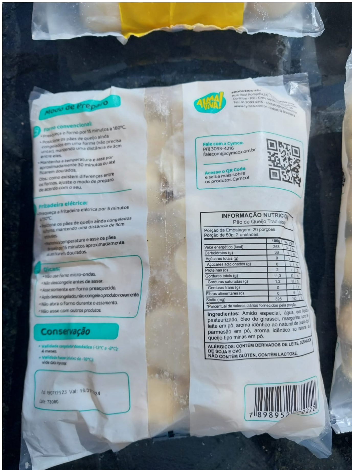
Imagem 4- foto da descrição dos ingredientes do produto, indicando a ausência de queijo e presença de soro