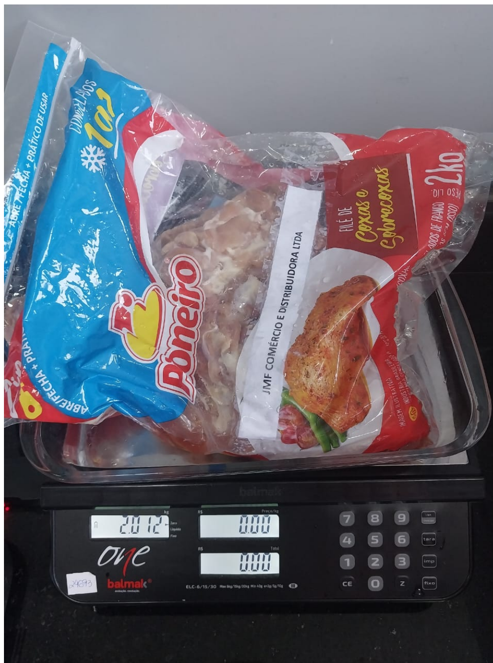
Imagem 5- foto do peso da amostra 2