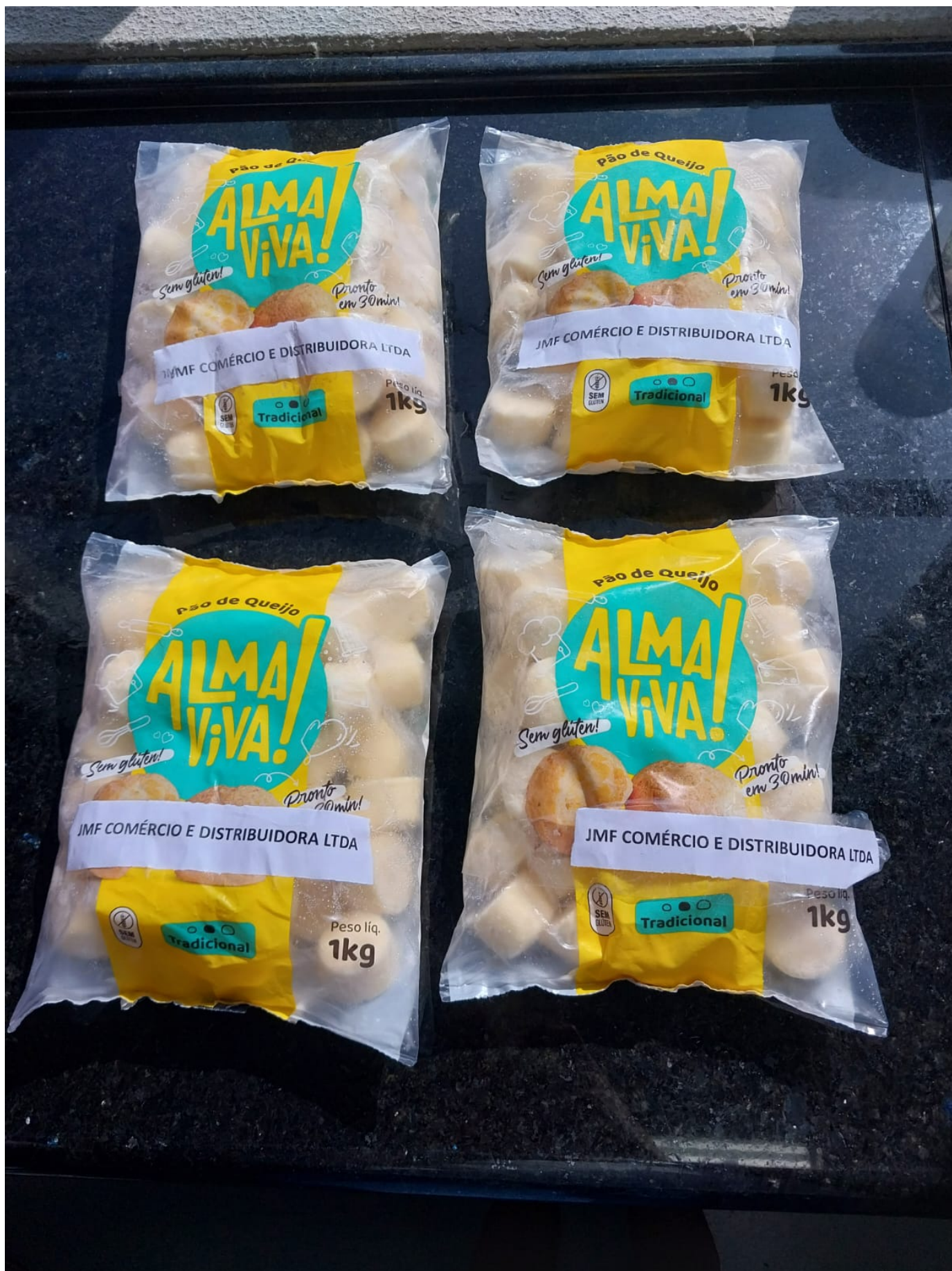
Imagem 2- foto das quatro amostras e verso da embalagem