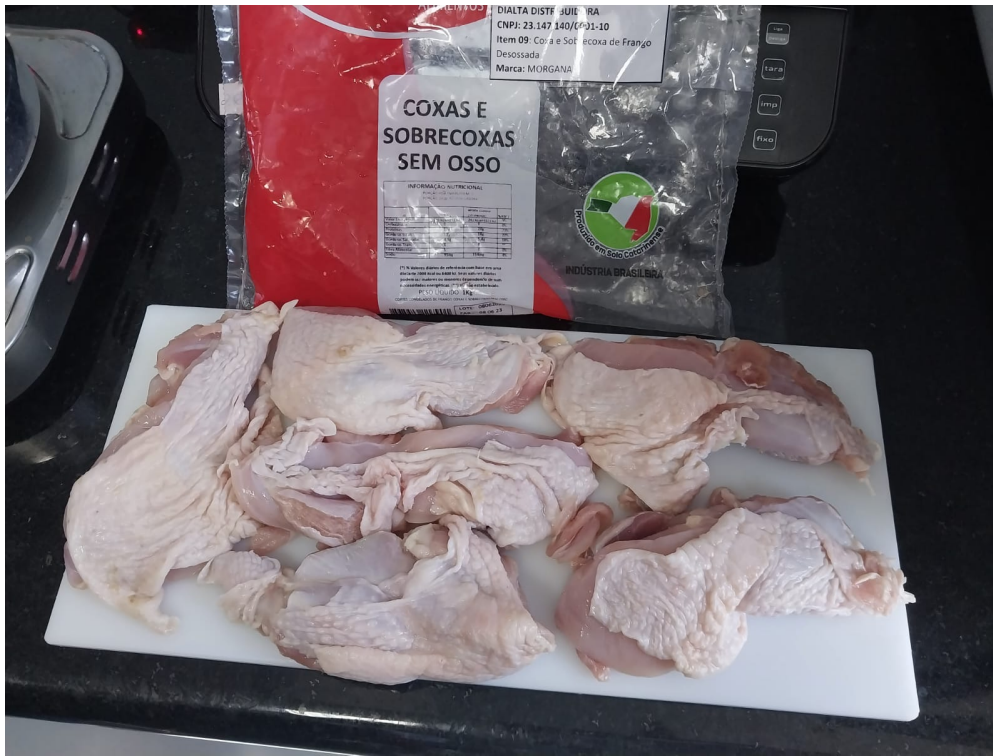
Imagem 5- Amostra 2 descongelada com presença de pele.