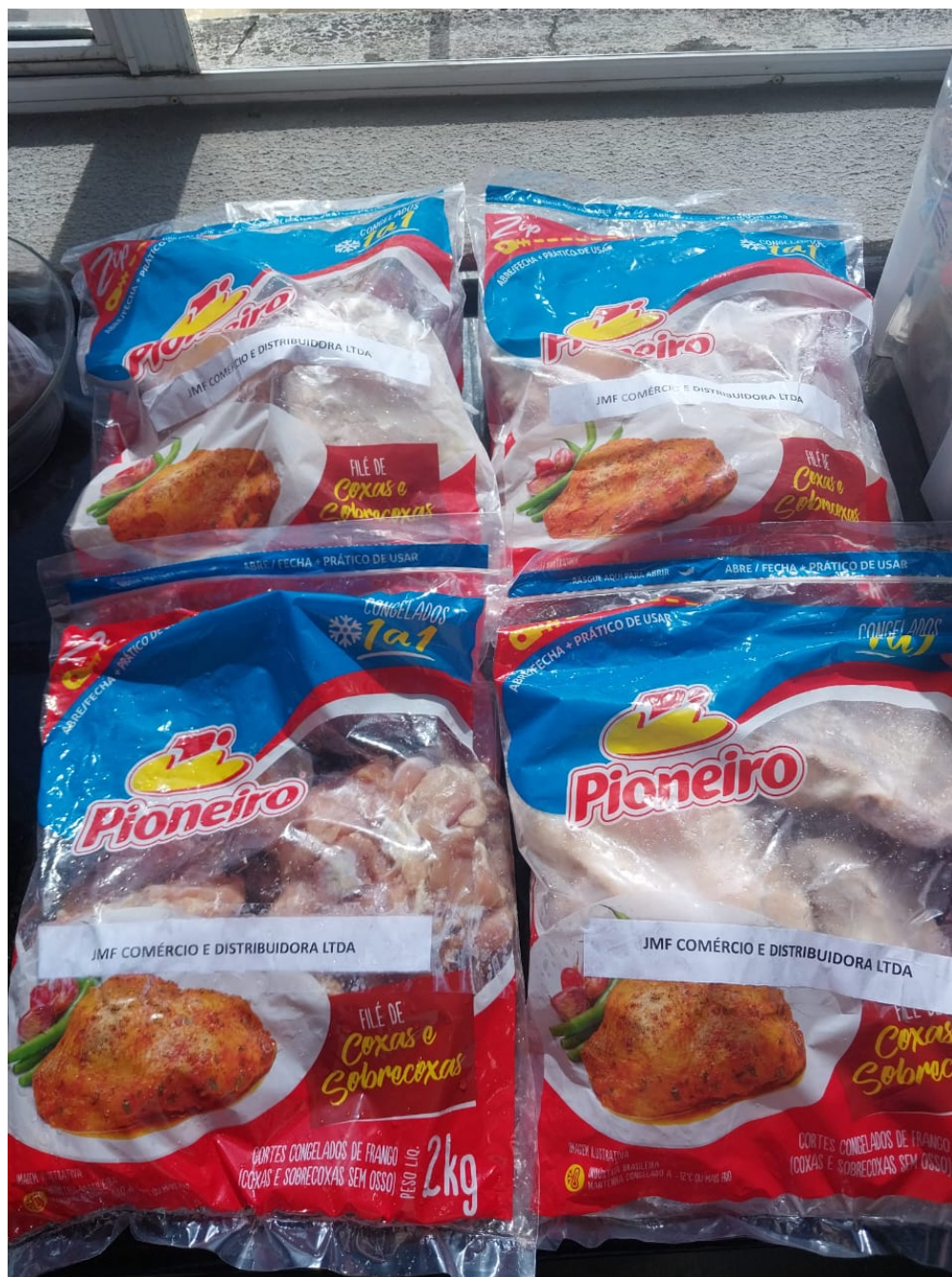
Imagem 2 foto da embalagem do produto