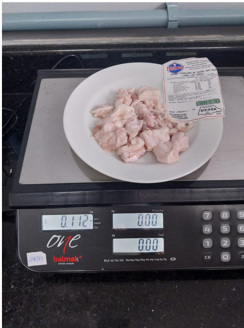
Imagem 6- foto da primeira amostra analisada- Peso da Embalagem: 0.008 Kg