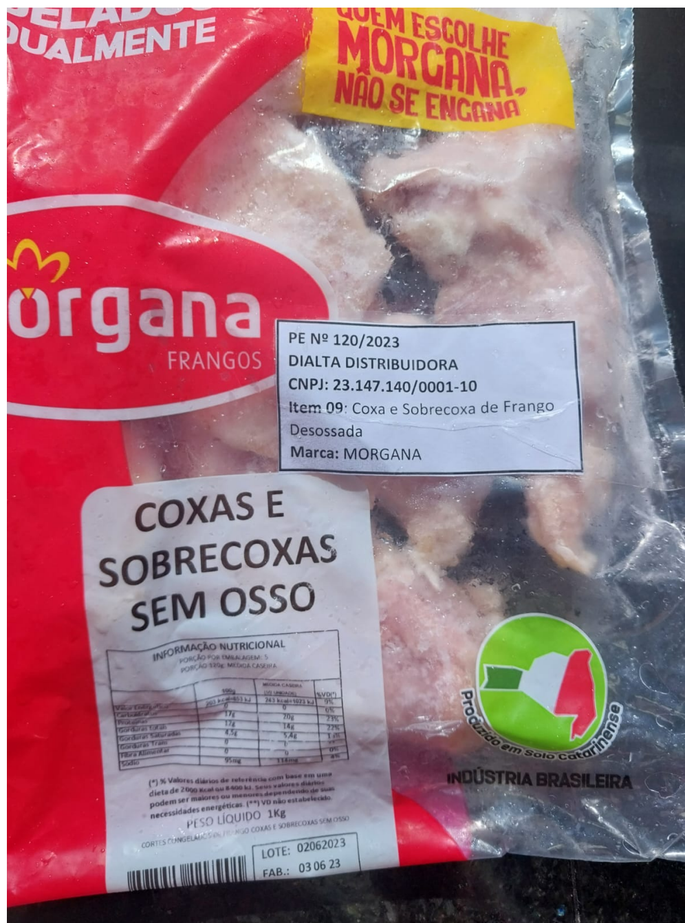
Imagem 4- Amostra 1 descongelada com presença de pele.