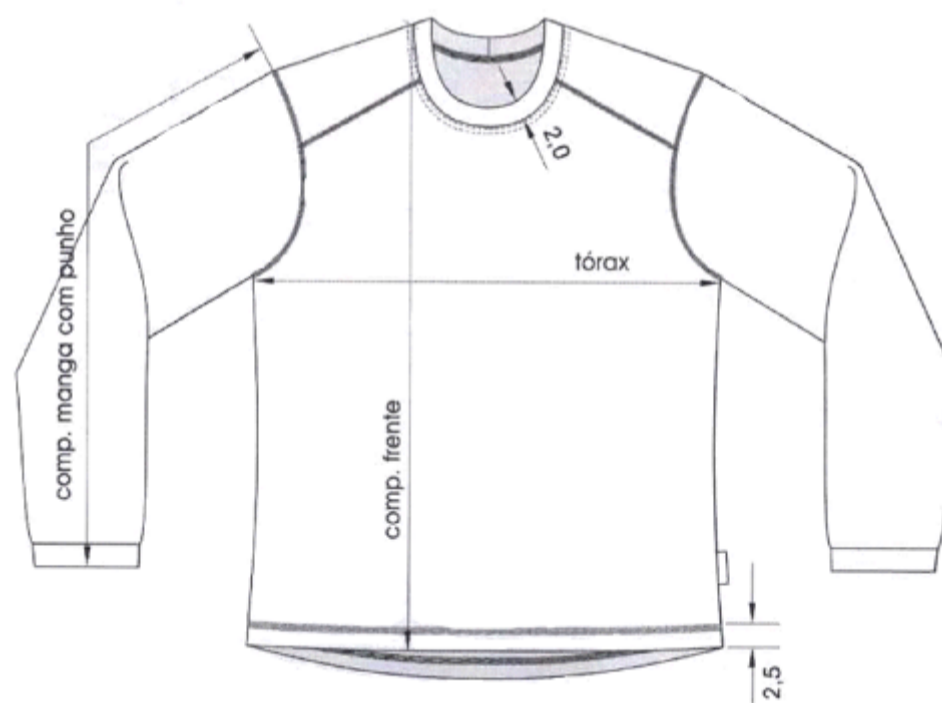
Figura 3 – Detalhes da frente