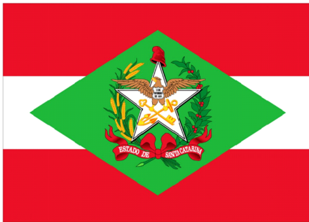
Figura 1 – Bandeira do Estado de Santa Catarina