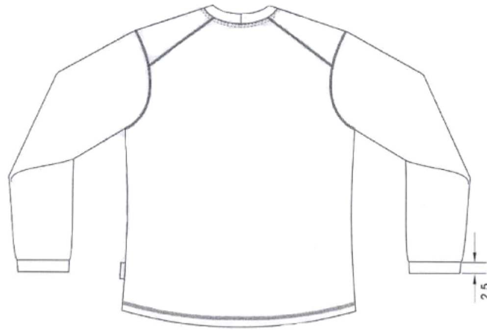
Figura 4 – Detalhes das costas