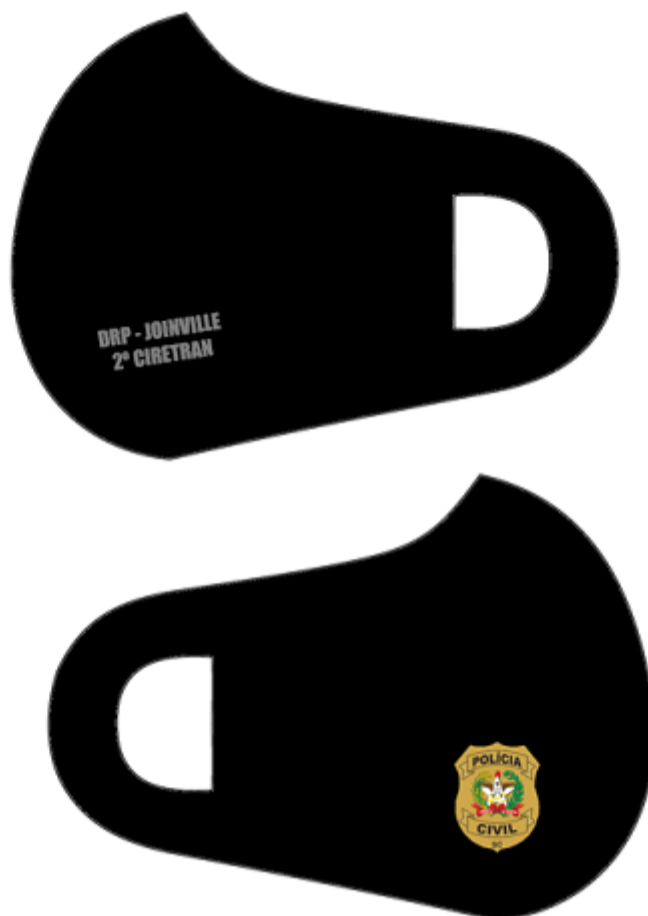
Figura 6 - Detalhes das Máscaras