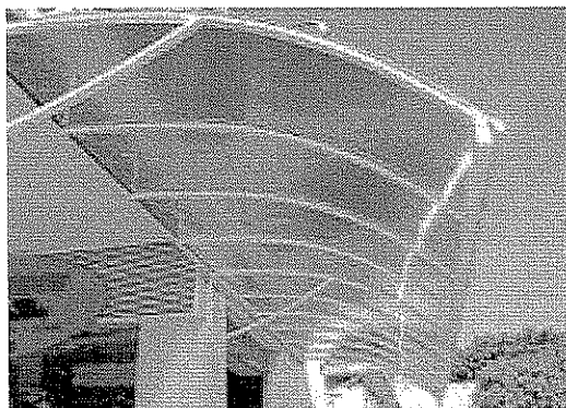
Figura 01 – Cobertura em polícarbonato tipo meia-lua.