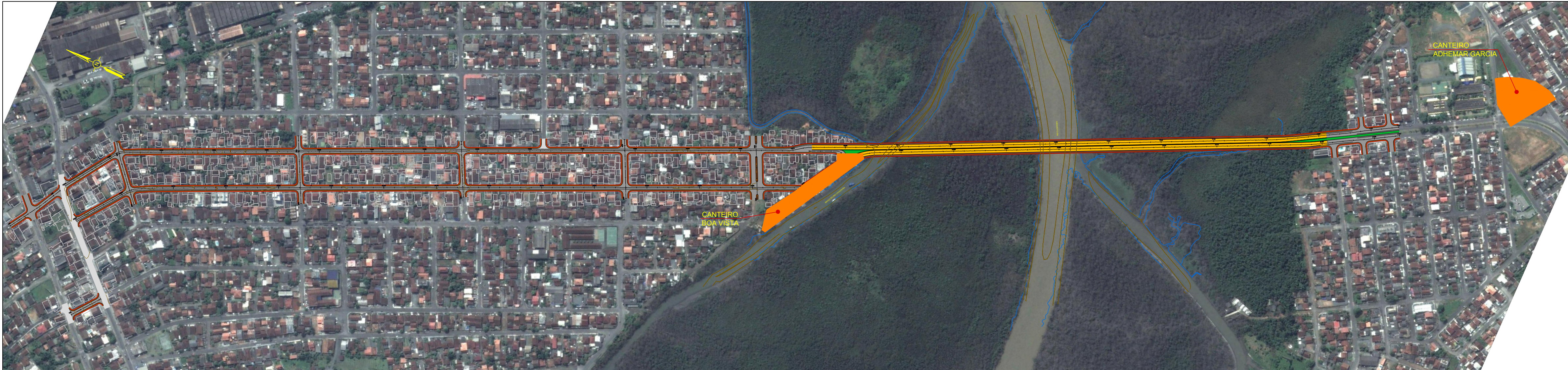
PLANTA GERAL ESC: S/ESC.