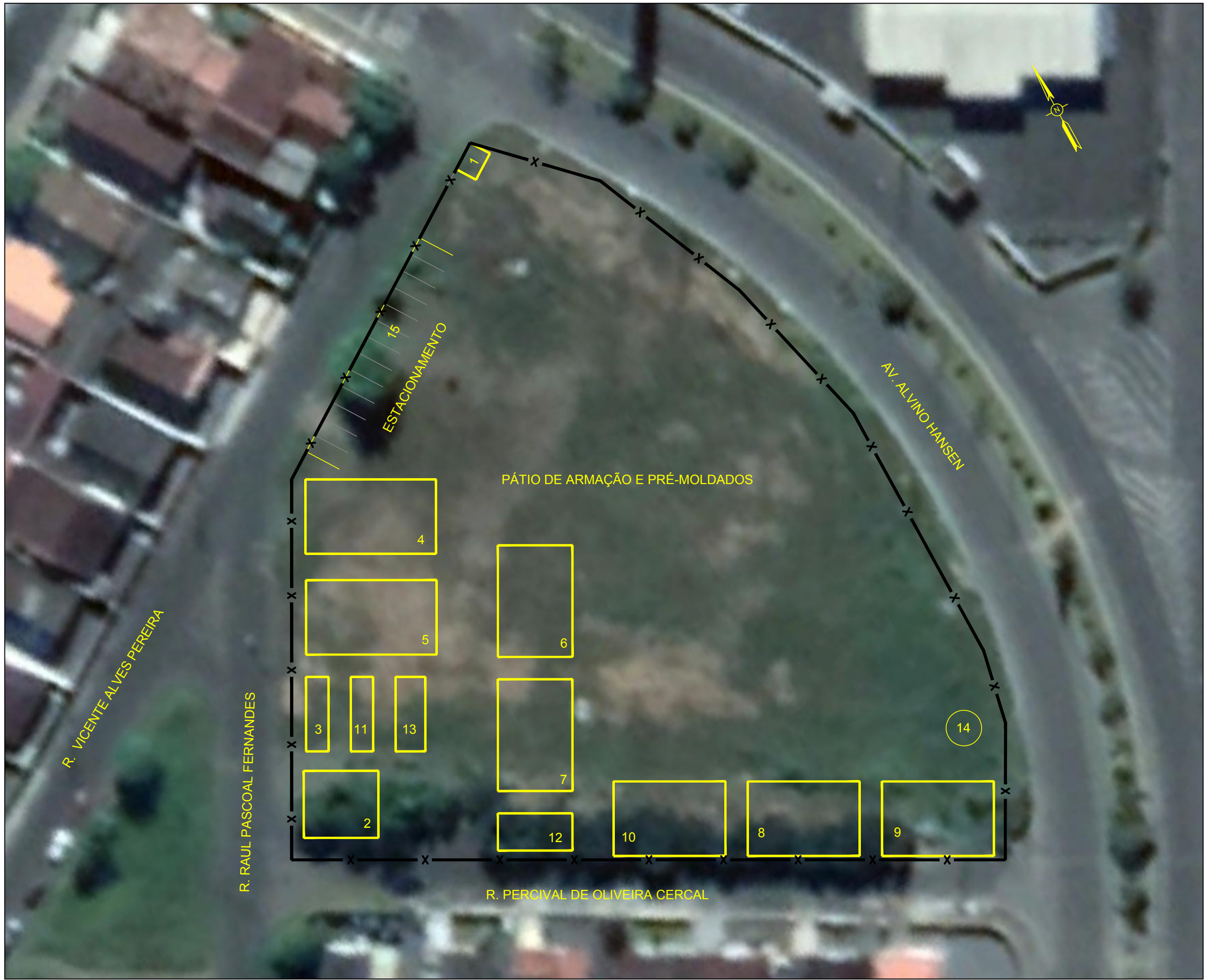
CANTEIRO — ADHEMAR GARCIA (VER NOTA 1) ESC: 1/500