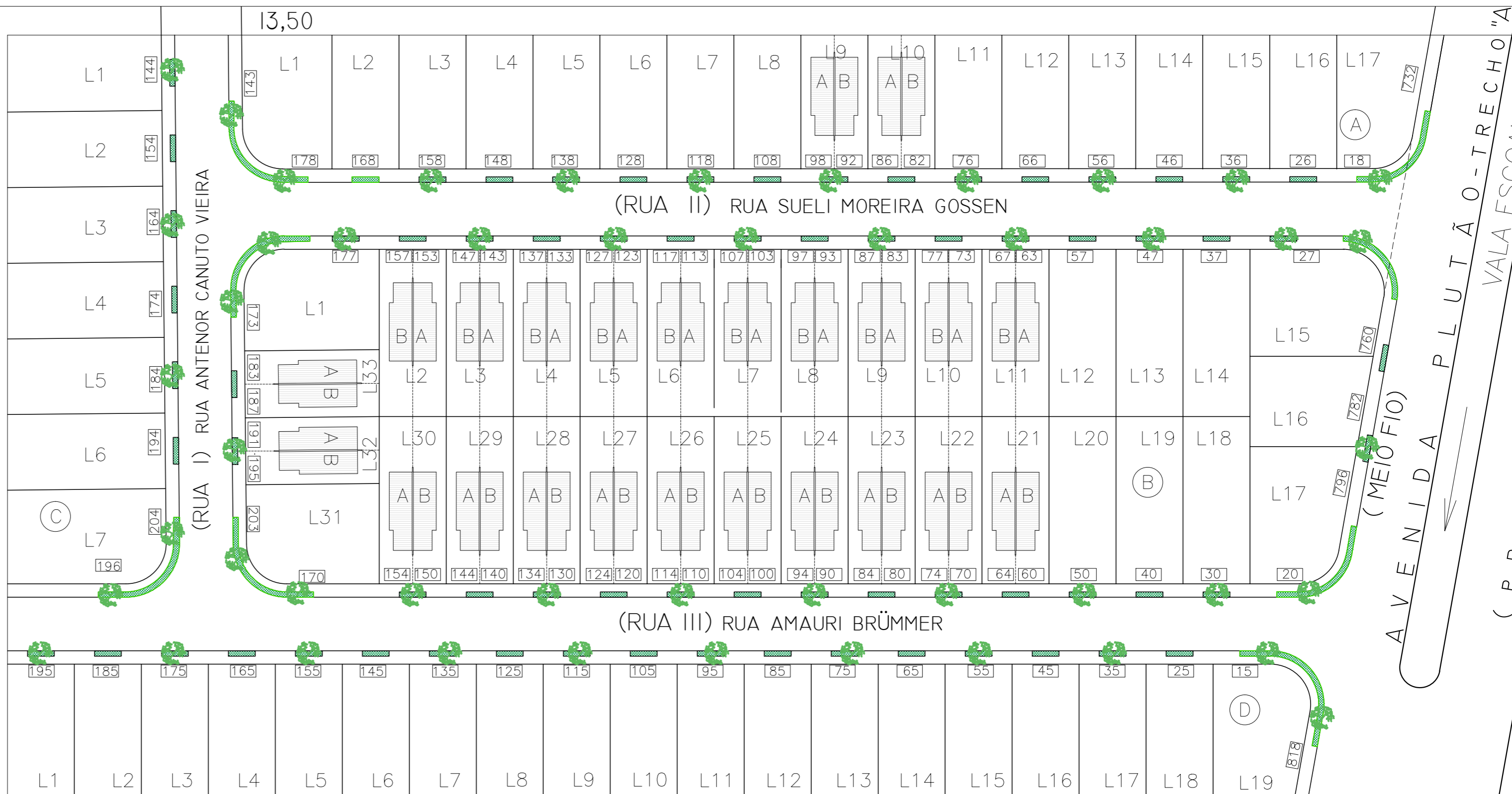
URBANÍSTICO ESC: 1/400