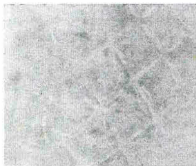
(Figura 4) Imagem de alta resolução em produto não utilizado demonstra falta de uniformidade na distribuição de material absorvente.