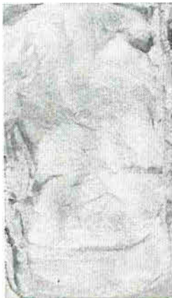
(Figura 1) Deformações na camada interna revelam baixa absorção do material avaliado.