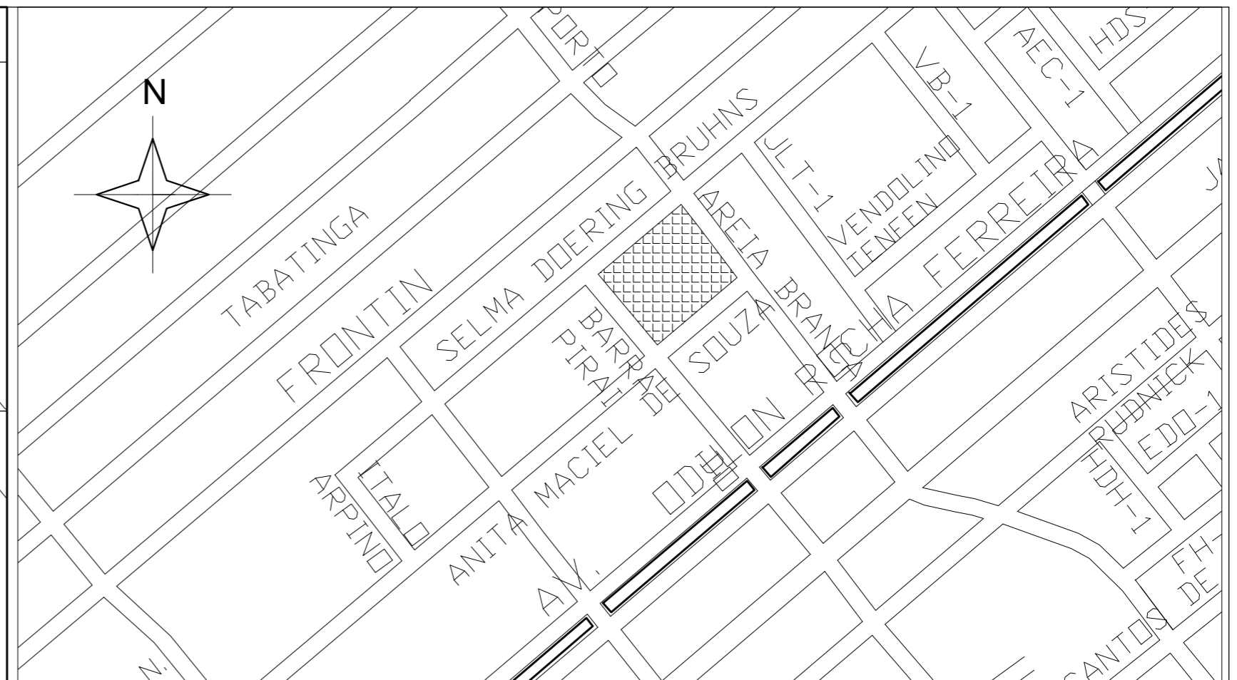
Quadro de Identificação das Matrículas