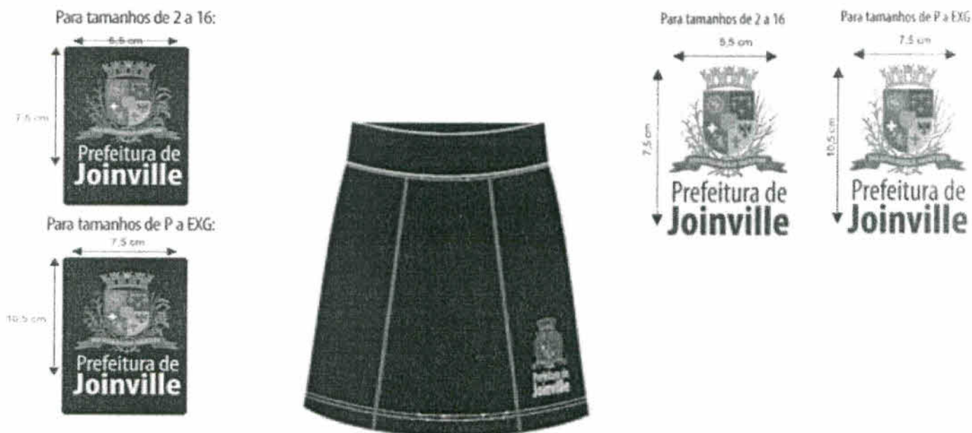
TABELA DE MEDIDAS:

ser costurada com elástico de 4cm de largura, para todos os tamanhos, pregado em máquina overloque e rebatido em máquina catraca 4 agulhas, ponto corrente. Na cintura parte da frente deverá ser costurado cócs com 3cm pronto, para todos os tamanhos, costurado em máquina overloque. A saia deverá ser presa nas duas laterais do short. A bainha da barra da saia deve ser feita com 2 cm de largura, em máquina galoneira 2 agulhas 0,6cm. Para a confecção da saia deverá ser utilizada a linha em 100% poliéster, nº 120, na cor do tecido. A etiqueta de identificação deve ser de cor branca, afixada e caráter permanente e indelével na parte interna cada peça, no centro do elástico traseiro, os caracteres tipográficos dos indicativos na cor preta, devendo ser uniformes e informar a razão social, CNPJ, marca, composição do tecido, símbolos/instruções de lavagem e tamanho. Na parte frontal, lateral esquerda da saia, deverá conter o brasão do município, em estampa silkscreen, conforme LOGOTIPIA, Localizado na lateral esquerda da saia, centralizada entre o galão e a costura lateral. A peça deve estar isenta de qualquer defeito que comprometa a sua apresentação.