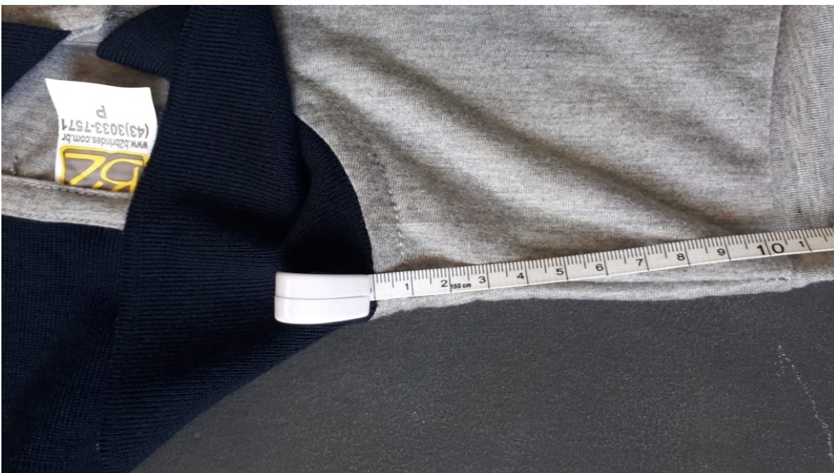
Foto 12 - Cota I - Altura do Peitilho.