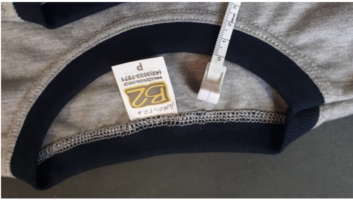
Foto 3 - Cota C - Altura da Cava.