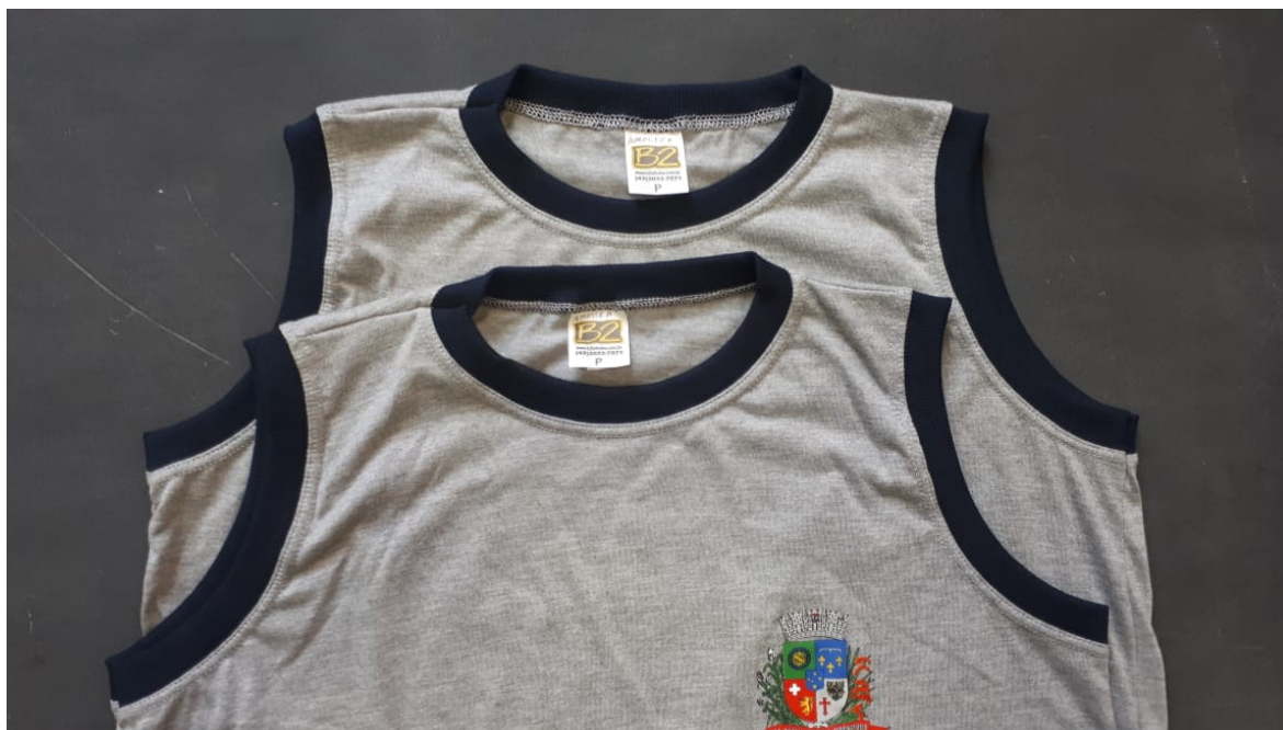
Foto 2 - Largura Debrum.