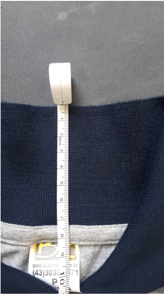
Foto 17 - Cota G - largura do Ombro