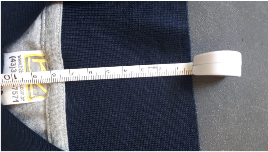
Foto 20 - Cota G - largura do Ombro