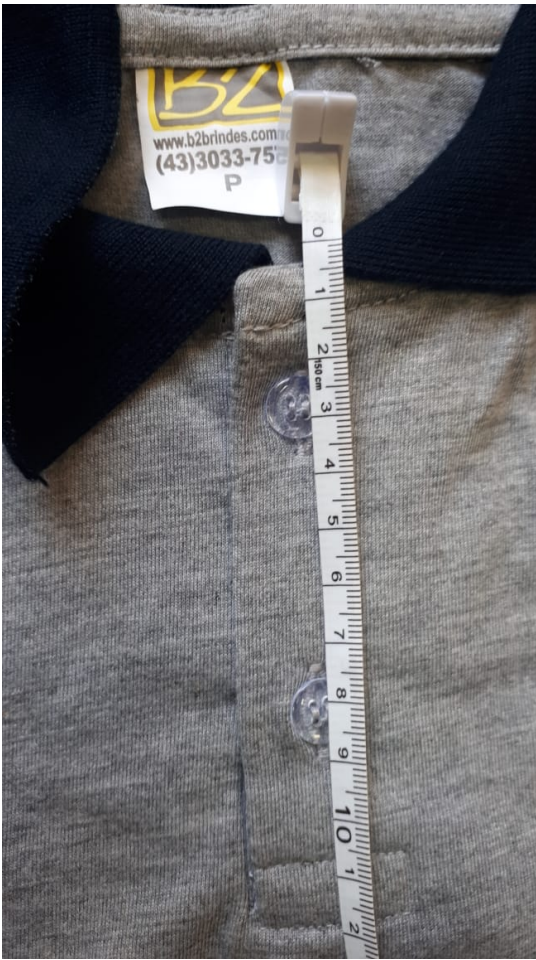
Foto 15 - Altura do Peitilho