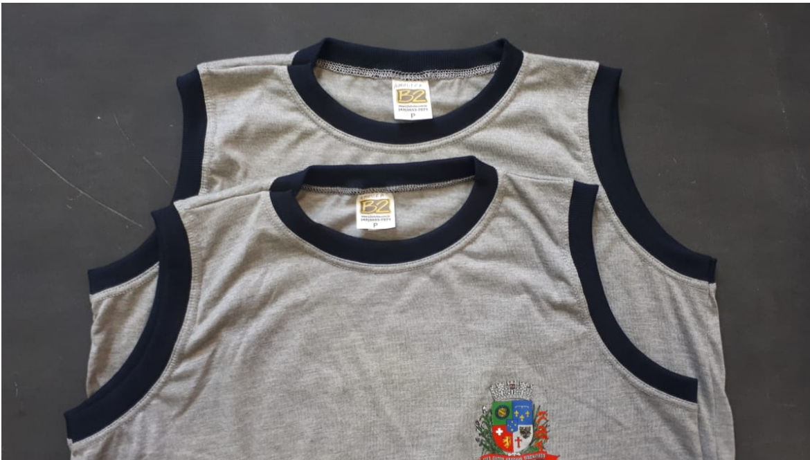
Foto 5- Largura debrum.