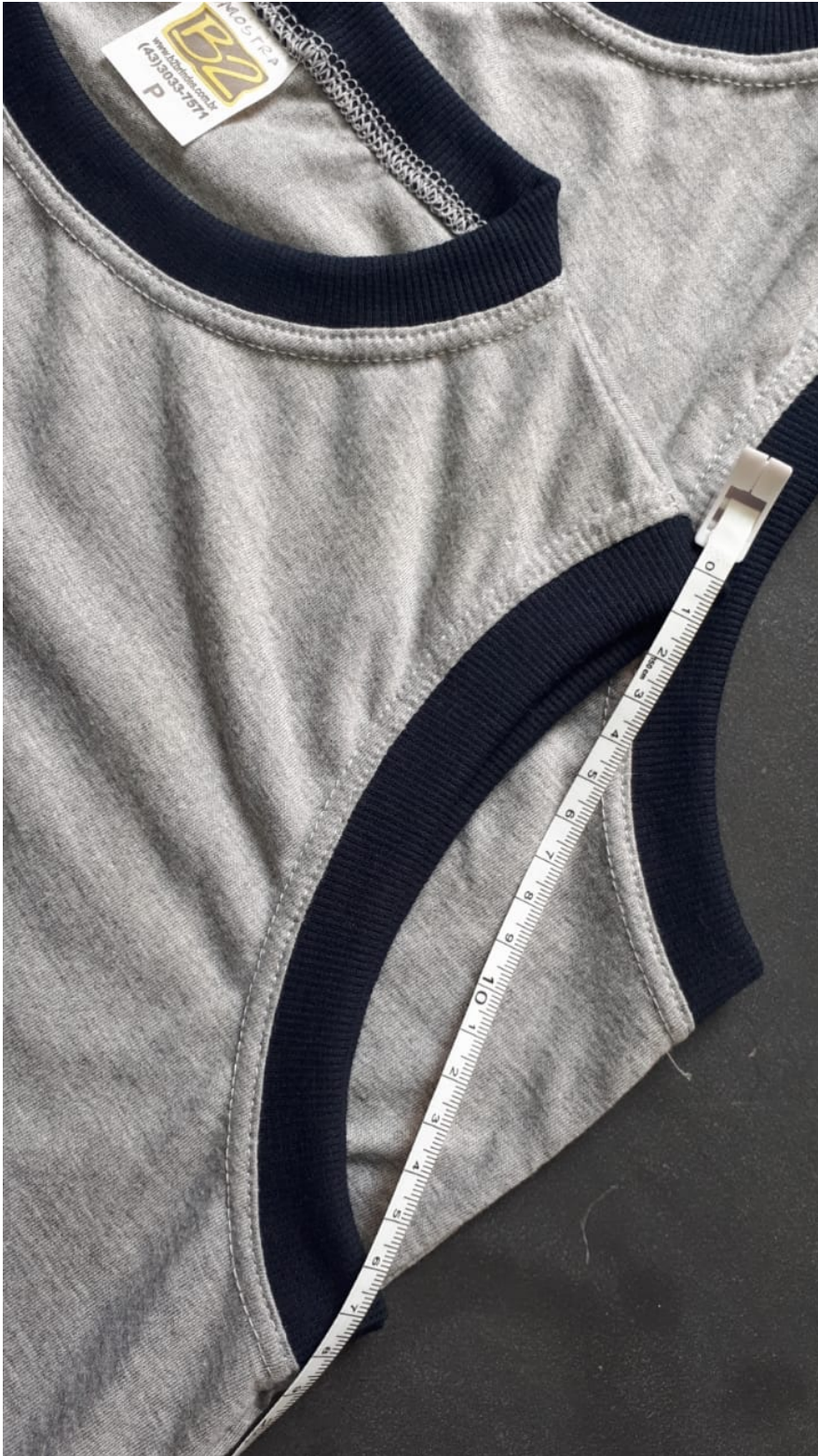
Foto 4 - Coto E - Altura do decote.