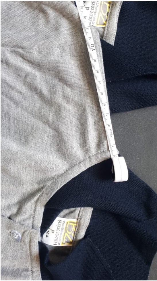
Foro 18 - Cota I - Altura do Peitilho