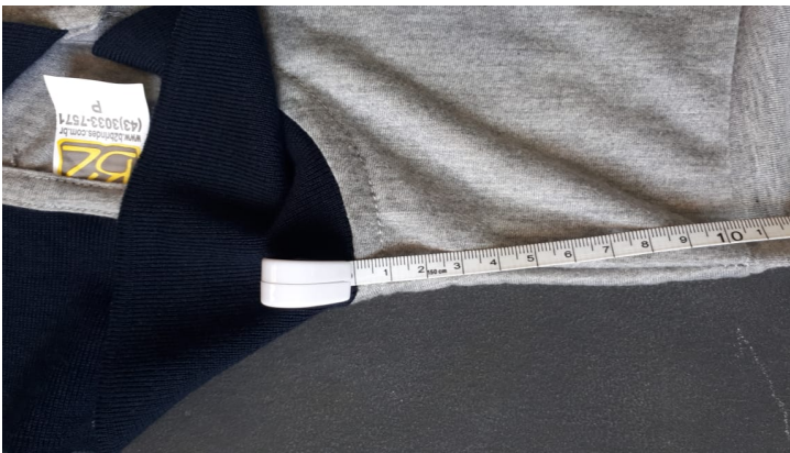
Foto 21 - Cota I - Altura do Peitilho