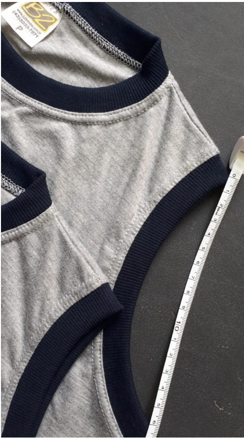
Foto 7 - Coto E - Altura do decote.