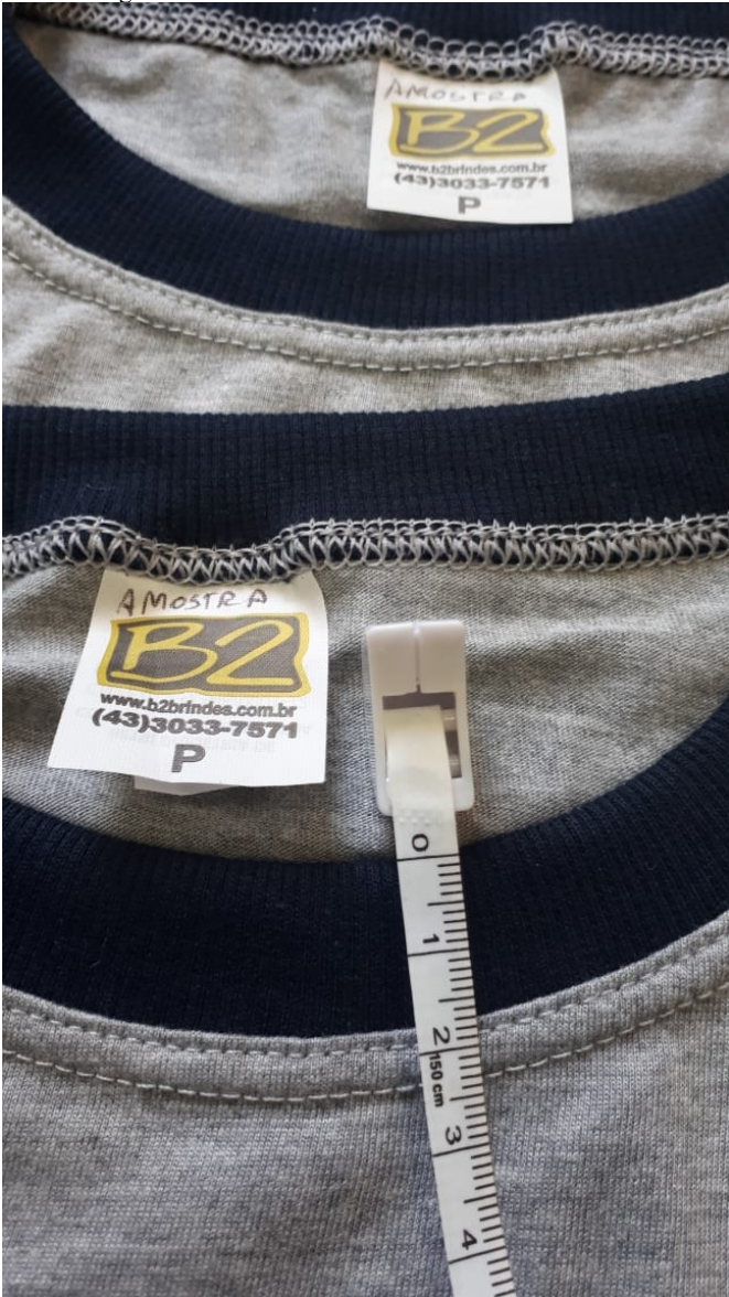
Foto 6 - Cota C - Altura da Cava.