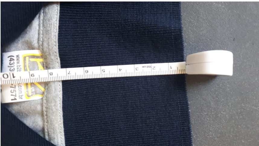
Foto 14 - Cota G - largura do Ombro