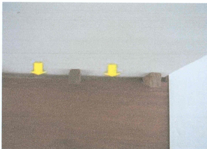
Figura 02 - Junta de dilatação adequada.

Deverá ser deixado um espaço de 15 mm, em todas as laterais do assoalho (com exceção da porta x soleira) para a junta de dilatação, conforme Figura 2.