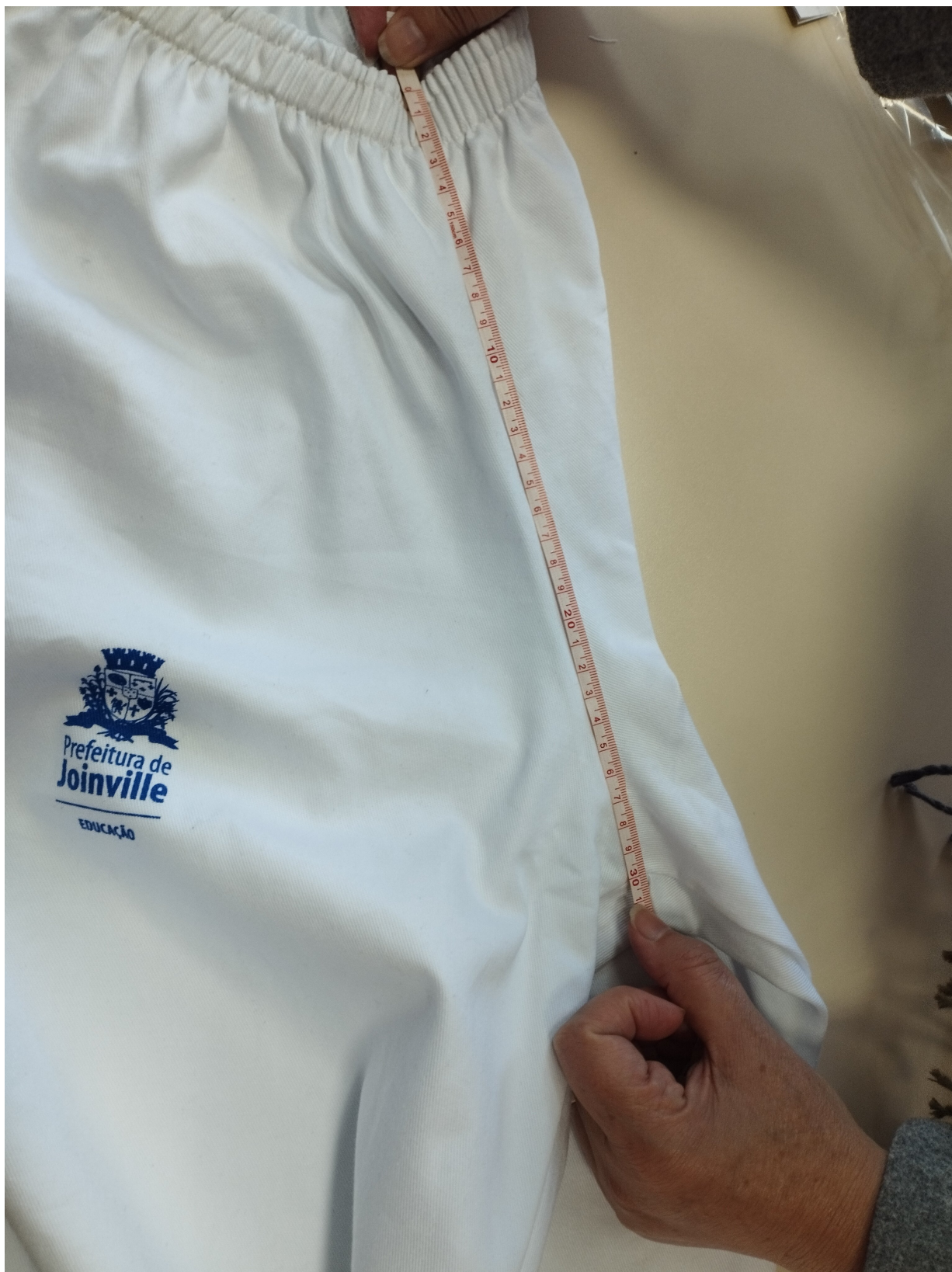
Foto7. Identificação de medida do gancho da frente