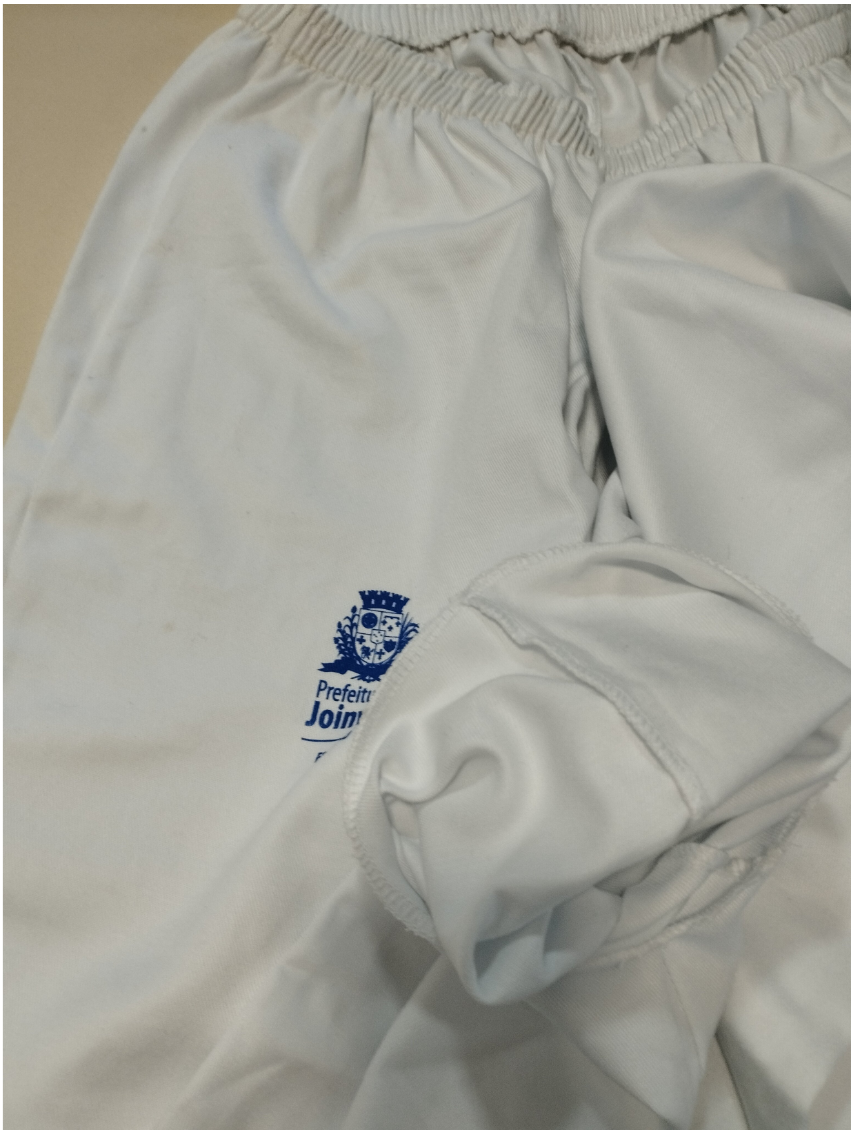
Foto 1. Costura em overlock simples.