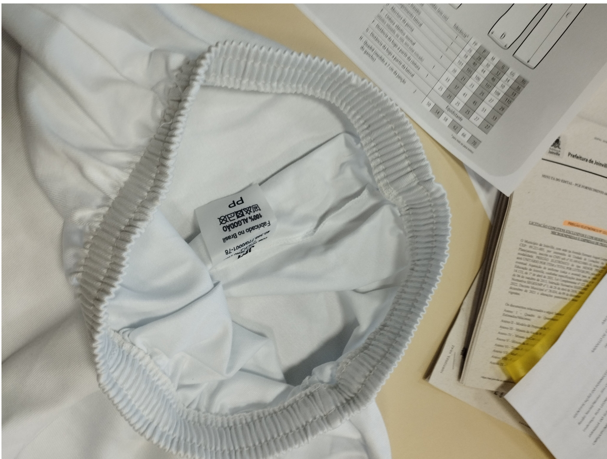
Foto 6. Etiqueta aplicada no gancho traseiro da peça