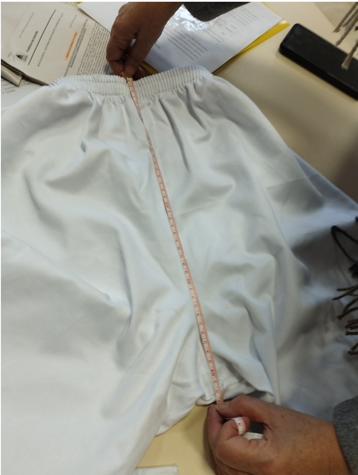
Foto 8. Identificação de medida do gancho traseiro.