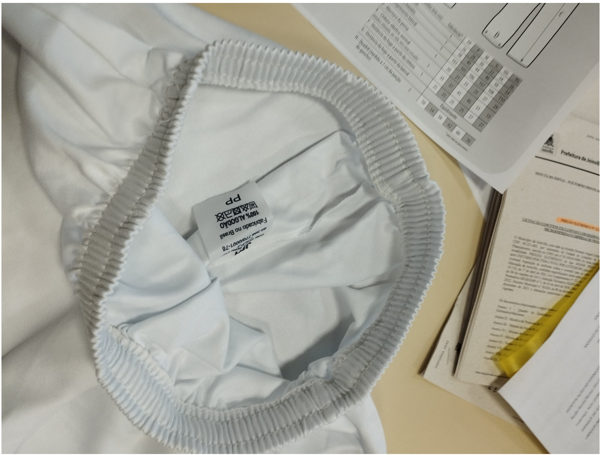
Foto 6. Etiqueta aplicada no gancho traseiro da peça