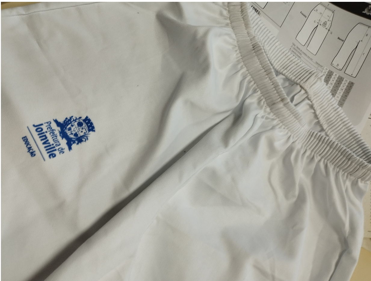
Foto 5. Identificação da aplicação da logotíпия no lado direito da peça.