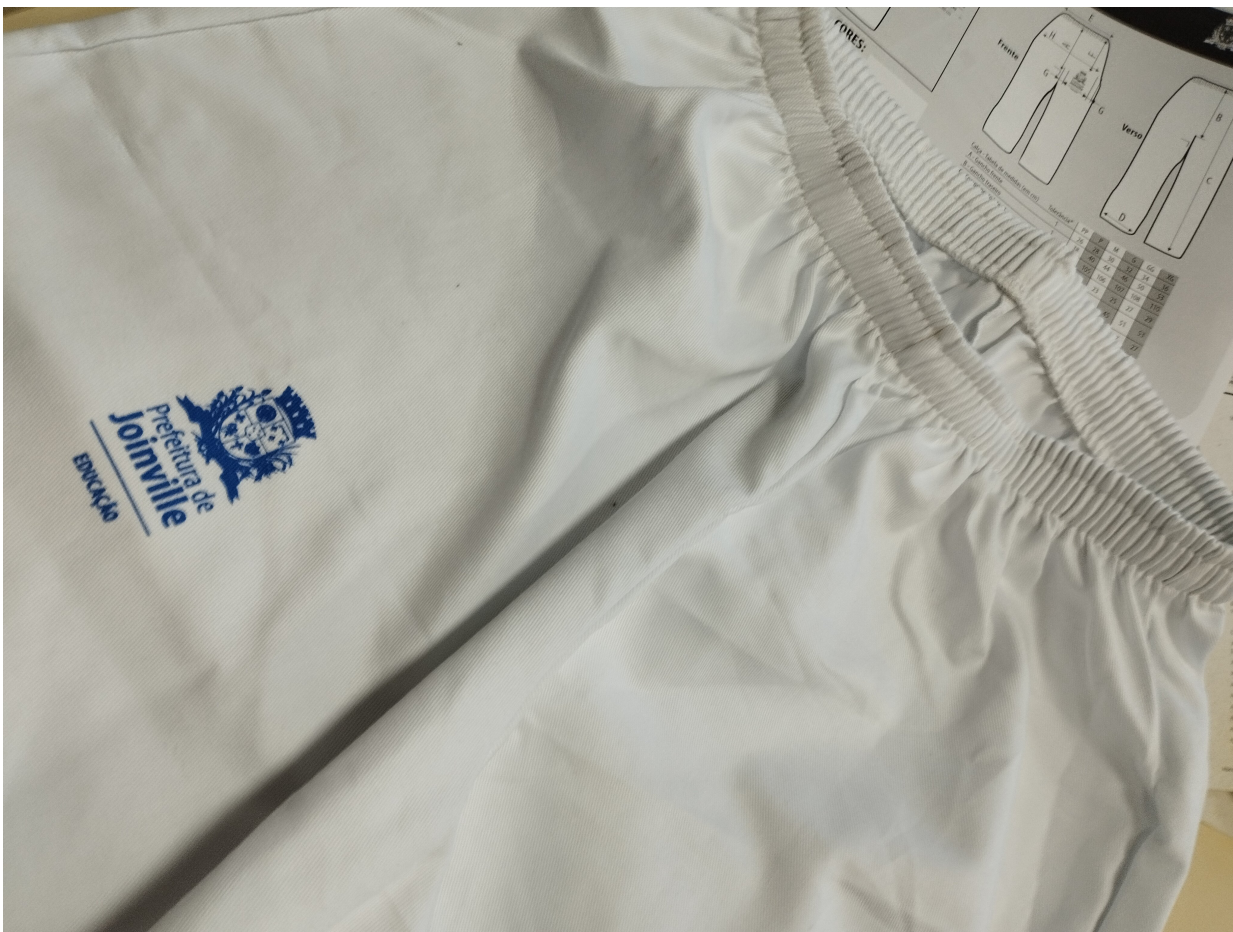
Foto 3. Ausência de cadarço aplicado na peça.