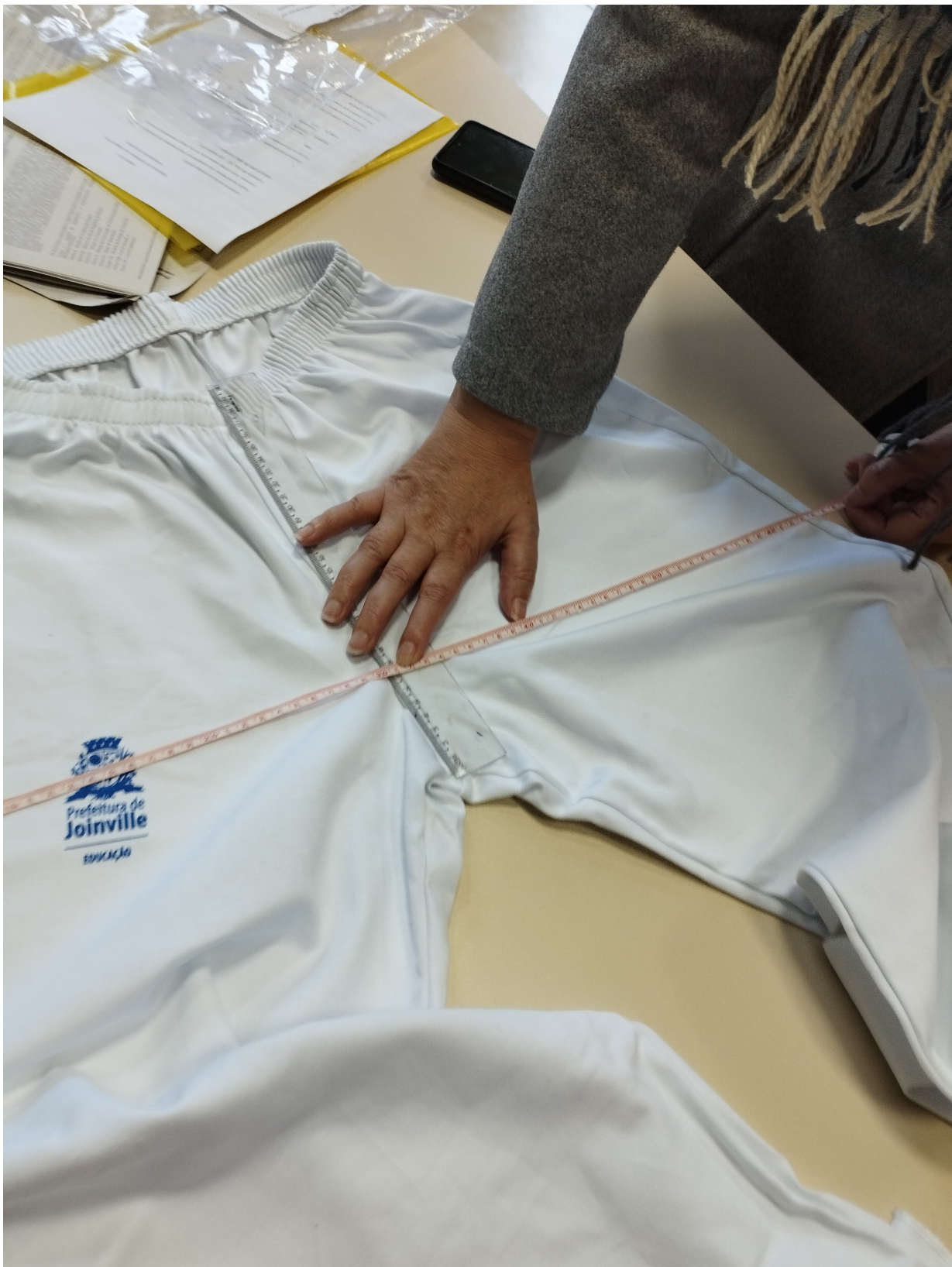
Foto 9. Identificação de medida do quadril