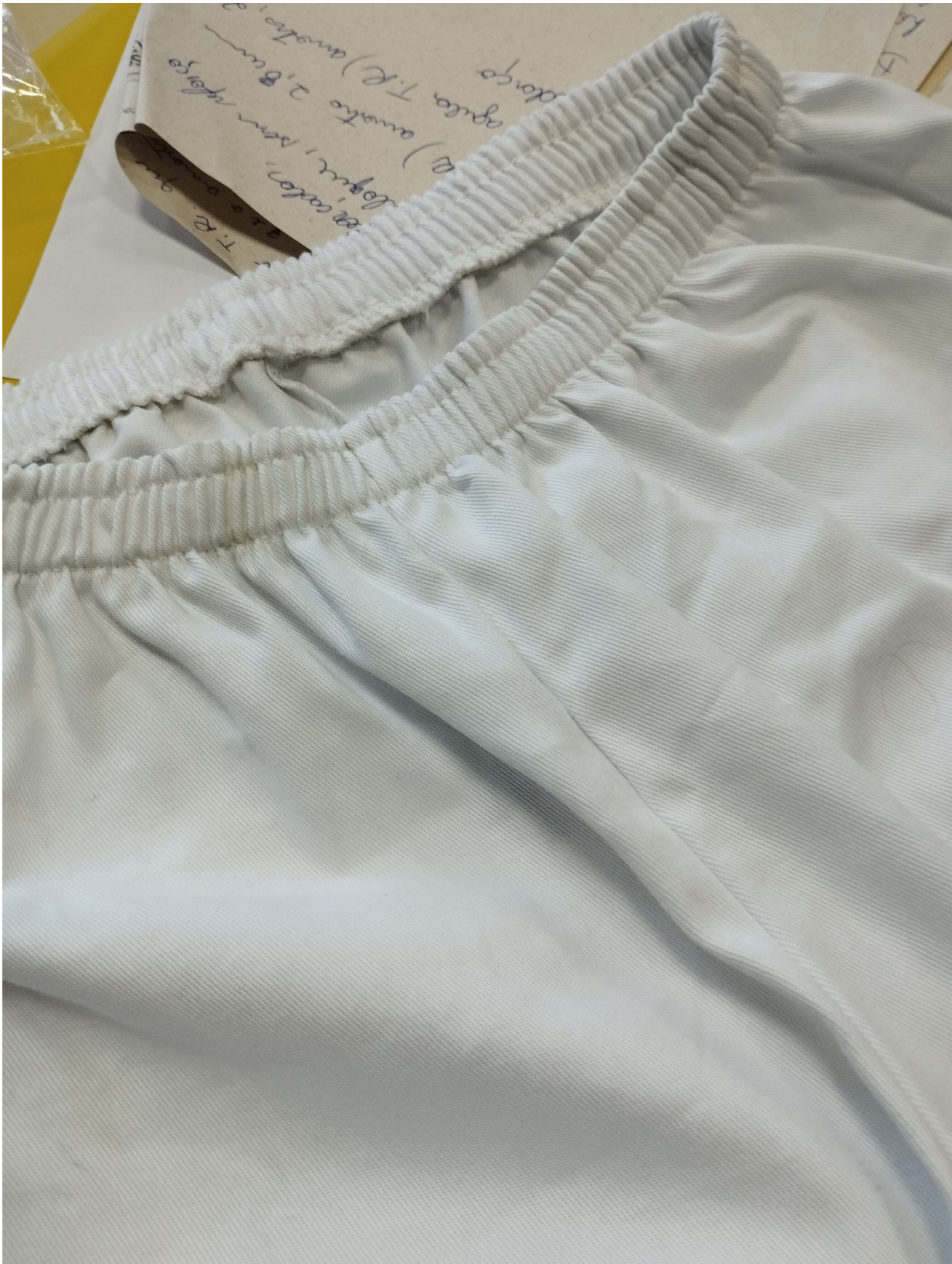
Foto 3. Ausência de cadarço aplicado na peça.