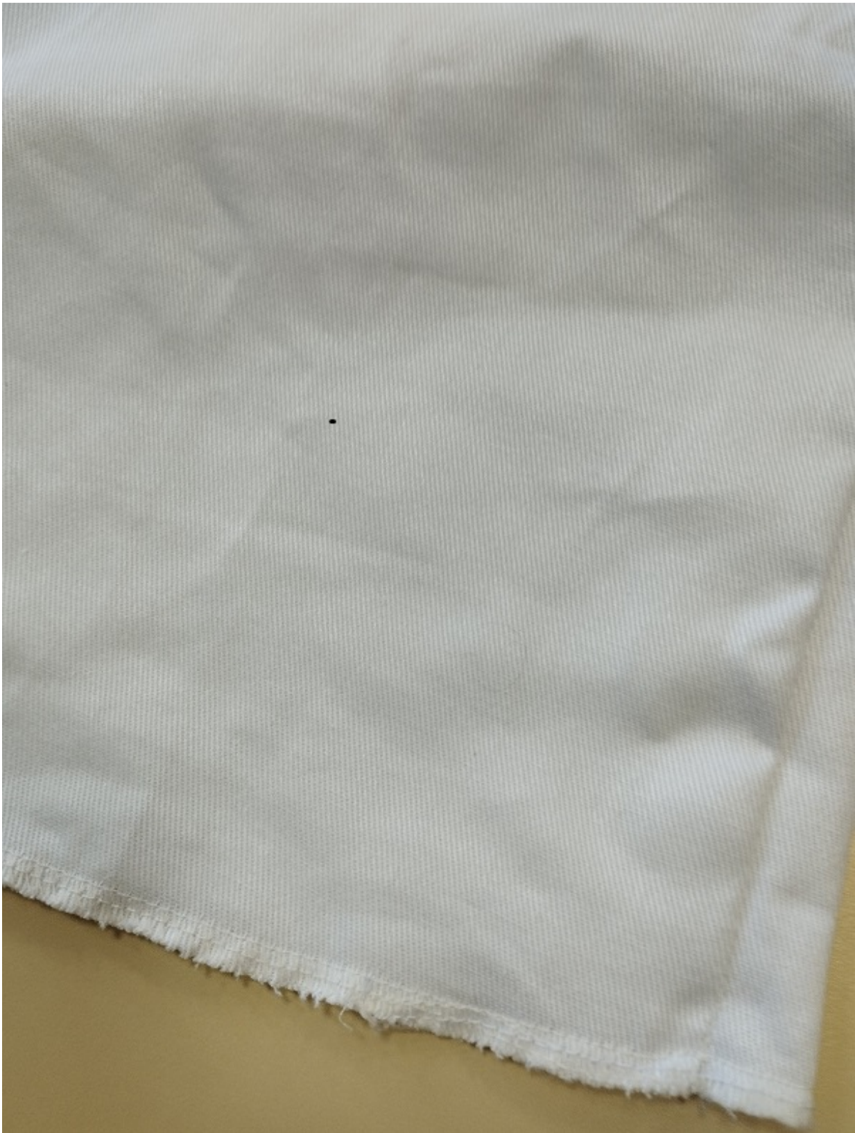
Foto 4. Ausência de bainha na barra da peça