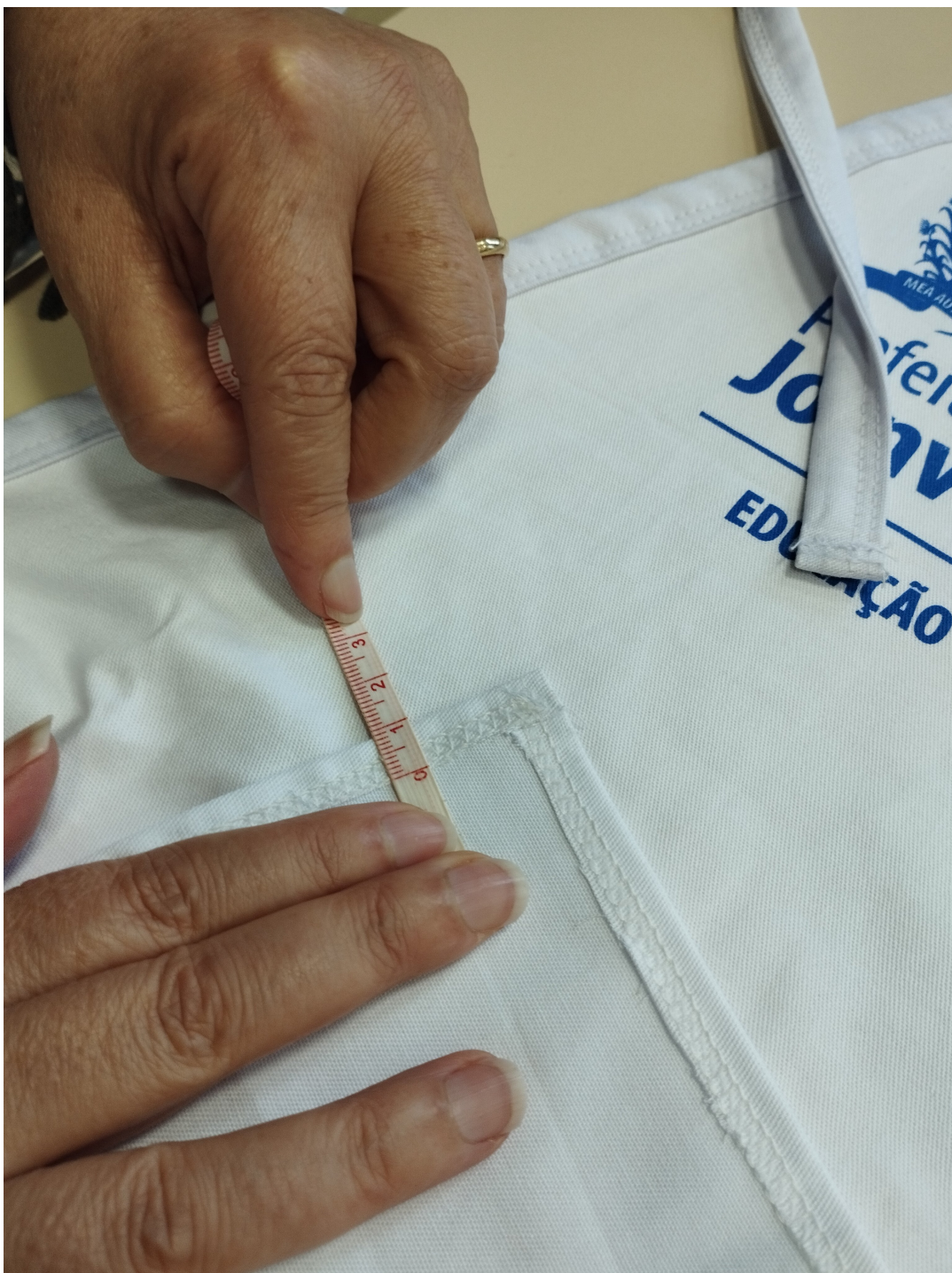
Foto 2. Identificação da bainha inferior da peça.