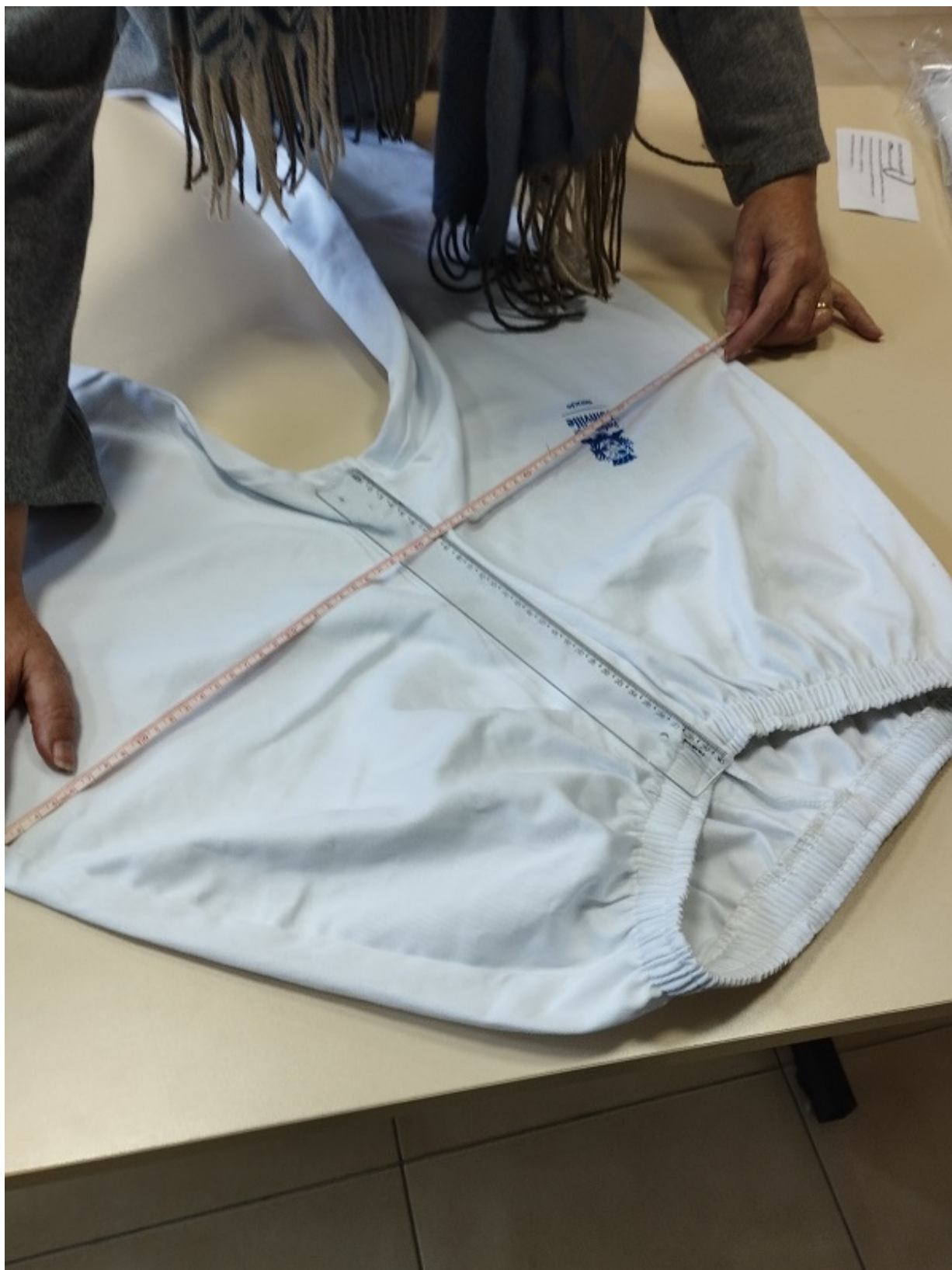
Foto 9. Identificação de medida do quadril