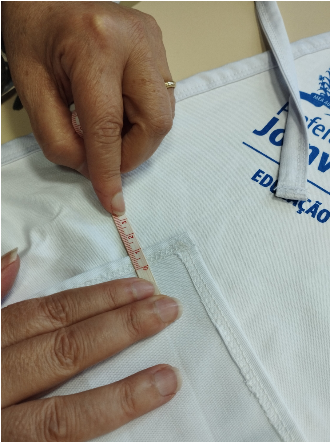
Foto 2. Identificação da bainha inferior da peça.