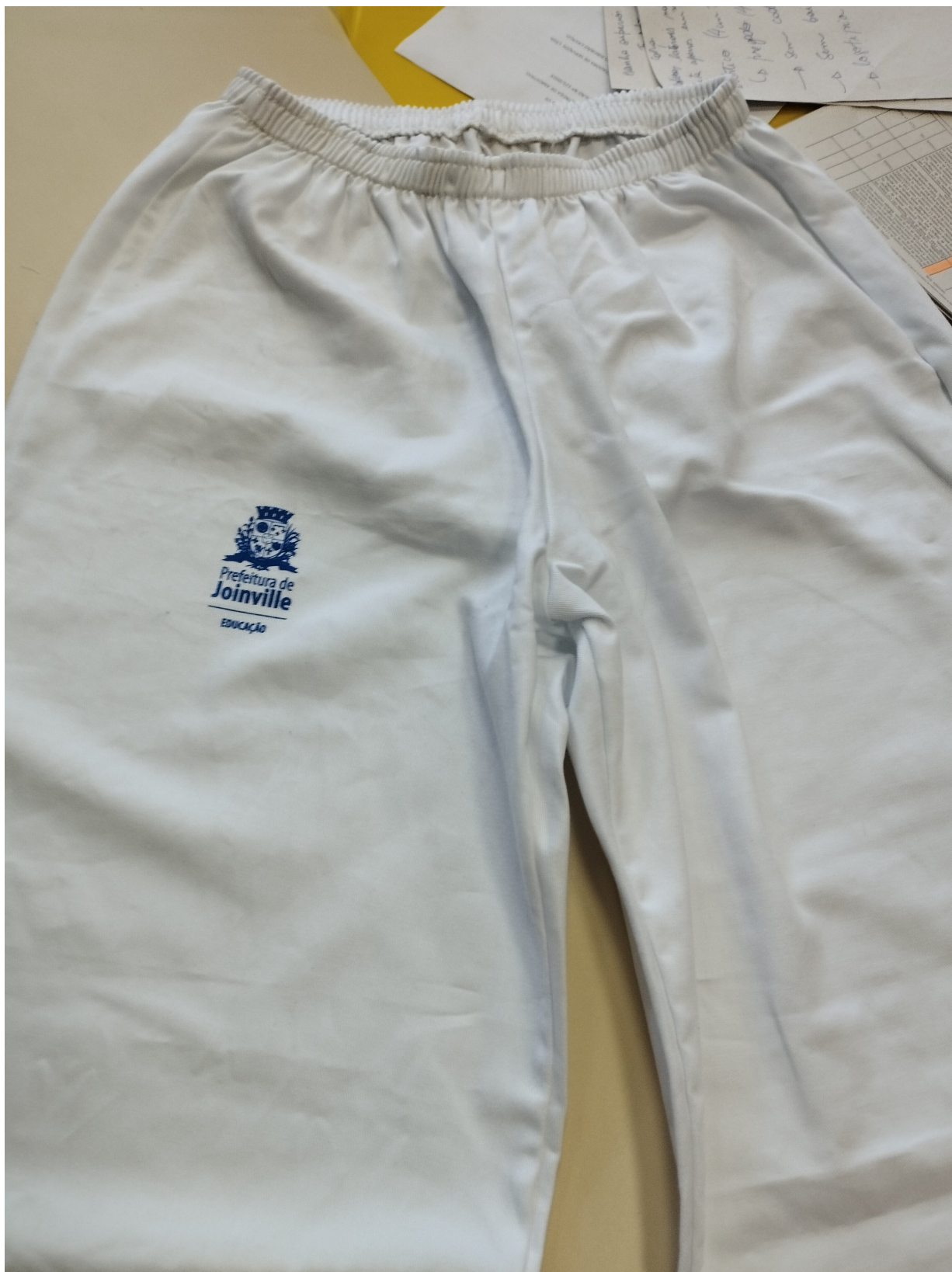
Foto 5. Identificação da aplicação da logotípia no lado direito da peça.