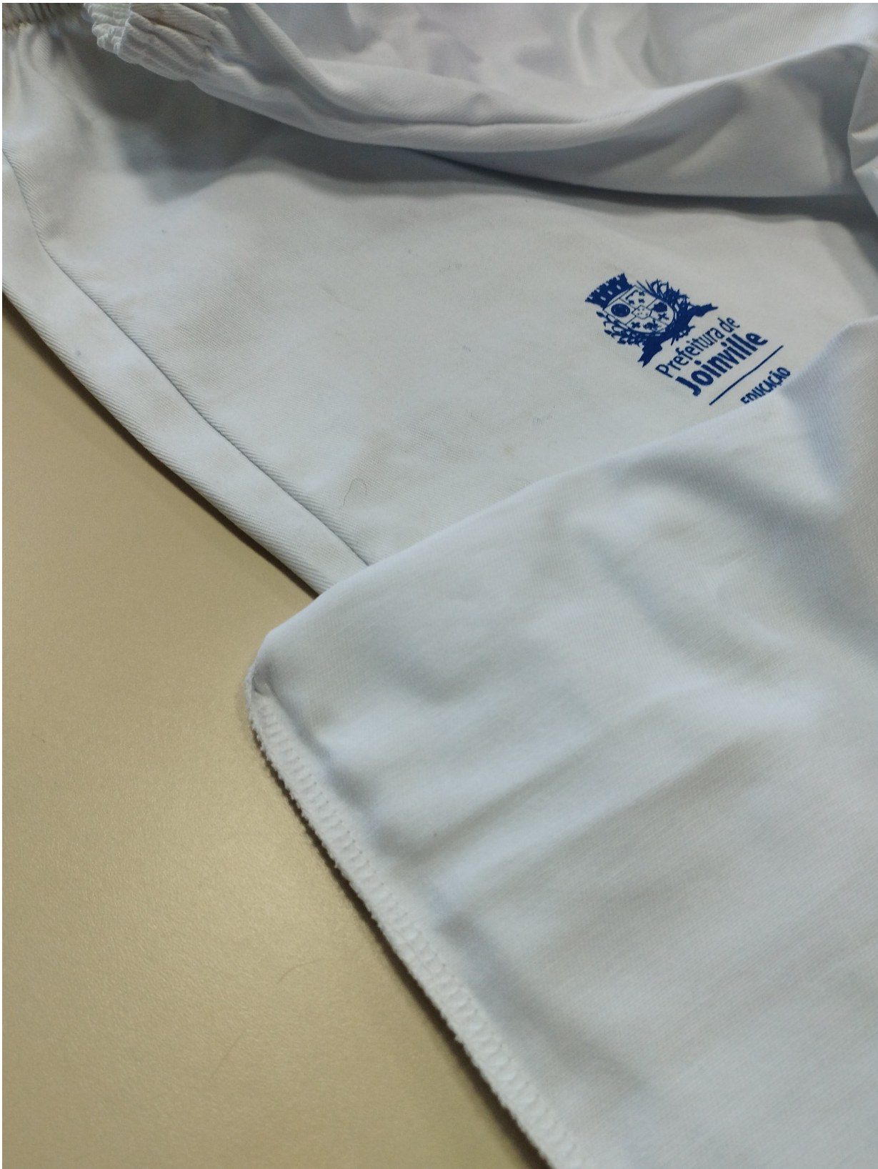
Foto 4. Ausência de bainha na barra da peça