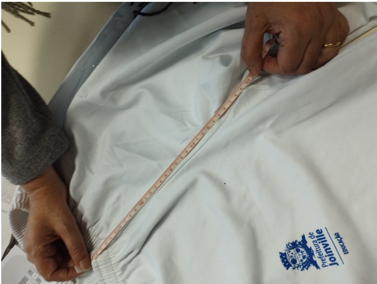
Foto7. Identificação de medida do gancho da frente