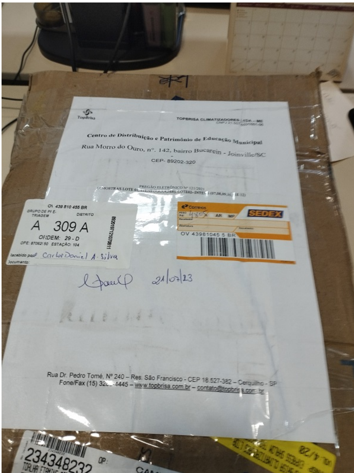
Foto 1 . Identificação da amostra entregue