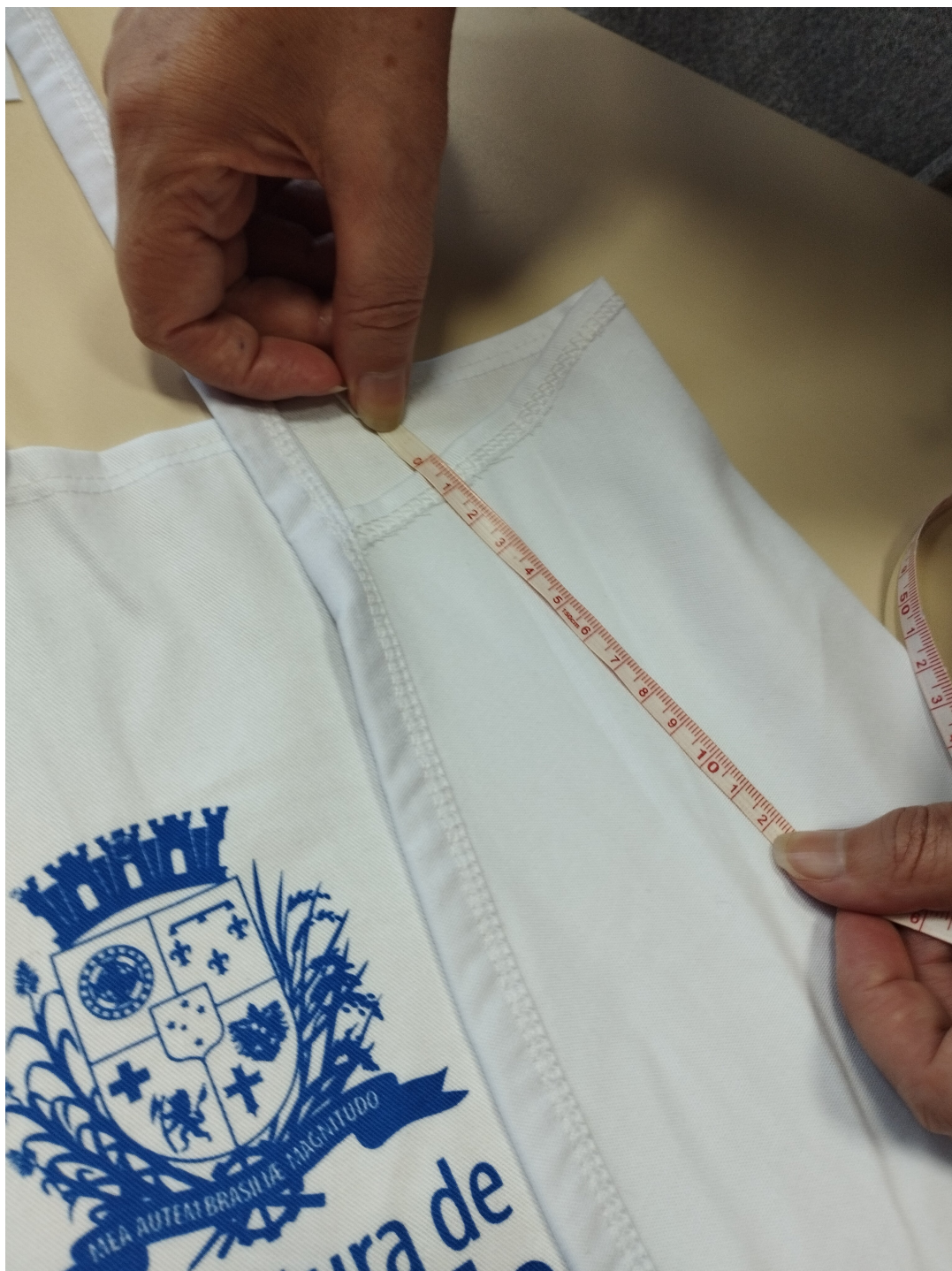
Foto 1. Identificação da bainha superior da peça