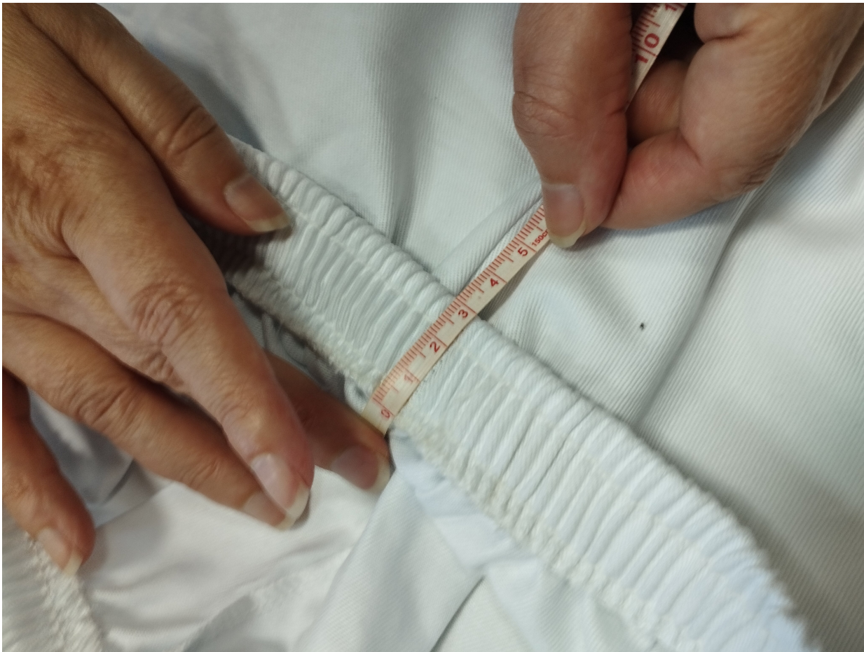
Foto 2. Identificação das medidas do elástico e costura aplicado na peça.